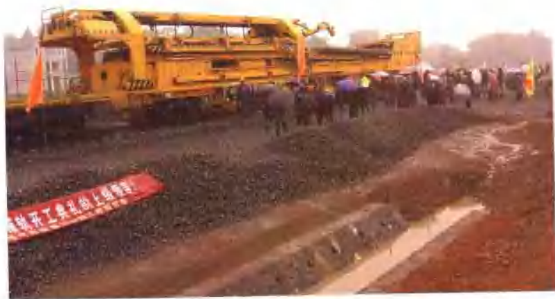
▲ 浙赣铁路电气化工程采用具有世界先进水平的长轨铺设机