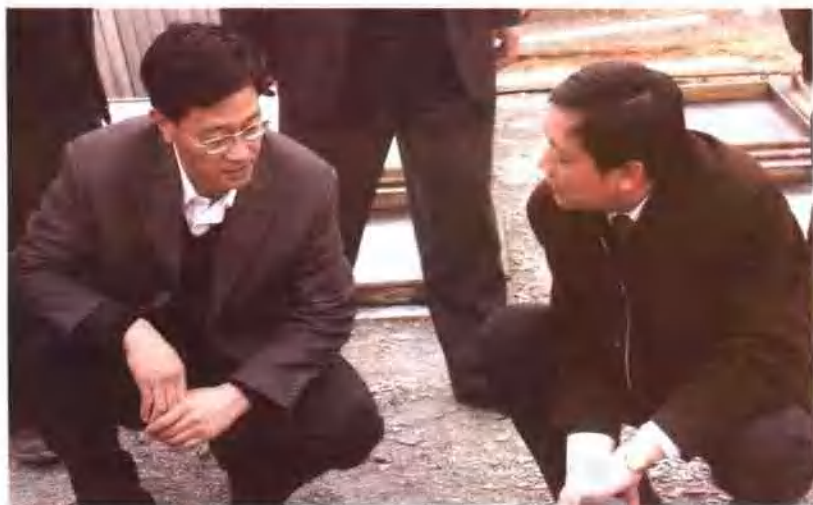
▲ 铁道部副部长卢春房与上海铁路局副局长王峰在工地