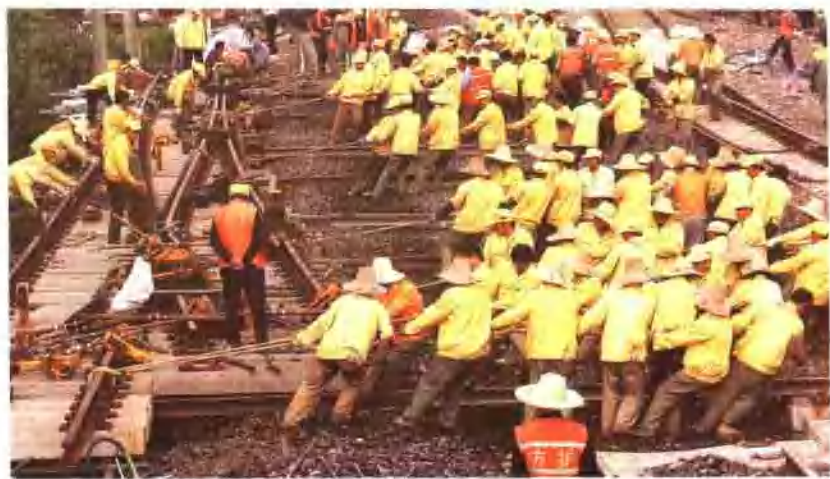
▲ 浙赣铁路电气化工程既有线改造拨接施工