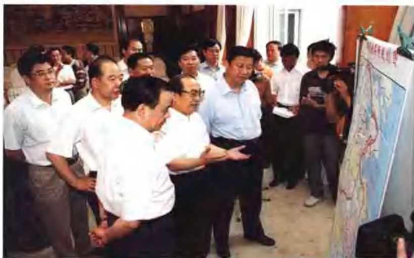
▲ 铁道部部长刘志军向中共浙江省委书记习近平、省长吕祖善、副省长王永明介绍浙江铁路规划