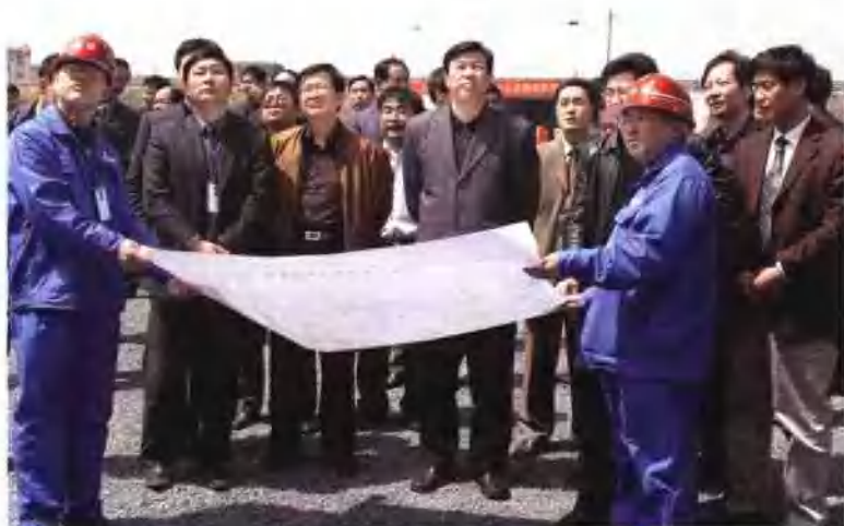
▲ 铁道部副部长陆东福与上海铁路局局长刘涟清在浙赣铁路施工现场