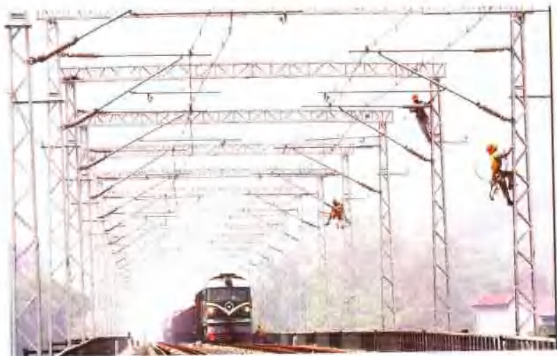
▲ 浙赣铁路电气化工程接触网施工