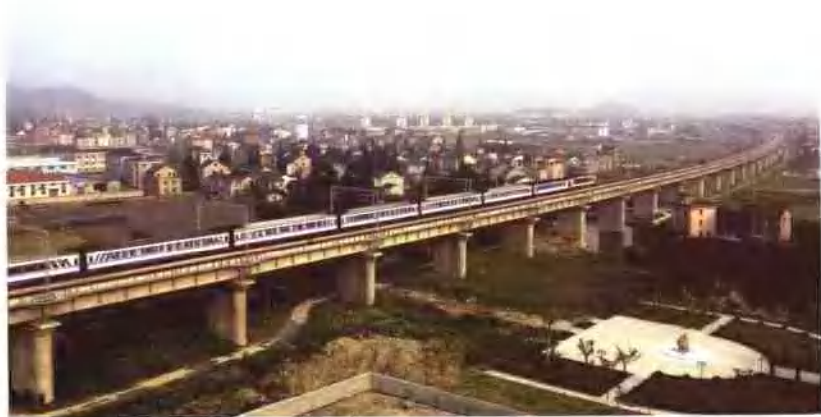
▲ 全线第一长桥——临浦特大桥