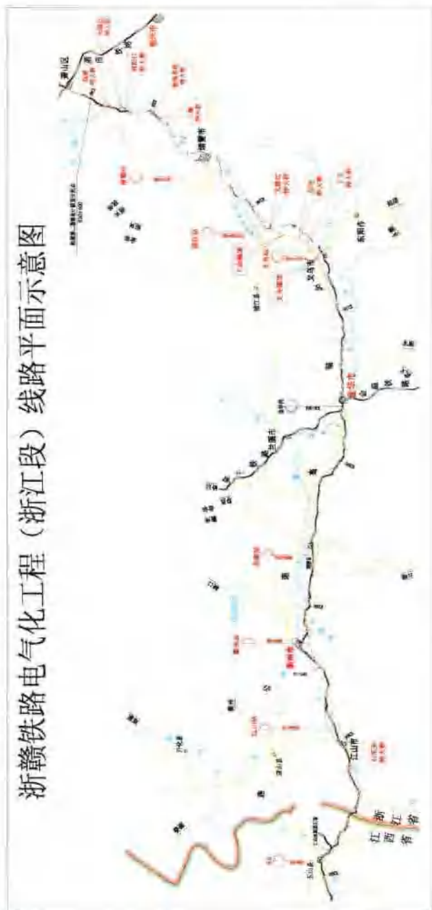
浙赣铁路电气化工程（浙江段）线路平面示意图