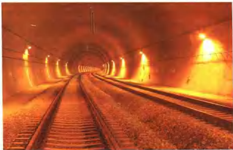
▲ 全线第一长隧——上金隧道