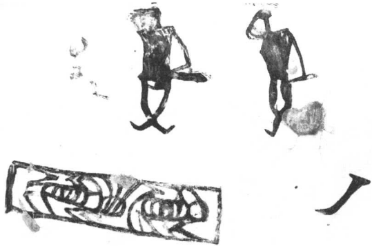
二 大地灣居住遺址地畫

中國古代寺觀壁畫是佛教輸入後興盛起來的。在此以前，我國的原始宗教以及祭祀活動中，已有利用壁畫的傳統。在屬於五千年前的遼西紅山文化牛河梁女神廟中，就曾發現有壁畫殘塊（註一）。這些殘塊上有赭紅色勾連紋、赭紅間黃白色交錯的三角紋等幾何形紋飾（插圖一）。在甘肅秦安大地灣也曾發現仰韶文化晚期的地畫（註二）。在居住遺址的地面有木炭畫的人物情節，可能是當時施行巫術儀式的真實記錄（插圖二）。畫面上部正中有一人，高三十二點五厘米，肩部寬平，右臂向上彎曲至頭部，左臂下垂握棒形器具，下腿交叉直立，作行走狀；左側有一人，高三十四厘米，形態與前一人相同。下部畫一木棺，內有兩身俯臥的軀體。畫面似乎是表現人死後，圍繞死者作驅趕妖邪的活動（註三）。這一黑色地畫與青海大通上孫家寨出土的彩陶盆上的舞蹈紋（註四）（插圖三），從不同角度反映了原始氏族社會的生活習俗、宗教信仰等方面的情況。進入階級社會，壁畫除被用來裝飾宮殿外，也繪製於一些祭祀場所。春秋時，孔子在周王室祭祀的明堂，「睹四門墉，有堯舜之容、桀紂之象，而各有善惡之狀、興廢之誠焉。又有周公相成王，抱之，負斧戣，南面以朝諸侯之圖焉。」（引自《孔子家語》）戰國時期，楚先王廟也「圖繪天地、山川、神靈，琦瑋儵倅，及古賢聖，怪物行事」（註五）。這些天地、山川、神靈、古聖賢等圖像，還可以從遺留下來的戰國漆畫（插圖四）和漢畫像磚石中見到。這類圖像以及相關的裝飾紋樣，被反覆描繪在殿堂或墓室，成為繪畫中的傳統題材，或多或少地影響到漢唐寺觀壁畫的表現與發展。