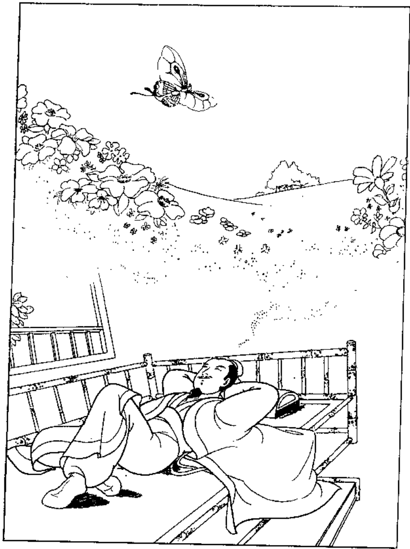
庄子梦蝶 (郭小虎画)