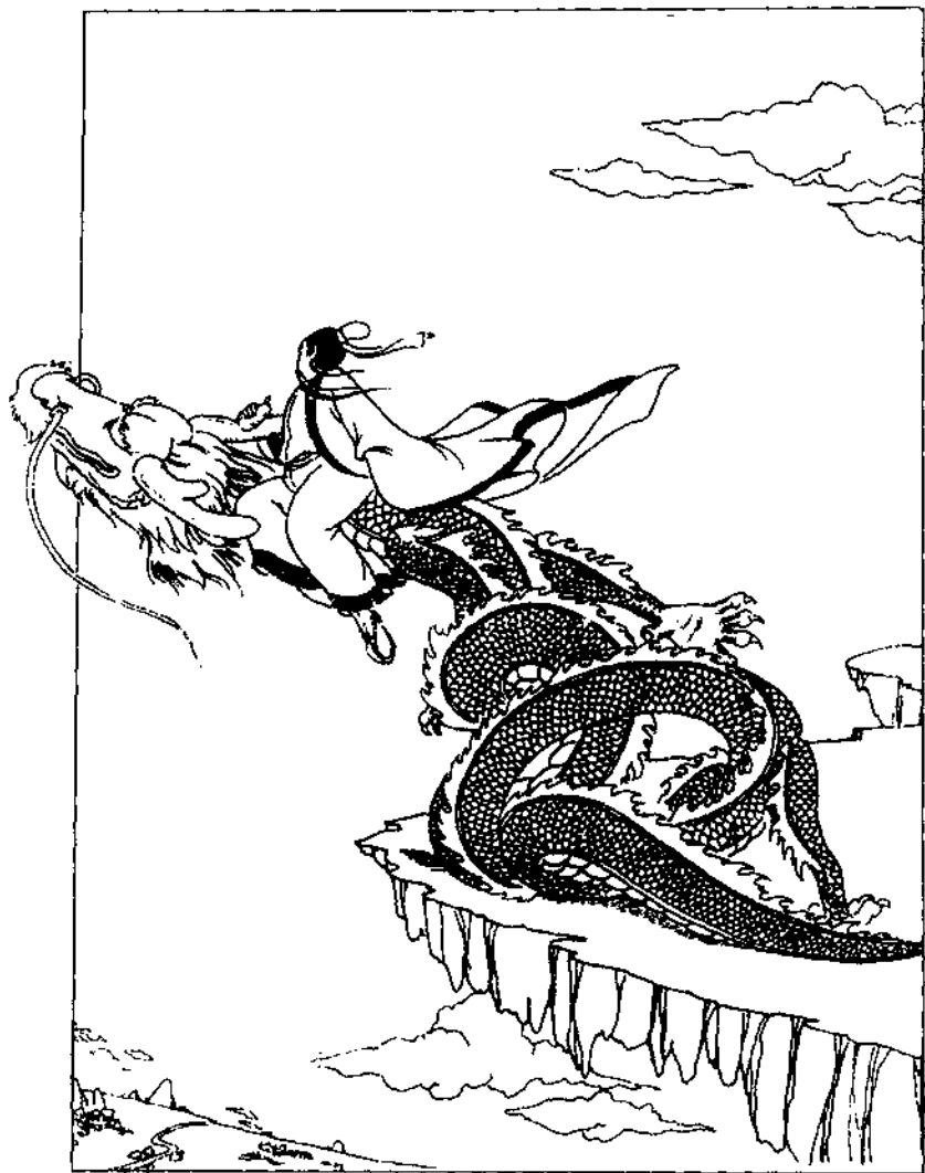
姑射山神人 (郭小虎画)