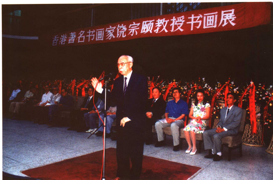
饒宗頤先生在書畫展開幕式上致辭