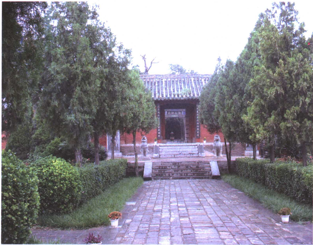
比干庙位于河南省新乡

诤臣，父有诤子，士有诤友。下官身为大臣，进退自有尚尽之大义。我为的是叫你痛改前非，保住商朝的江山。上天为了百姓，才安排一个君王来为民作主，并不是做了君王便可以随意虐待人民。现在您无休止地横征暴敛，压迫人民，人民已经到了不堪忍受的地步。您整天住在深宫，哪里还管百姓死活！现在国家的命运已经到了生死关头，怎么还可以随随便便地杀人？人心失尽了，国家也就要跟着灭亡。我们的祖先当年是怎样地艰难创业，才奠定了国家今天的地位？现在把国家轻易地断送了，这能对得起祖先吗？”