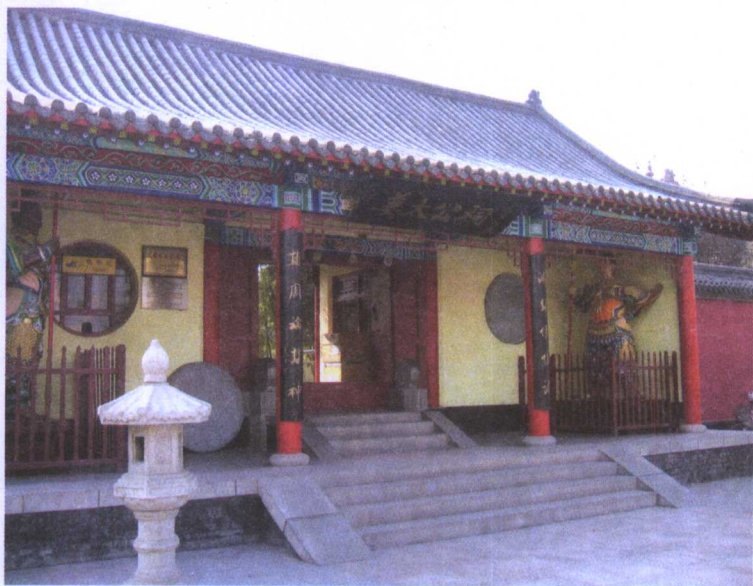
位于山东省淄博市的姜太公祠

姜子牙，姓姜，名尚，字子牙。相传他的先祖本是个贵族，曾在舜帝时做过官，而且屡立战功，被舜封在吕地（今河南南阳），故又名吕尚。晚年因其年寿高，称太公，俗称姜太公。姜子牙生于商朝末年，当时正值商纣王昏庸无道的残暴统治时期，天下百姓民不聊生，姜子牙的家境也已败落为普通贫民，生活十分潦倒。三十二岁时，因为商朝战争不断，姜子牙为了躲避战祸，来到山上修道，经过四十年的苦修，直到七十二岁才出山。出山后，因为年纪大又没有一技之长，只好暂时投靠在朋友的家中。为了谋生，他曾经编制竹篓拿到市集