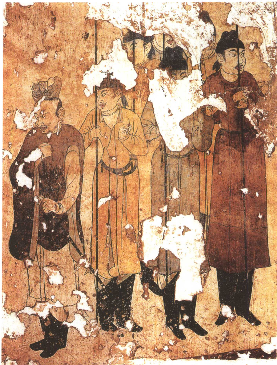
仪卫图 韦贵妃墓壁画

有谁会相信这是武装卫队。细细的枪杆，如同指挥棒。时髦的大衣，威风的双靴，还有顾盼的眼神，分明是唐代的时装表演队。