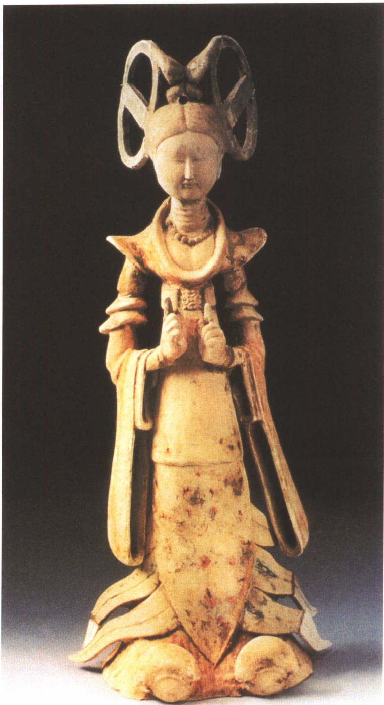
彩绘双环髻女俑 咸阳市长武郭村出土

细腰不盈握，高髻耸入云。细节繁复，主干简洁。她是谁？轻歌曼舞的歌女？陪衬主人的女侍？她从唐代一直站立到今天，想要告诉我们什么？