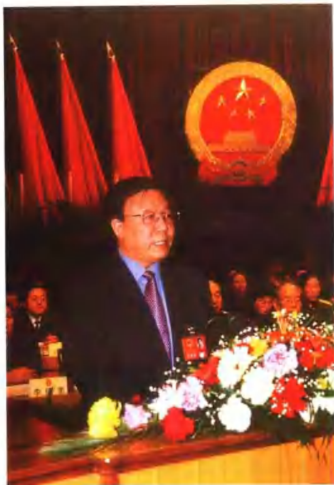
2003年1月，陆浩省长代表省政府在甘肃省第十届人民代表大会上做政府工作报告。