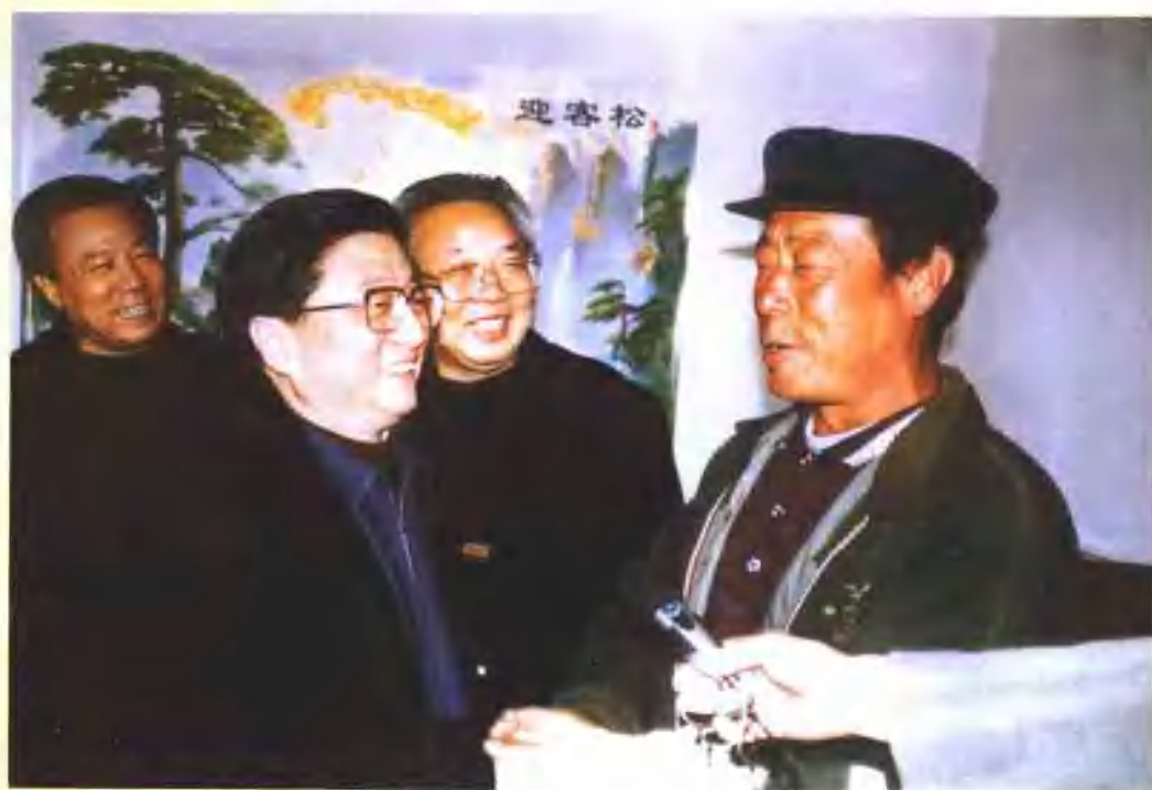
2003年1月19日，中央政治局常委黄菊（左二）在省委书记宋照肃和省长陆浩陪同下深入甘肃永登县贫困农民家中进行调研。