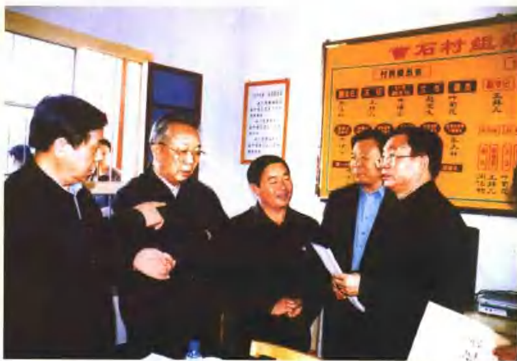
2003年5月26日，中央政治局委员、书记处书记、中央组织部部长贺国强（右一）由省委书记宋照肃、省长陆浩和省委副书记、组织部长王宪魁陪同视察天水市北道区伯阳乡曹石村党支部建设情况。