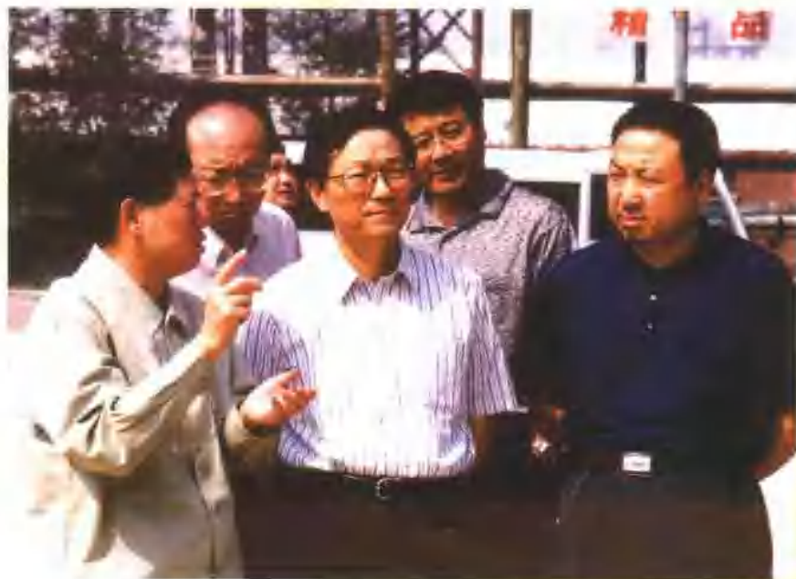
2003年6月19日，国家税务总局局长谢旭人（右三）在省地方税务局张性忠局长（右一）陪同下深入甘肃企业进行调查研究。