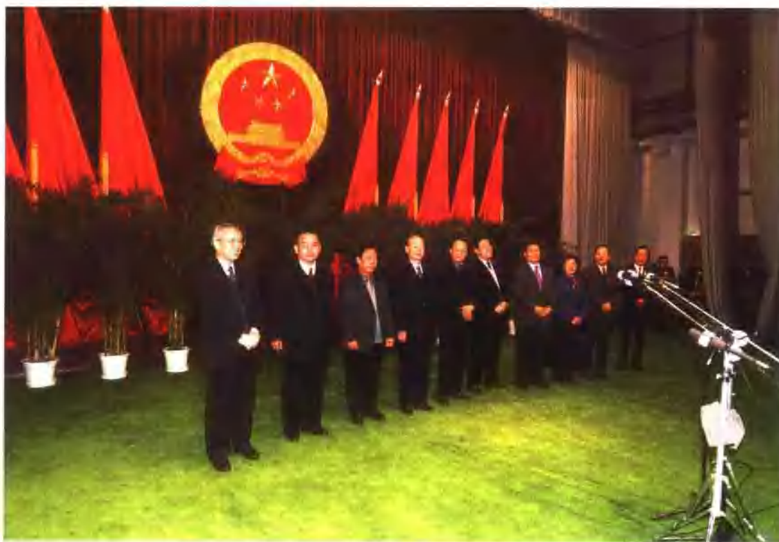
2003年1月，甘肃省第十届人民代表大会第一次会议选举出新一届省人大主任宋照肃、副主任嘉木样洛桑久美·图丹却吉尼玛、程有清、柯茂盛、杨作霖、丁泽生、李德奎、杜颖、石作峰。