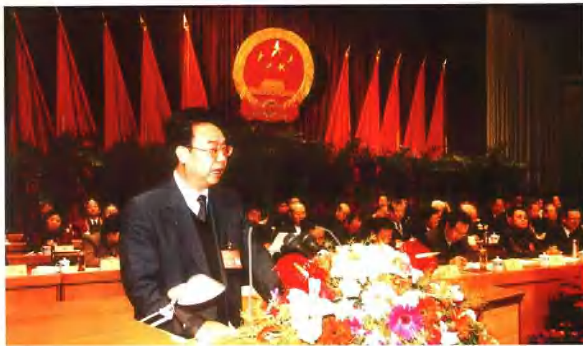
2003年1月9日，甘肃省财政厅厅长苏志希在甘肃省第十届人民代表大会第一次会议上做关于甘肃省2002年财政预算执行情况和2003年全省及省级预算草案的报告。