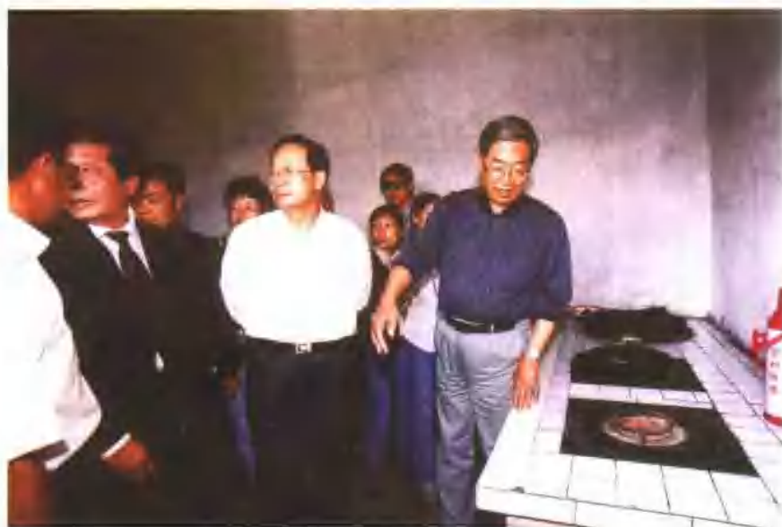
2003年7月，全国人大副委员长许嘉璐和全国政协副主席张怀西来甘肃视察武威农民使用沼气的情况。