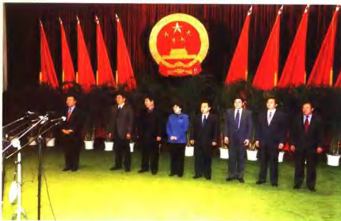
2003年1月，甘肃省第十届人民代表大会选举出新一届省政府省长陆浩、副省长徐守盛、负小苏、吴碧莲、杨志明、孙小系、罗小虎、李膺。