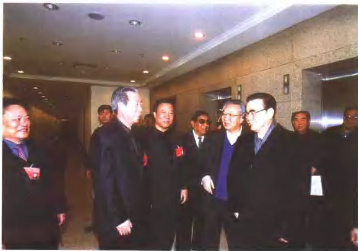
2003年3月，全国人大委员长李鹏与出席全国人大会议的甘肃代表亲切交谈。