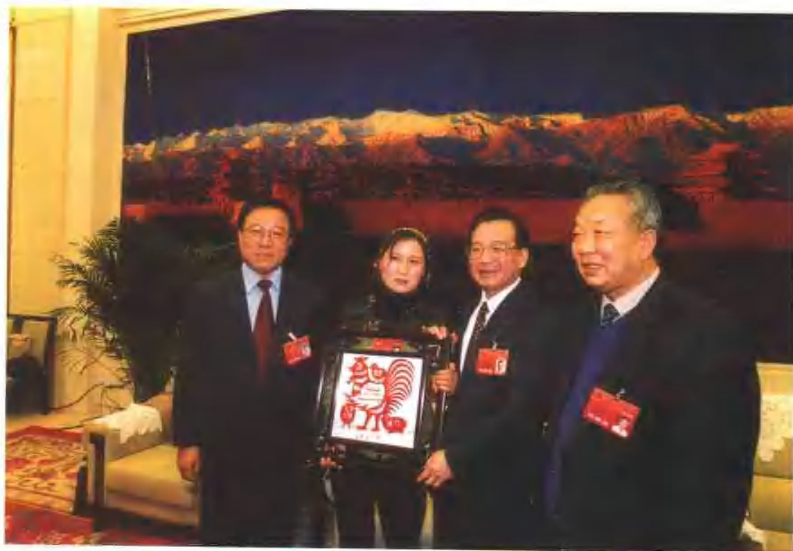
2003年3月，省委书记宋照肃，省长陆浩和出席全国人代会的甘肃代表向新当选的国务院总理温家宝敬献剪纸作品。