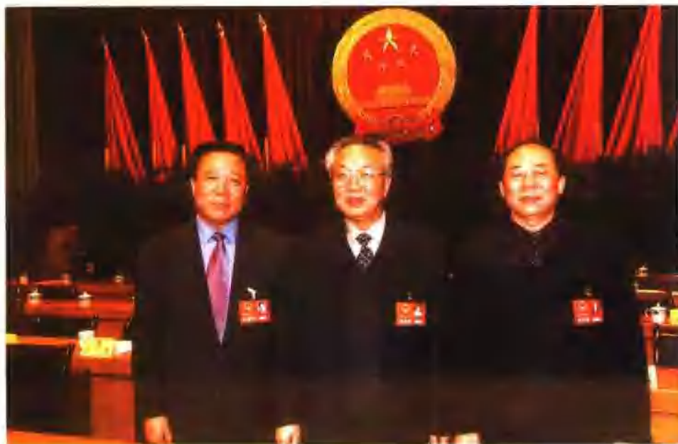
2003年1月，甘肃省第十届人民代表大会第一次会议选举出新一届省人大主任宋照肃(省委书记兼)、省长陆浩和省政协主席仲兆隆。