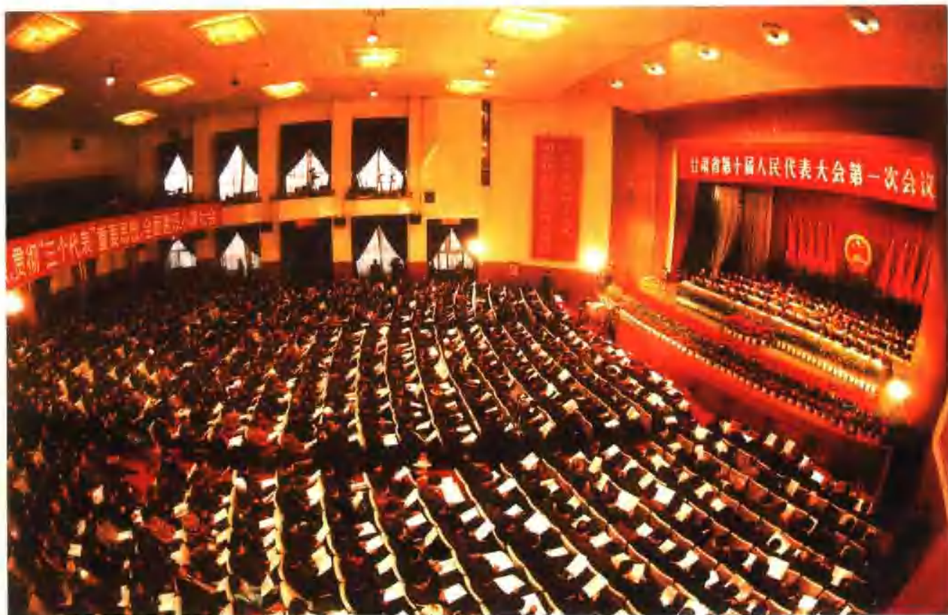
2003年1月，甘肃省第十届人民代表大会第一次会议胜利召开。