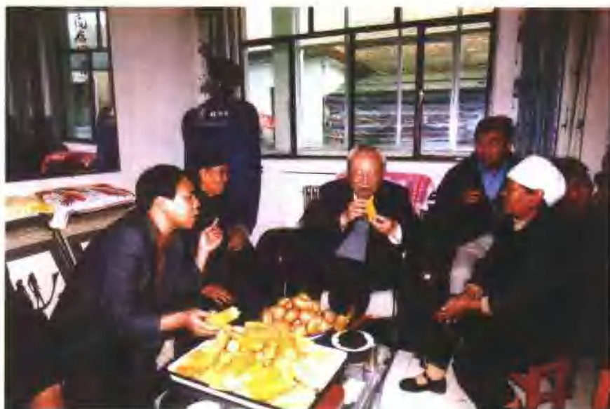
2003年7月，原全国人大副委员长费孝通来甘肃视察定西农村小康建设和农民生活改善情况。