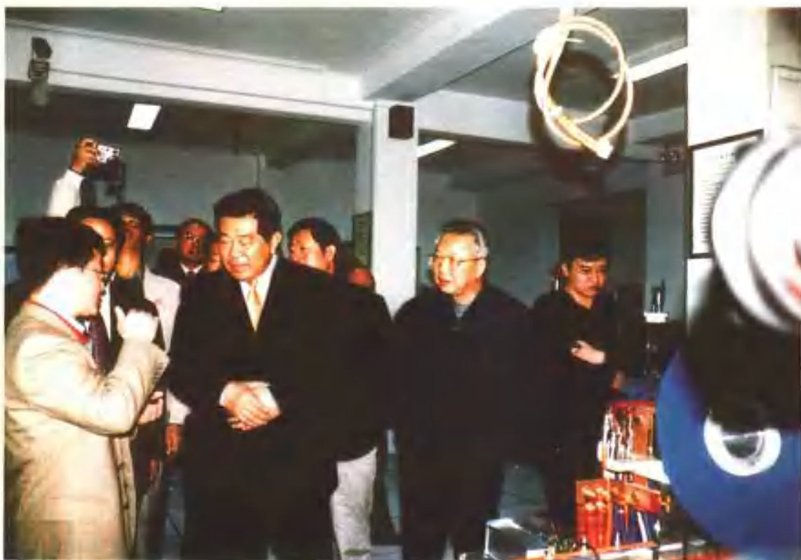
2003年4月14日，中央政治局常委、全国政协主席贾庆林同志（左二）在省委书记宋照肃的陪同下前往中科院近代物理研究所视察兰州重离子加速器国家实验室。