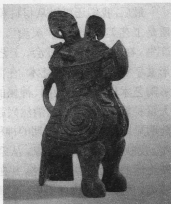
图3 鸕形尊 商