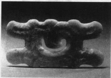
图1-3 玉器 原始社会