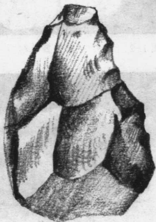
图1-1 猿人石器 旧石器时期

这种用打制的方法制成的石器比较粗糙，以我们现在的目光来看，与天然的石块区别似乎并不大，但其上留有的简单的加工痕迹，却标志着人类由动