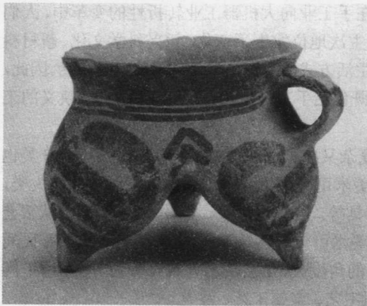
图1 三足鬲彩陶 原始社会

从艺术风格看。不同的历史时期、不同的地域环境又呈现出不同的艺术风格。每个历史时期都有不同的时代特征,通过工艺品反映了当时的社会风貌。新石器时代的石器、制陶、骨饰、编织等工艺,鲜明地显示了工匠使用材料和制作工艺的能力,反映了他们对形式美法则的认识和运用。商周时期,原始青瓷和漆器得到初步发展,青铜器和玉器取得了辉煌的成就。商代统治者迷信并且崇尚武力,反映在工艺美术上也呈现出一种近乎狰狞的美。春秋战国至秦汉时代的工艺美术显示了中国封建社会早期意识形态的发展,实用功利的价值追求与原始文化的浪漫形式有机结合,产生了活泼奔放、雄强古拙的美学特征。这些特征在陶瓷、漆器和丝织品上得到充分的表现。三国两晋南北朝时期,人们崇尚空疏、清静、平淡,这一意识形态上的转折,造成工艺美术生产格局和价值追求的变化。生产中心由北向南转移,青瓷、瓦当及宗教工艺取得了突出的成就。唐代经济发达,思想开放,金属、陶瓷、丝织、印染等的工艺美术繁荣发展,超越前代,使人感到自由、舒展、亲切,表现出精巧圆润、富丽丰满的形态特征。中国古代工艺美术比较完美的境界出现在宋代,其风格迥异于唐代豪华与放纵之风,“程朱理学”成为统治思想核心,诗文以平淡自如、文达疏畅为目标,形成一种清淡平易的理性之美,