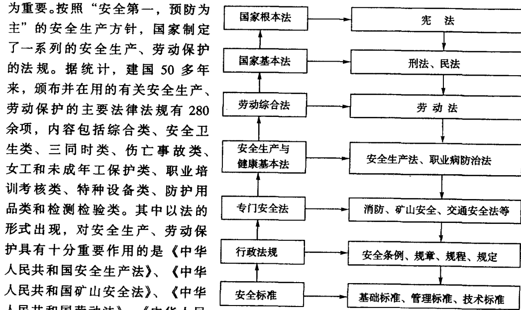
图 1-2-1 安全生产法规体系及层次

安全生产是一个系统工程，需要建立在各种支持基础之上，而安全生产的法规体系尤为重要。按照“安全第一，预防为主”的安全生产方针，国家制定了一系列的安全生产、劳动保护的法规。据统计，建国50多年来，颁布并在用的有关安全生产、劳动保护的主要法律法规有280余项，内容包括综合类、安全卫生类、三同时类、伤亡事故类、女工和未成年工保护类、职业培训考核类、特种设备类、防护用品类和检测检验类。其中以法的形式出现，对安全生产、劳动保护具有十分重要作用的是《中华人民共和国安全生产法》、《中华人民共和国矿山安全法》、《中华人民共和国劳动法》、《中华人民共和国职业病防治法》（2002年5月1实施），与此同时，国家还制定和颁布了数百余项安全卫生方面的国家标准。根据我国立法体系的特点，以及安全生产法规调整的范围不同，安全生产法律法规体系由若干层次构成，如图1-2-1所示。下面对其中最基本、最主要的现行法规做一简介。