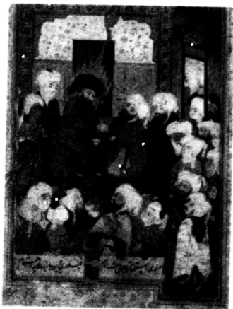
阿拉伯人宣誓忠诚于哈里发阿里

633年秋(一说634年春),艾卜·伯克尔派出两支军队(每队约3000人,一说7500人),从阿拉伯半岛出发,途经叙利亚沙漠,去攻打巴勒