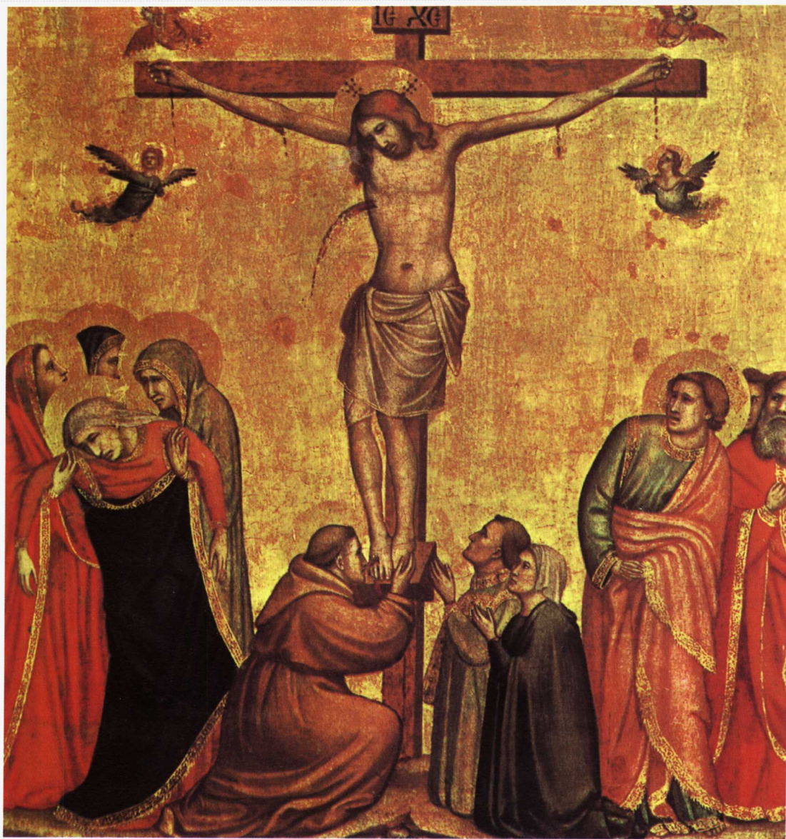
十字架上的基督 1320—1325年绘制