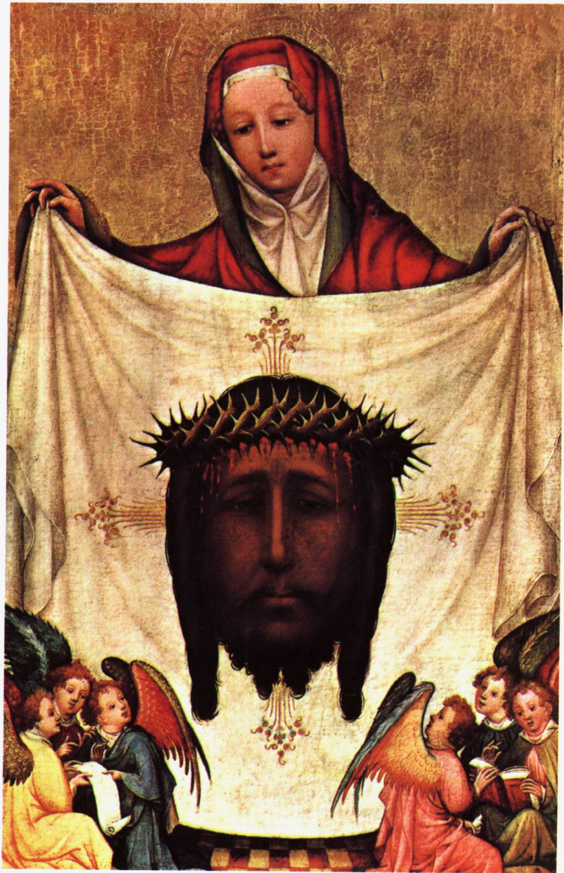
圣维洛妮卡与神圣头巾 1400年绘制