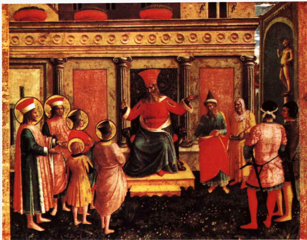
站在利西亚斯面前的圣柯斯玛斯与达米安 1440—1442年绘制