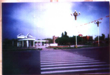
县城昆仑广场生辉