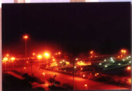
灯光灿烂，夜景辉煌