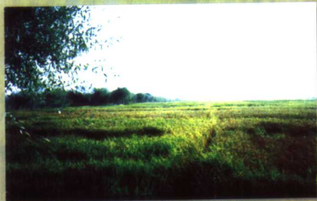
锦绣的博斯坦稻田