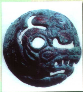
虎纹铜仪杖首 （“全国重点文物保护单位” 尤木拉克库木古城出土）