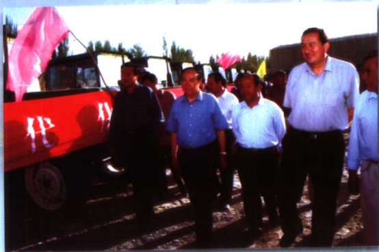
全国人大副委员长司马义·艾买提（左二）在和田人大 委主任阿不都热合曼·库尔班（右一）陪同下视察于田县工作