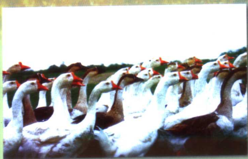
博斯坦稻田肥壮的鹅群