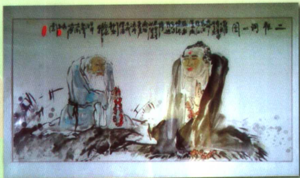
相传老子与如来在于田故地研究探讨 “佛教”、“道教”，共建“道德之乡”