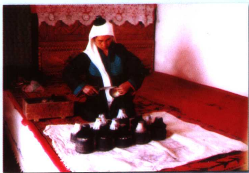
制作世界上最小的“太里拜克”小帽手工业者