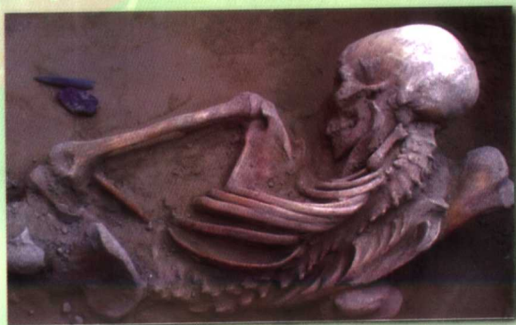
3000年前流水村古代昆仑山人人类墓群