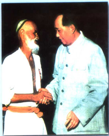
毛主席接见库尔班·吐鲁木