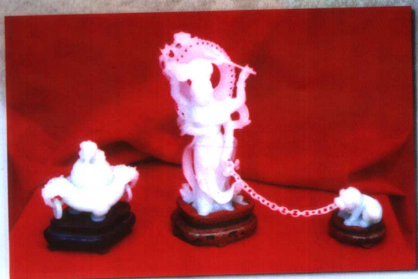
玉女牵狮与香炉一系 (于田境内昆仑山阿拉玛斯玉矿所产的羊脂玉制作的玉器)