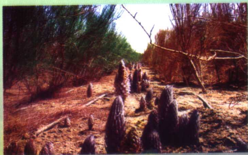
和田地区举行大芸（肉苁蓉）被收入2005年版《中华药典大全》新闻发布会