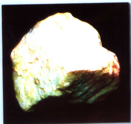
阿拉玛斯玉矿是中国目前惟一生产白玉的玉矿 (图为该矿所产的优质玉山料)