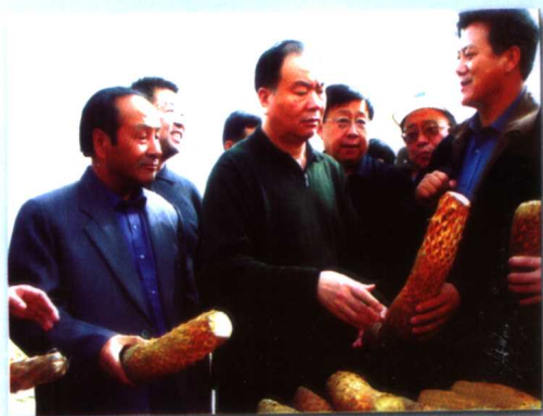
中共中央政治局委员、新疆维吾尔自治区 党委书记王乐泉（中）在于田视察工作