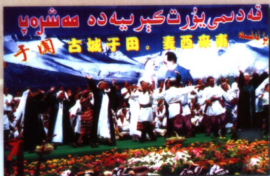
于田麦西来甫盛会