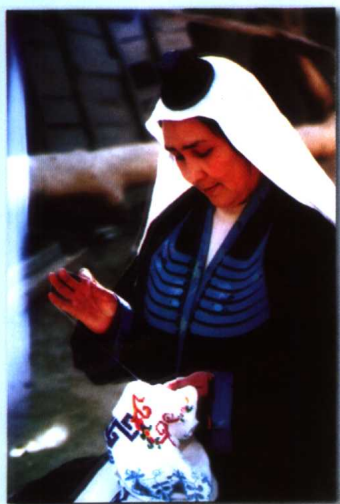
维吾尔族妇女刺绣