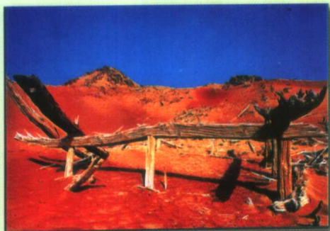
于田县是新疆古老文明摇篮之一 (图为喀拉墩古城遗址)