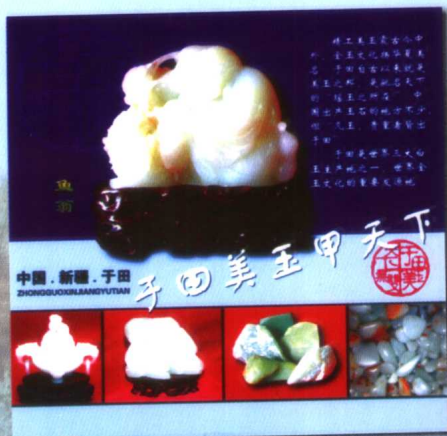
于田县所产的和田玉甲天下