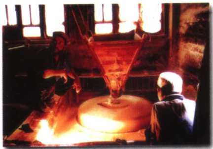
古老水磨，文明佐证