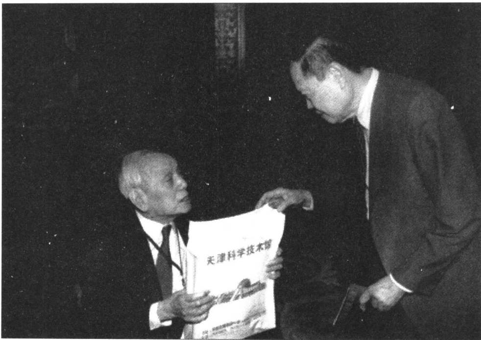
陈省身先生与杨振宁先生

1927年,我的读书生活与态度有很大的改变。那年姜立夫先生回南开。姜先生在人格上、道德上是近代的一个圣人。记得胡适之先生在《独立评论》的一篇文章上也曾如此说过。姜先生态度严正,循循善诱,使人感觉读数学有无限的兴趣前途。南开数学系在他主持下图书渐丰,我也渐渐能自己找书看了。