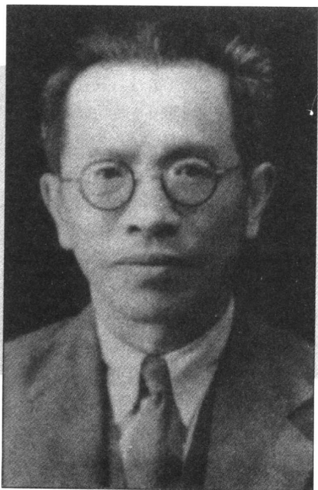
南开大学数学教授姜立夫(1930年代)

那一年的时间,用于看小说杂书者不少,也时常替人作文。我的中英文虽然都不好,但还有不如我的人。我动笔很快,一写两三篇,把好的一篇留给自己,其他的送人。但有时人家反比我得更好的分数。一年级时,我时常替朋友们做种种的作业,以消磨时间。