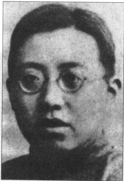
清华大学数学教授孙光远(1900年代初期)