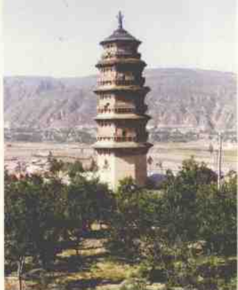
环县宋塔是甘肃省至今保存最好的一座宋代砖塔。