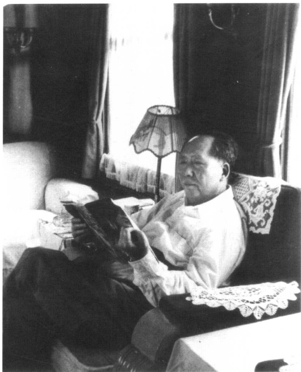
毛泽东在专列上看《大众电影》（1962年）