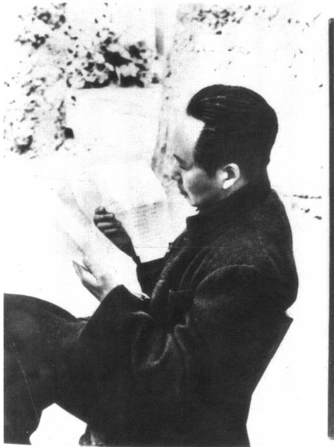
毛泽东在审阅文件（1946年）