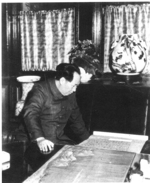
毛泽东欣赏中国古画（1953年）