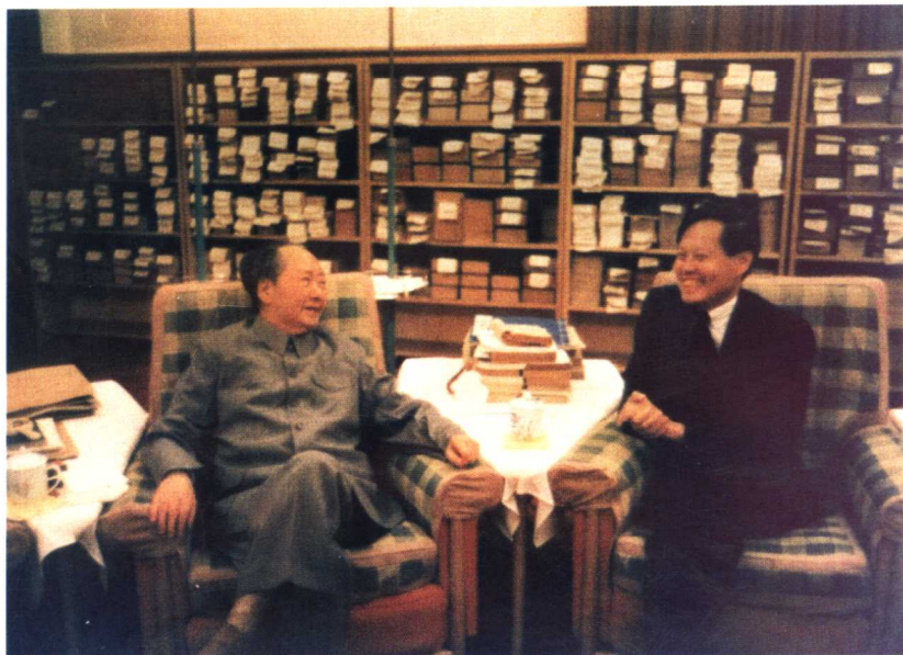
毛泽东在中南海会见美籍物理学家杨振宁（1973年7月）