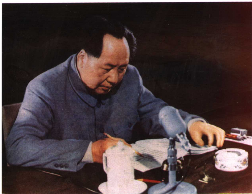
毛泽东在修改《中华人民共和国宪法》(草案) (1954年)