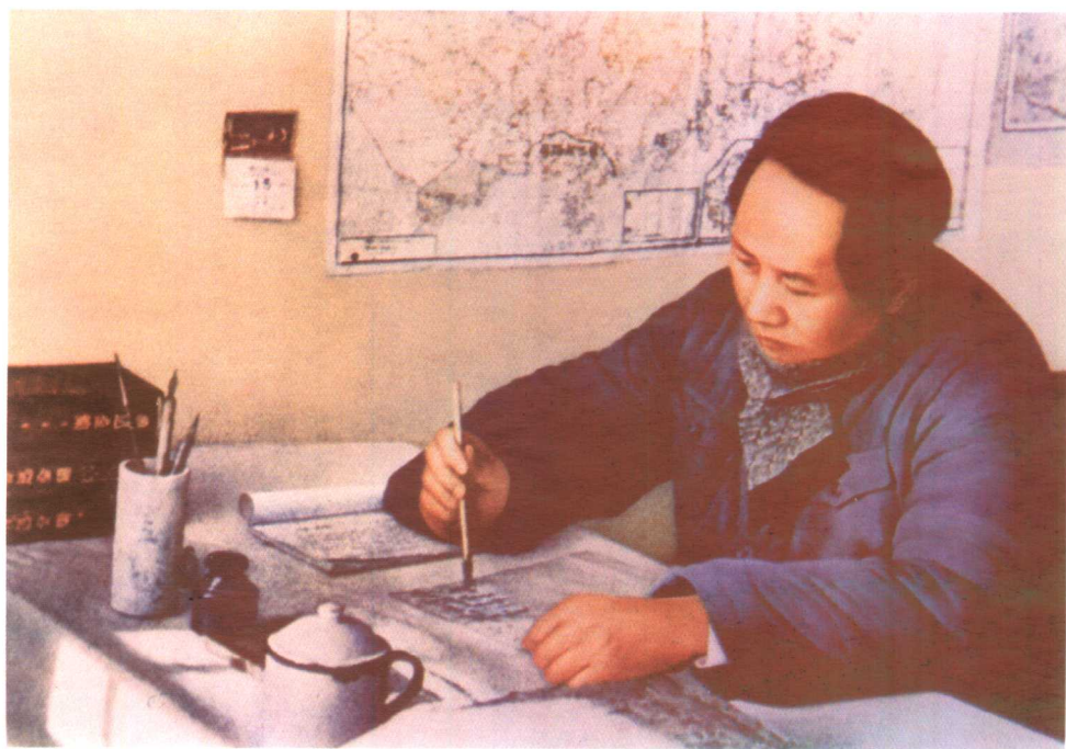
毛泽东在枣园窑洞工作（1946年）