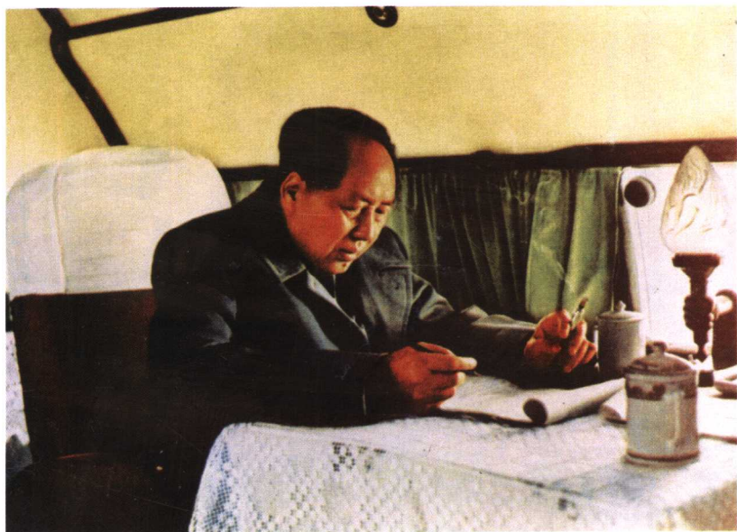
毛泽东在飞机上学习英语 (1957年)