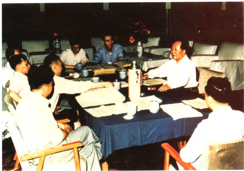
毛泽东在广州和有关同志研究《毛泽东选集》第四卷的编辑工作（1960年4月）