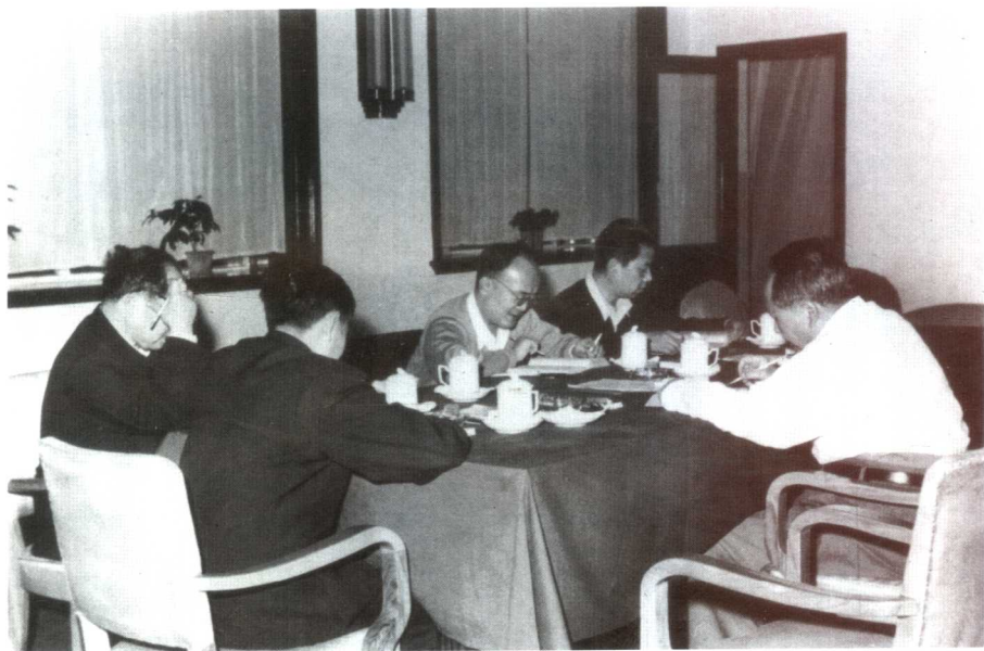
毛泽东与胡绳、田家英等一同研读苏联《政治经济学（教科书）》第三版（1959年12月至1960年2月）