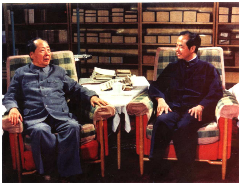
毛泽东在中南海会见美籍物理学家李政道（1974年5月）