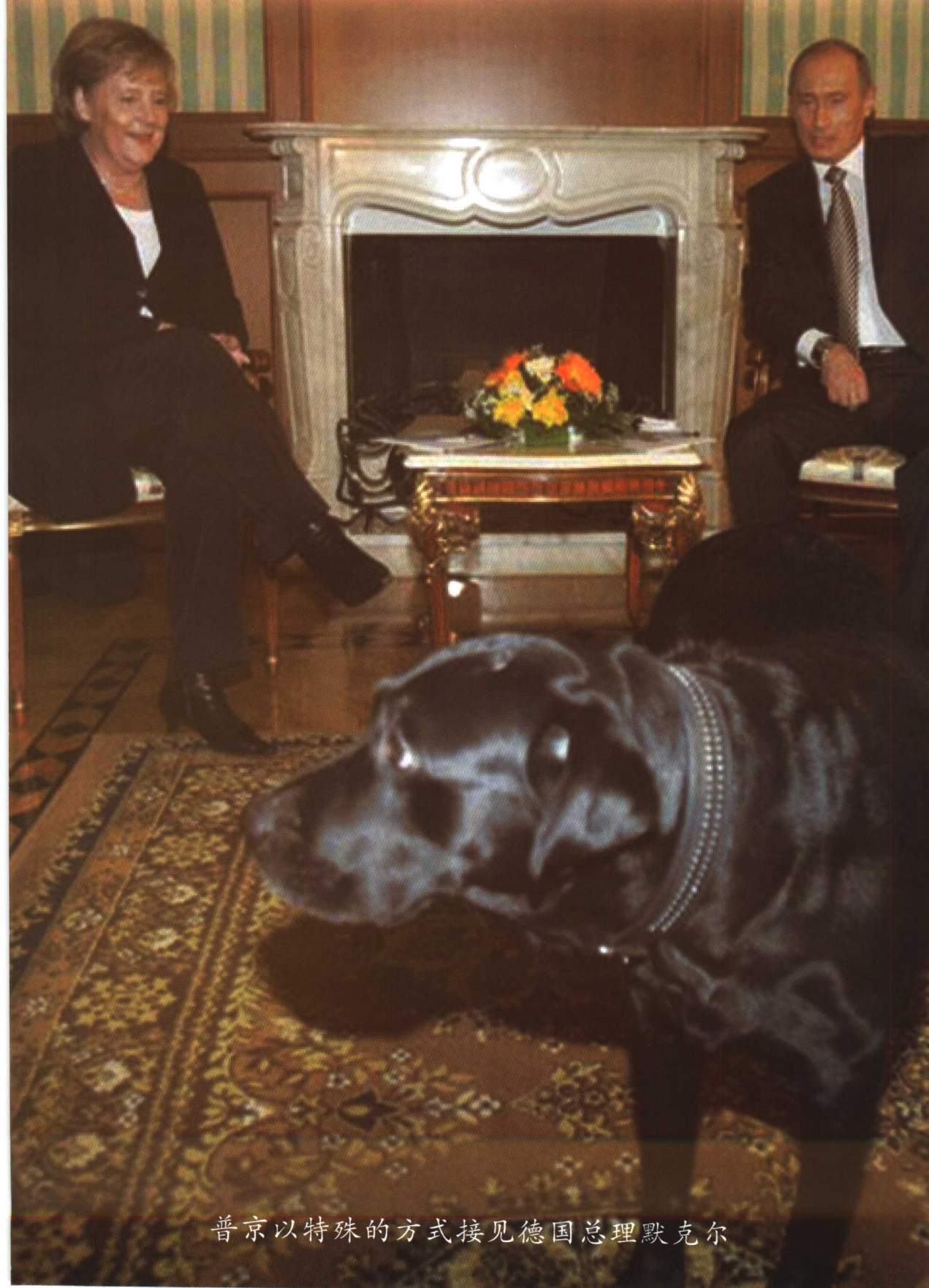
普京以特殊的方式接见德国总理默克尔