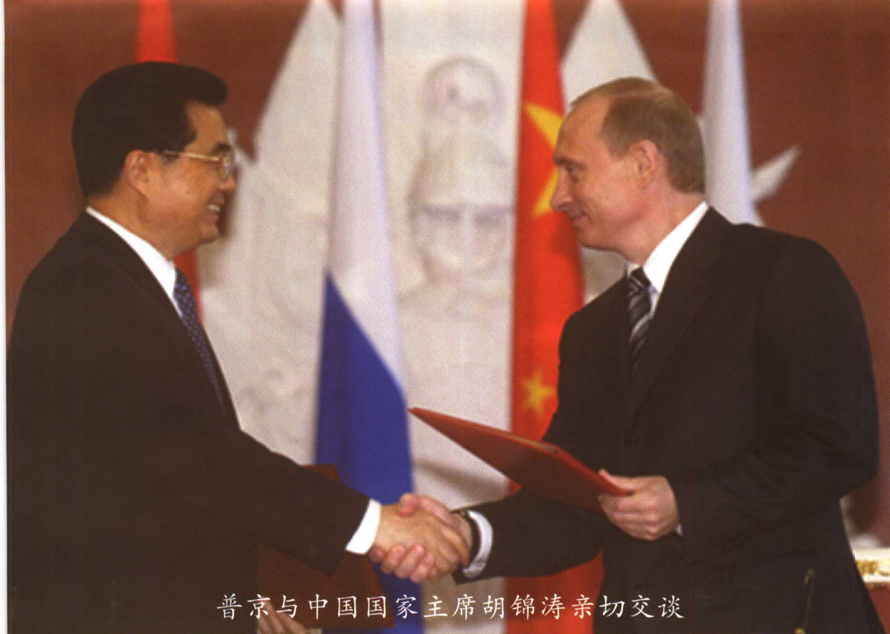
普京与中国国家主席胡锦涛亲切交谈