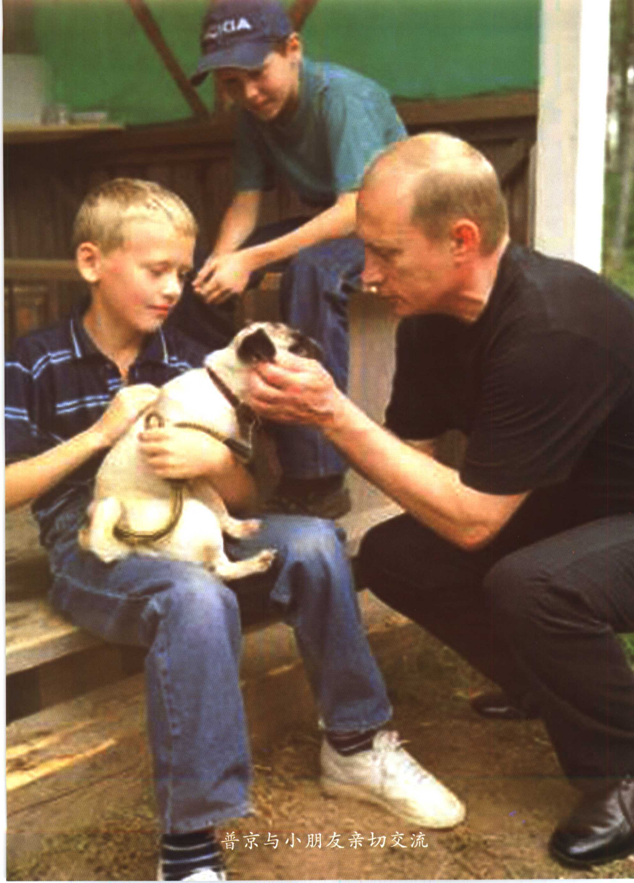
普京与小朋友亲切交流