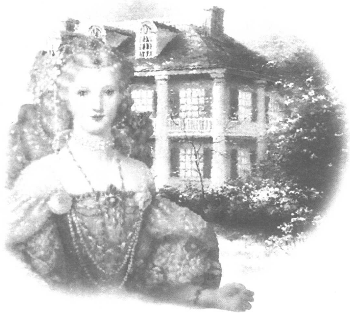
插图: 日月环宇工作室