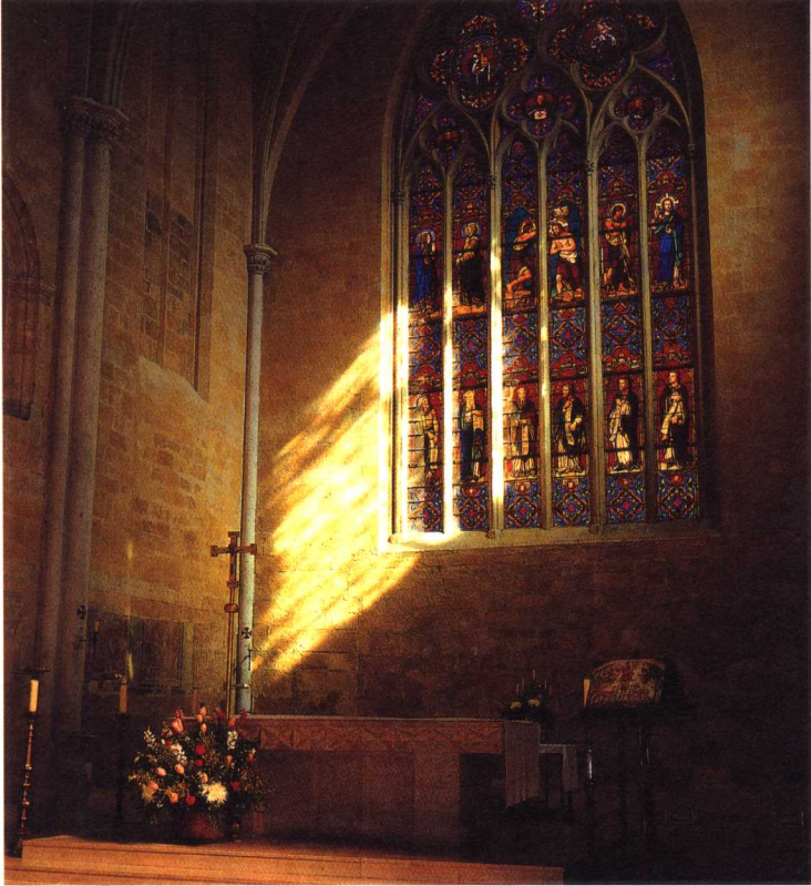
—清晨的阳光洒进普罗旺斯的圣马尔他大教堂内。

的原因是：在这种难以形容的意境中，在喘气声都能听到的庞大空间里，一种与生俱来久违的庄严气质油然而生，而所谓上帝的存在，竟能在未经造作的神圣气氛中，变得如此真实。