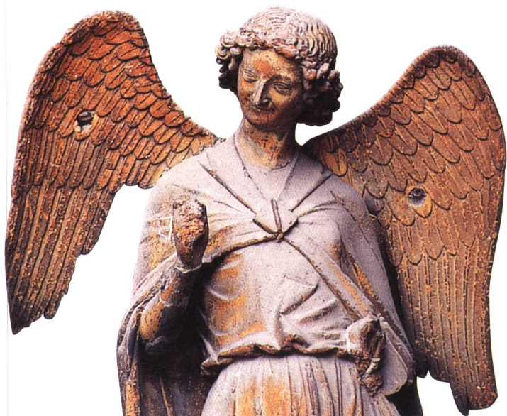
→ 兰斯大教堂西正面的微笑天使。

古老的基督信仰，影响力无远弗届。欧洲的教堂正是上帝与当地子民的界面，说着不同语言的欧洲基督徒在信仰中合一，甚