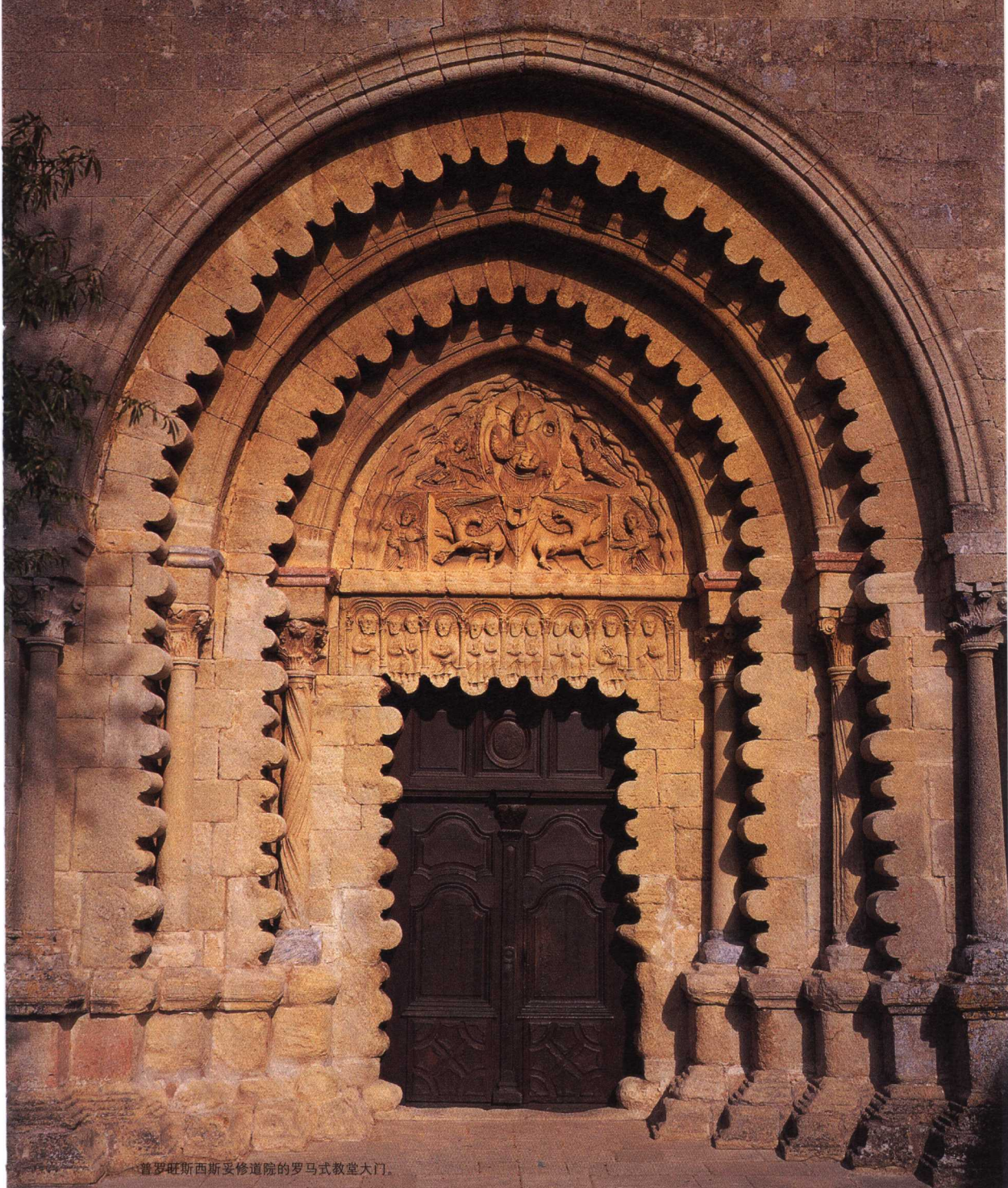
普罗旺斯西斯妥修道院的罗马式教堂大门。