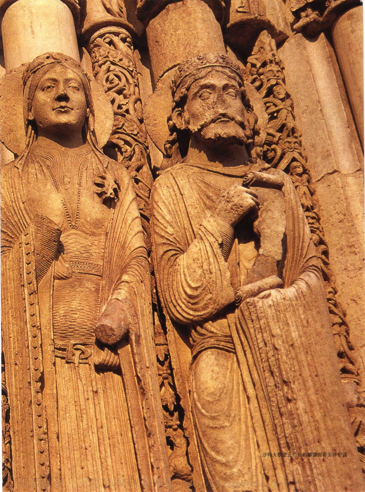
沙特大教堂正门外的雕像面容安详宁谧