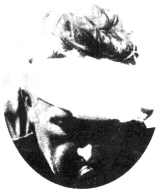
头部负伤的沙龙在下达渡河命令。