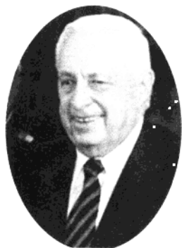
沙龙向支持者挥手致意。