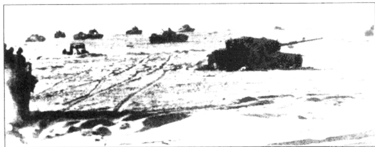
沿苏伊士运河展开的以色列战车部队。