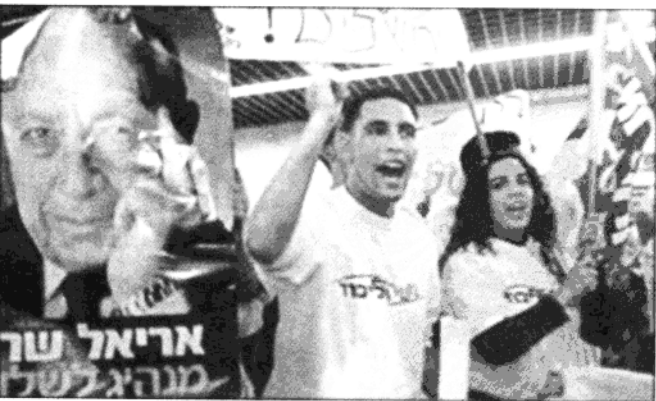
沙龙的支持者对选举结果充满信心。