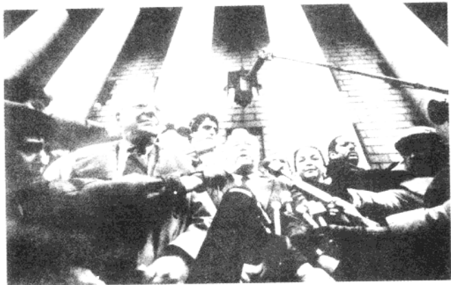
因贝鲁特难民营大屠杀事件，沙龙受到责难。