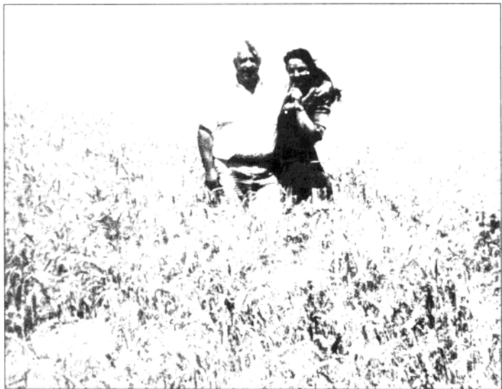
沙龙和莉莉在麦田中留影。