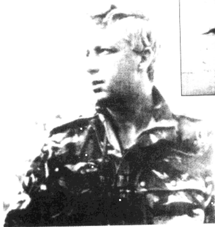
1967年“6日战争”时的沙龙。