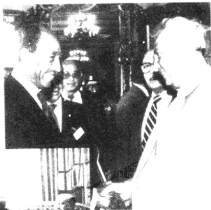
1981年，与埃及总统萨达特会见。