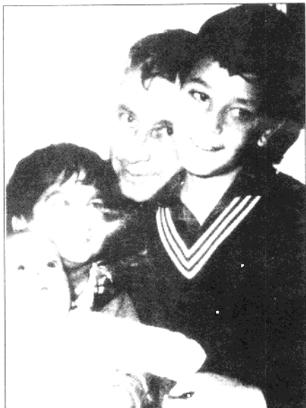
沙龙与子女们在一起。