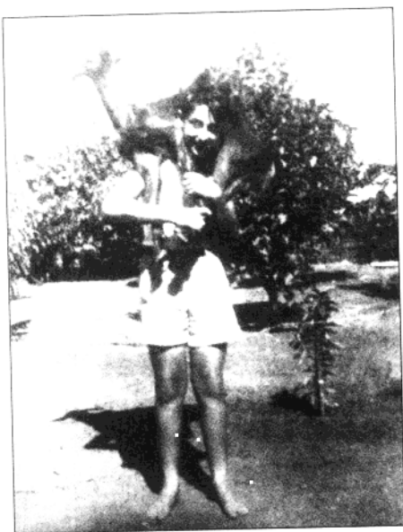
13岁的沙龙在劳动间隙。