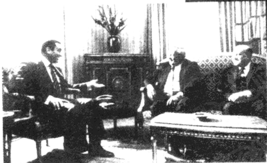
1982年，在开罗同穆巴拉克总统会谈。