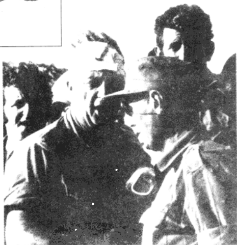
沙龙向视察前线的达扬汇报战况。