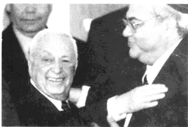
沙龙和利库德集团成员庆祝胜利。