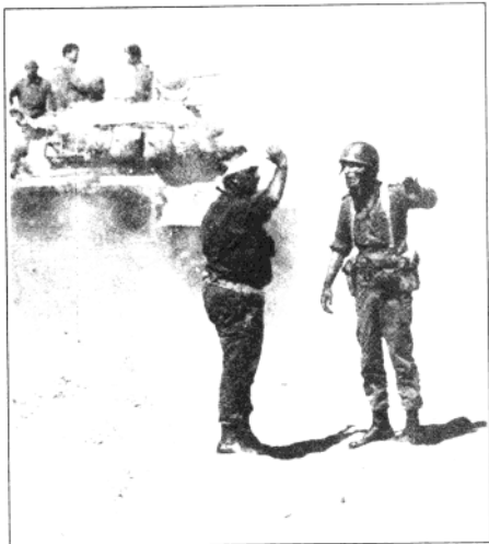
沙龙指挥先头部队渡河。