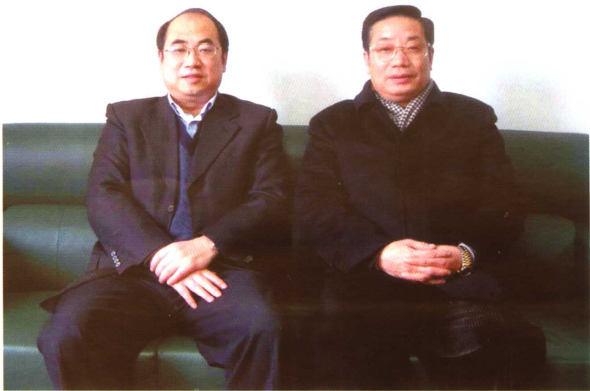
◆ 作者与华中师范大学校长马敏(左)在一起