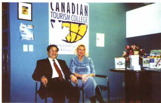
◆ 作者在加拿大旅游学院考察