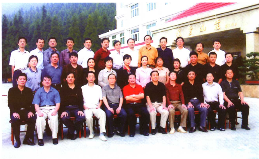
◆ 作者与学院中层干部在一起