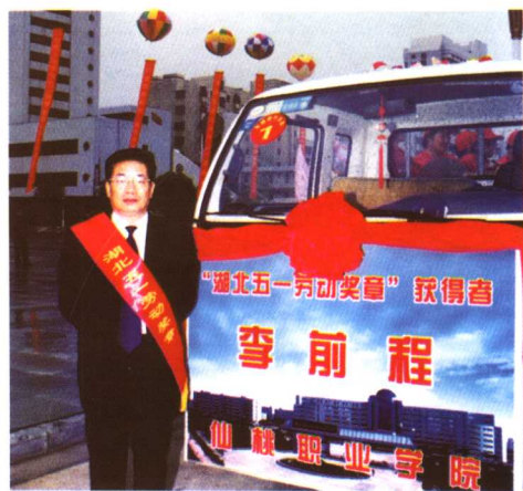
◆ 作者荣获“湖北省五一劳动奖章”