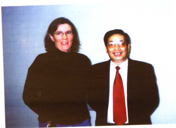
◆ 作者在加拿大兰加拉护理学院考察