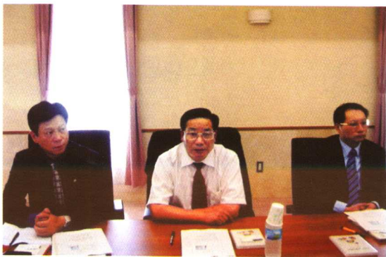
◆ 作者在日本电子专门学校考察