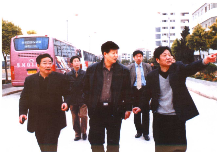
◆ 国家教育部发展规划司司长韩进(前排中)视察学院