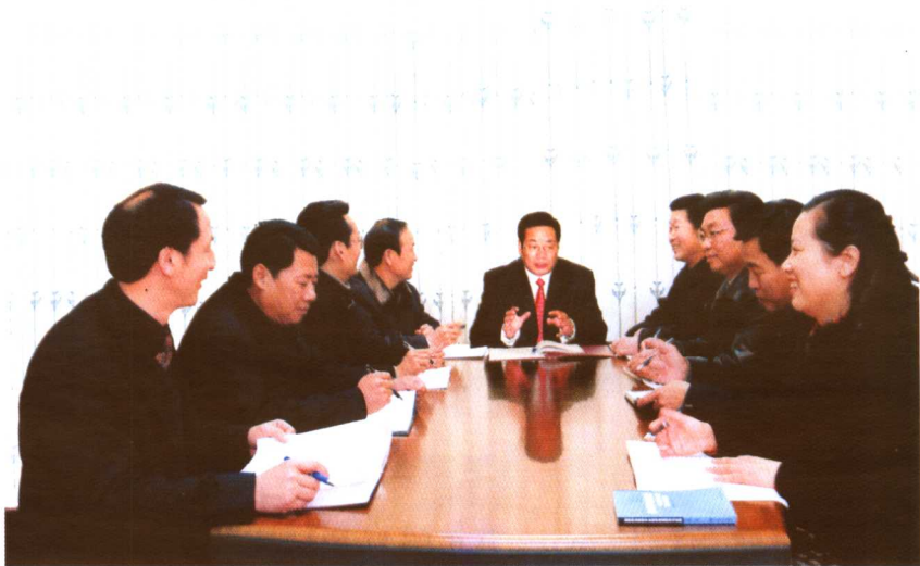
◆ 学院党委一班人共商发展大计