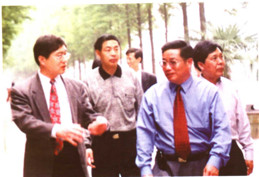
◆ 湖北省教育厅厅长路钢（前排左）视察学院