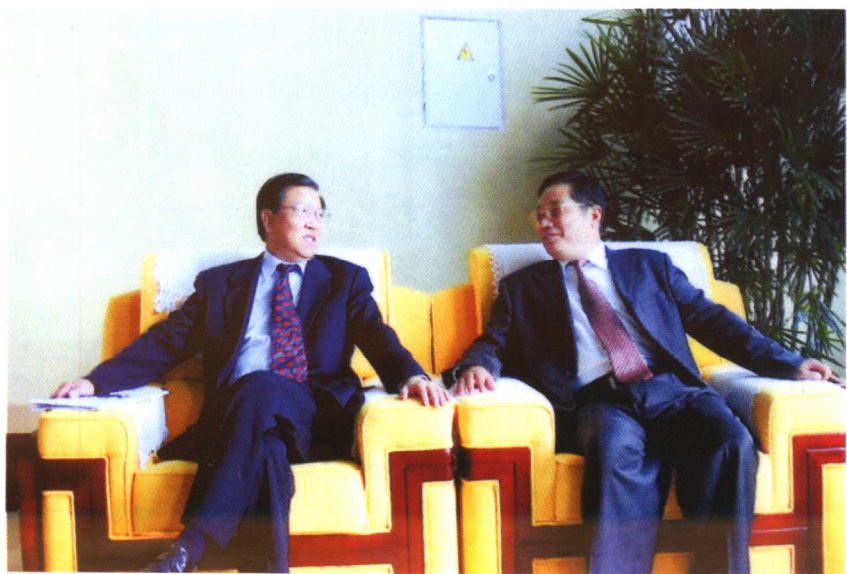
◆ 作者与博鳌亚洲论坛秘书长龙永图(左) 亲切交谈