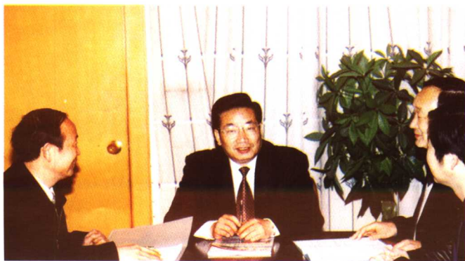
◆ 作者在办公室工作