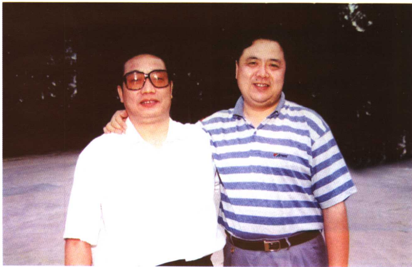
◆ 作者与湖北省经委主任许克振(右)在一起