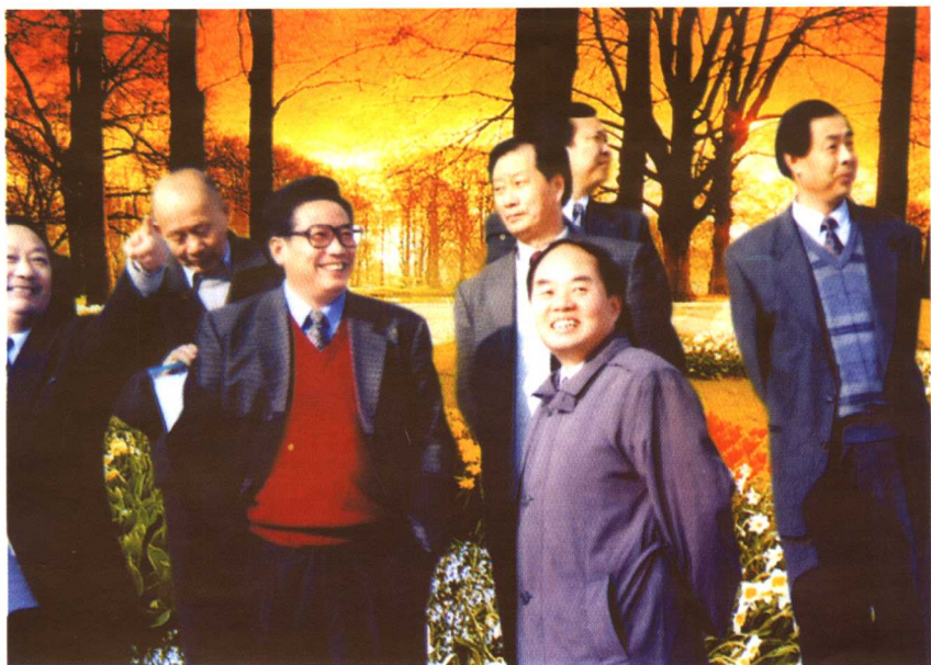
◆ 国家教育部部长周济(前排左三)视察学院