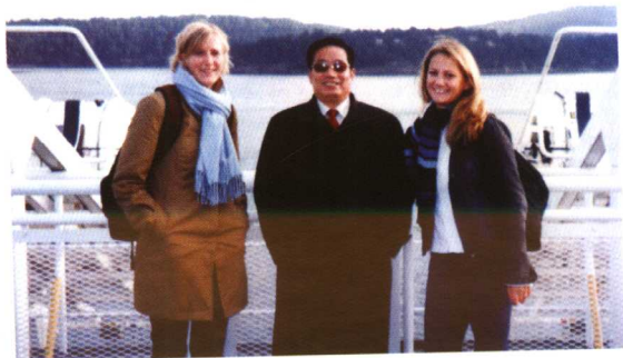
◆ 作者与加拿大大学生在一起