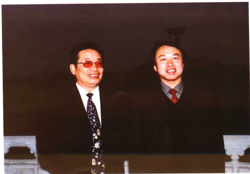
◆ 湖北省教育厅副厅长陈传德（右）视察学院