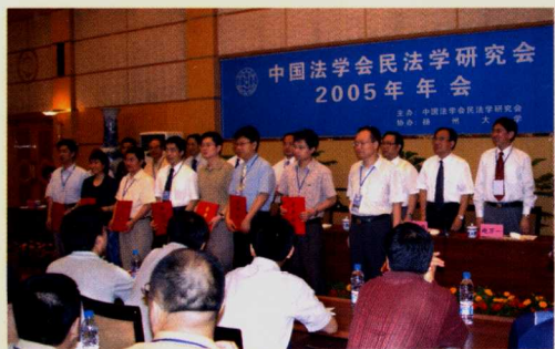
3. 中国法学会民法学研究会2005年年会颁奖仪式