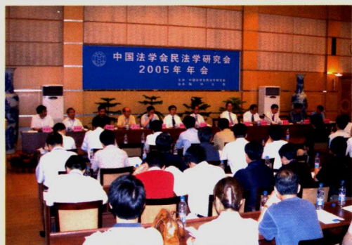
1. 中国法学会民法学研究会2005年年会开幕