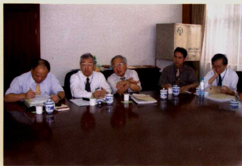
3. 台湾学者讨论发言