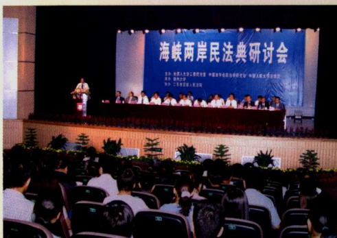
2. 海峡两岸民法典研讨会开幕