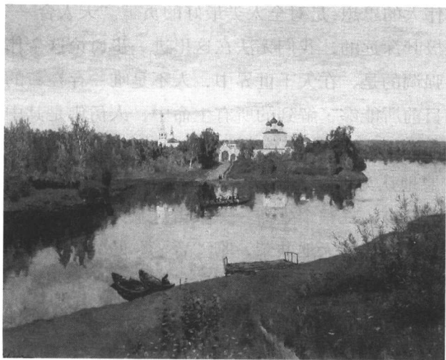
俄罗斯风光(油画)列维坦

但是,我们应该认识到,处于农业时代阶段的园林艺术,其基本特征是直接为统治阶级帝王或少数贵族服务的,是私有化的,这也正是与现代景观设计中所具有的“公共性”特征的最大区别所在。另外,私有化的园林艺术的不断开发,其占有者必然不会考虑社会和整体环境发展等问题,必然会对自然环境造成一定程度的破坏,好在这一时期的生产力及技术条件相对低下,故在漫长的岁月里,并未造成严重的不良后果。