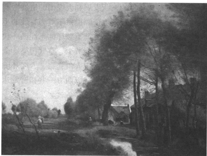
乡间的小路(油画)柯罗