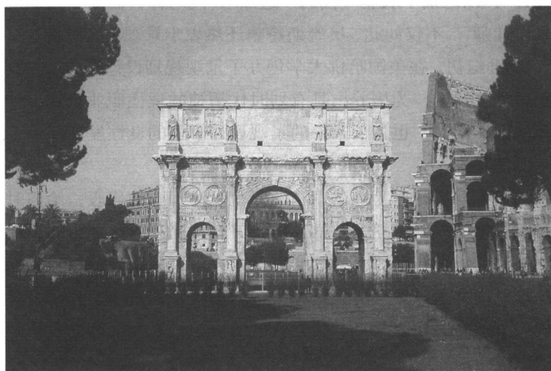
君士坦丁凯旋门(罗马)