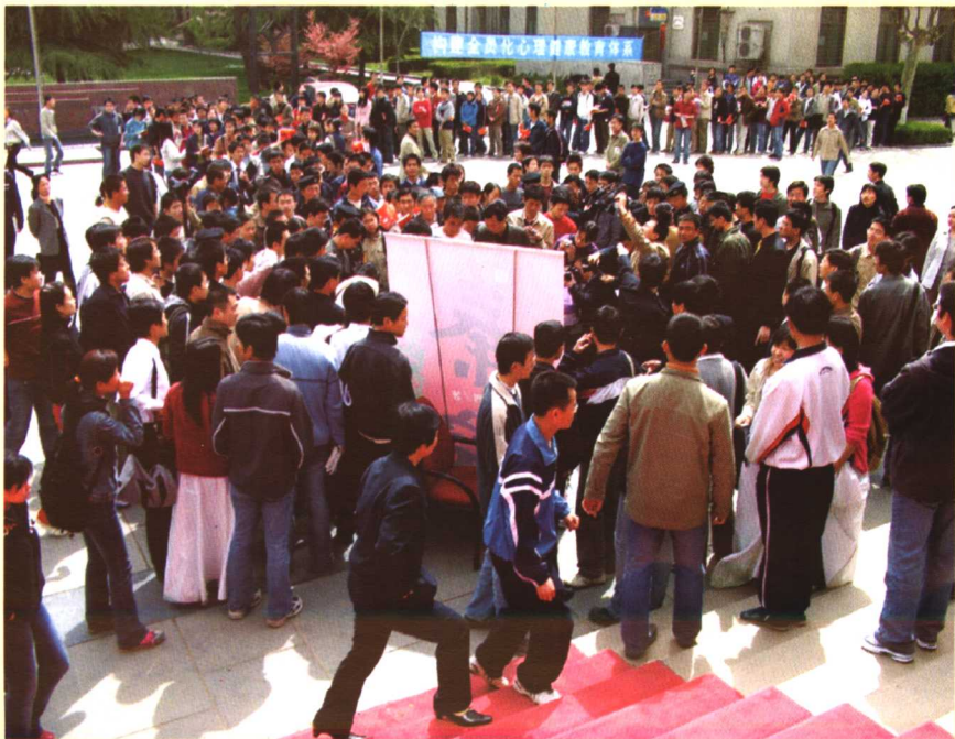
凹迷们聚集贾平凹《秦腔》签名现场。