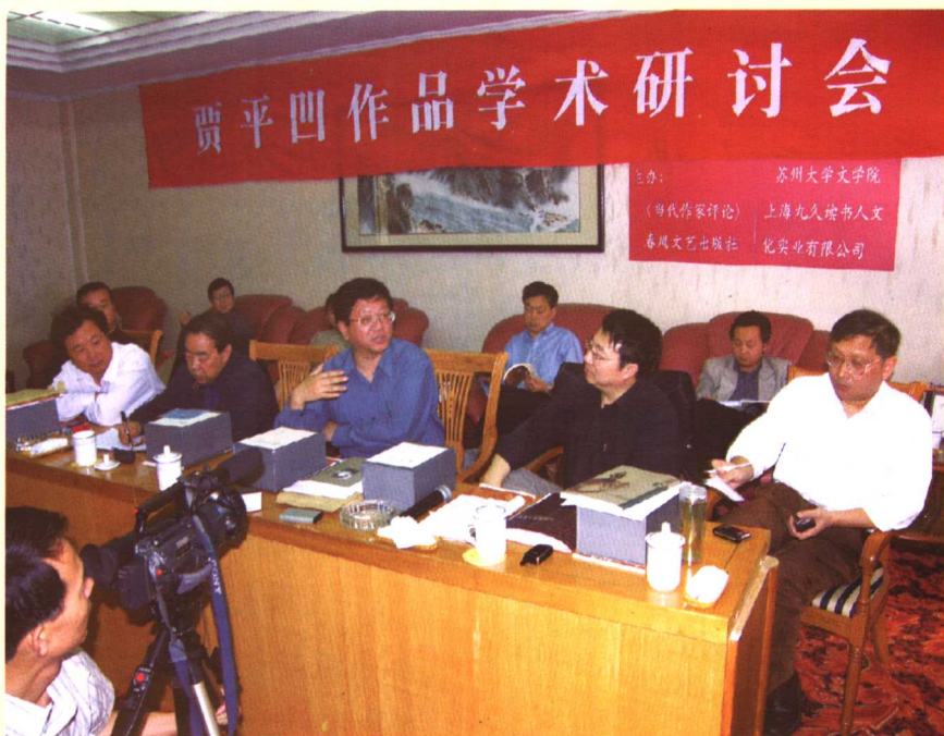
2006年5月上旬，贾平凹作品学术研讨会在江苏省常熟市举行。