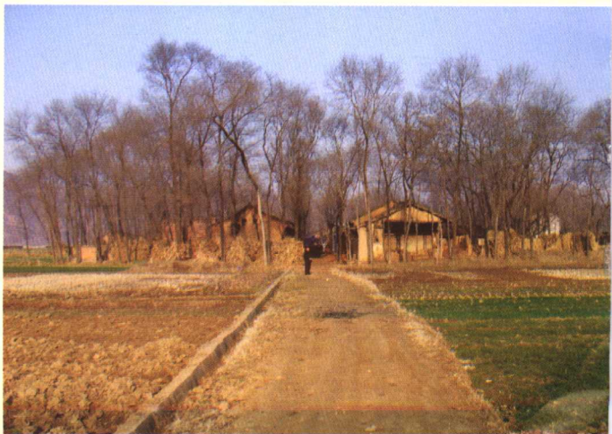
贾平凹故乡的道路，文学大师由此走向世界。