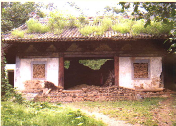
贾平凹儿时读书的地方。