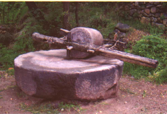
贾平凹故乡的碾盘，时常出现在贾平凹的笔下。 (孔明摄影)