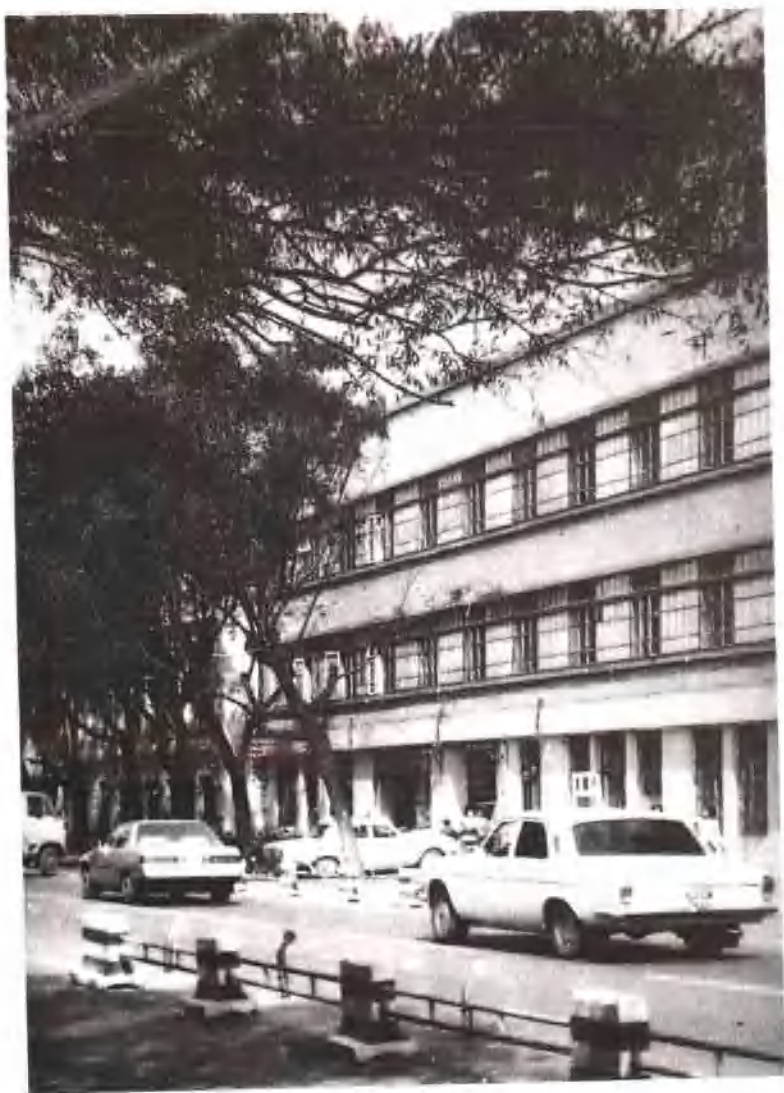
东北书店旧址(地殿街 59 号)