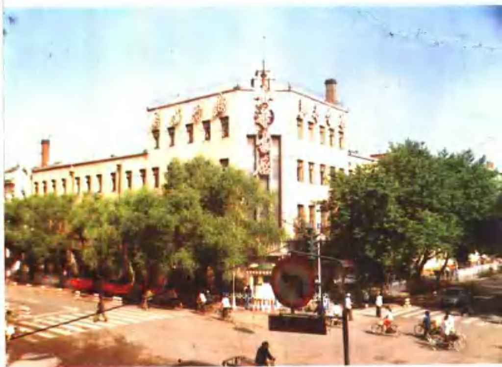
道里石头道街101号和地段街148号一、 二楼为道里新华书店,三、四楼为哈尔滨市新华 书店。