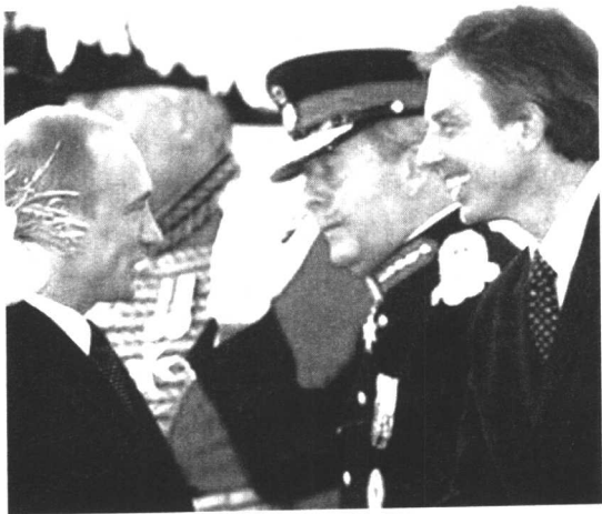
为振兴经济,融入欧洲,普京不断加强与欧洲各国的关系。这是2003年6月25日俄罗斯总统普京访问英国在伦敦受到英国首相布莱尔(右一)的欢迎

彼得大帝义无反顾的西化国策,在彼得堡打开了“一扇敞向西欧的窗口”,使国家逐步通过改革强盛起来,为俄自立于欧洲民族之林打下了较好的基础;从具有西欧血统的罗曼诺夫王朝终结后到苏联解体期间,俄又成了意识形态意义上的东方阵营的领袖;戈尔巴乔夫、叶利钦“改革”的主要民族情绪动因之一,就是“让俄罗斯返回欧洲”;普京执政以来,尤其是最近两三年,俄开始在东、西甚至南、北之间谋求某种平衡。一个民