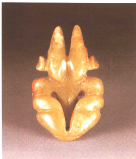
红山文化 玉雕太阳神