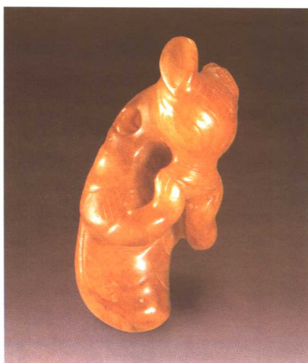
红山文化 黄玉兽首虫身坠