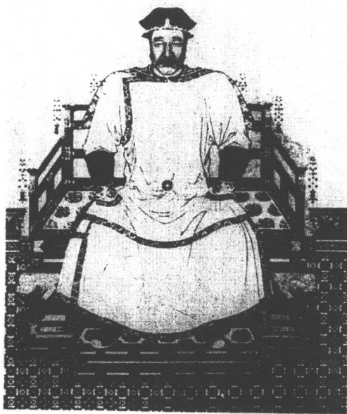
图 1-2 努尔哈赤像

明时的女真族还处于氏族部落酋长制的社会形态，女真人出猎或出战一般由 10 人组成，称“牛录”，其首领称“牛录额真”（箭主的意思）。出行则合，归寨则散，基本上是按自然村的小规模组合。随着努尔哈赤实力不断壮大，为适应形势的发展，他对女真人的社会组织形式进行了改造，他将每个牛录扩充为 300 人，牛录成为一种社会组织单位。牛录额真成为一种官职，汉译为“佐领”；5 个牛录组成一个“甲喇”，由甲喇额真统辖，官职称“参领”；5 个甲喇编成一个“固山”，由固山额真统辖，职名“都统”。每一固山以一种颜色的旗帜为标识，所以这种组织形式被称作“旗”。万历二十九年（公元 1601 年）初设旗时只有黄、红、白、蓝四旗，万历四十三年又增设镶边的黄、红、蓝、白四旗，形成了正黄、正红、正白、正蓝、镶黄、镶红、镶白、镶蓝八旗。努尔哈赤为八旗的最高统帅，亲领正黄，镶黄两旗。其他六旗均由他的子弟统领。八旗组织兼有军事、行政和生产三方面的职能，对提高女真人的战斗力及促进社会经济的发展起到了积极的作用。