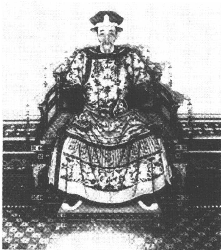
图 1-4 康熙皇帝像

李自成农民起义军推翻明王朝后，多尔衮审时度势巧妙地利用汉族地主将农民军视为贼寇，视明朝为正统的传统心理，打着“为尔等复君仇，非杀尔百姓，今所诛者唯闯贼” ① 的旗帜，借驻守山海关明辽东总兵吴三桂之力入关，击退李自成农民军，于五月初三抢占北京，顺利地开始了清王朝对全国的统治。为了稳定局势，进京的第二天就为明朝崇祯皇帝发表，下令全城官民服丧三日，由礼部依明帝陵寝修造“思陵”，依礼安葬。对明帝的宗室、官僚仍沿袭旧封号，不加改削；留用各衙门官员，对有影响的汉官给以高官厚禄，优礼有加。如：明文渊阁大学士兼户部尚书冯铨、兵部侍郎金