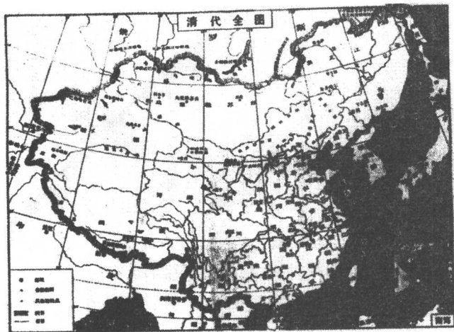
图 1-5 清代全图