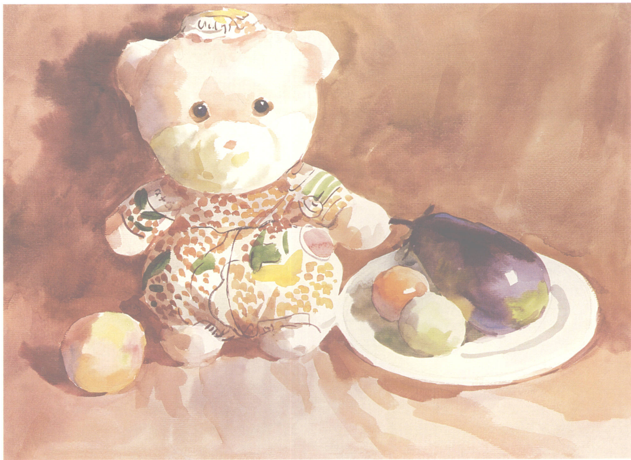
小白熊 39cm × 54cm

淡彩技法是在铅笔或钢笔素描的基础上添加水彩颜色的一种方法，运用淡彩技法一般是为了收集素材和绘制创作草图。因是在已有的素描底子上作