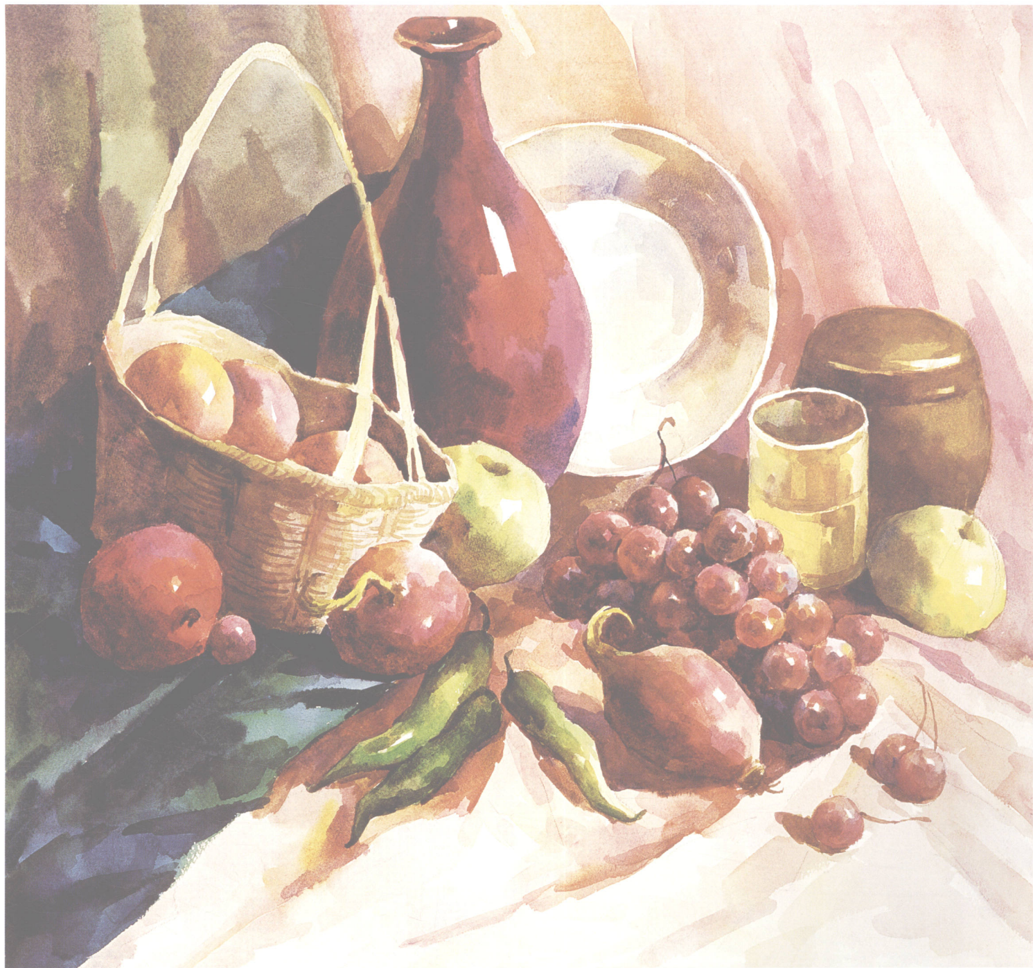
花瓶与水果 (统一调整) 78cm × 54cm

余地。但有些特殊的地方或强调透明性的地方，能一次画准就尽量一次画准，因为再次上色的效果可能会差一些。铺大体色时细节应尽量舍去。