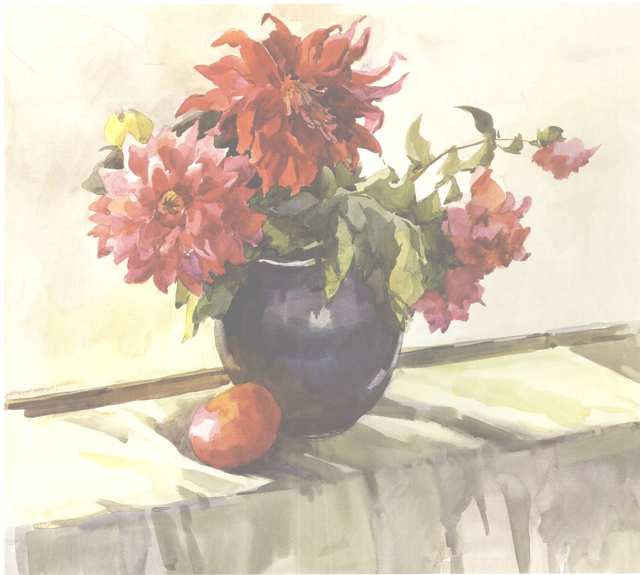
窗台上的大丽花 54cm × 45cm

当然，水彩画所使用的工具材料无可避免地对水彩画创作形成了一些限制。首先是水彩画的表现能力受到了限制，它无法产生像米勒的《拾穗者》那样意义深刻的作品；其次，水彩画颜料不持久，水彩画纸也会因年代久而变黄。我们应该尽量避免这些不利的因素，在不断提高自己技巧的基础上，充分发挥水彩画的特点，创作出高水平的作品。