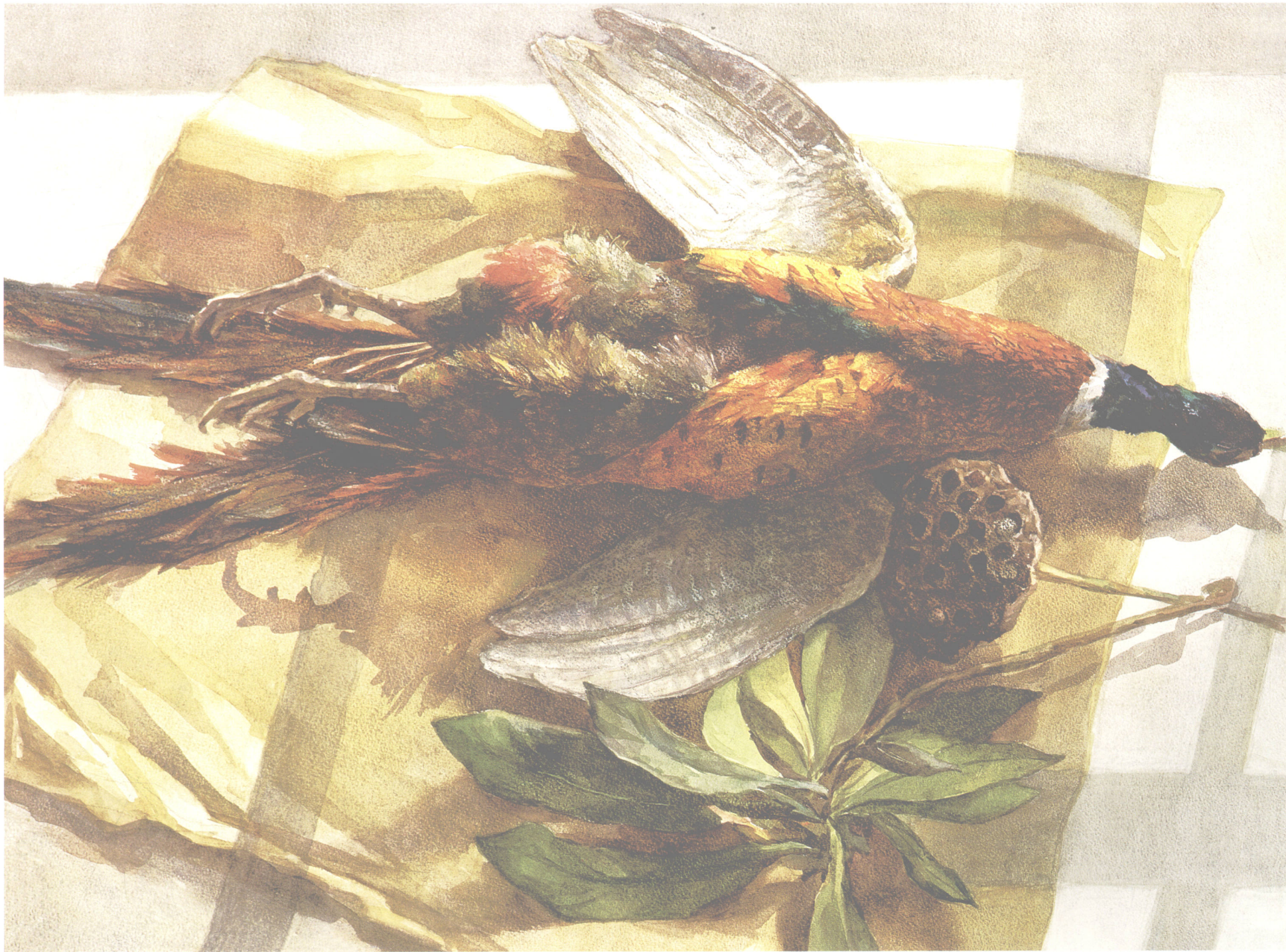
阴影下的野鸡 54cm × 78cm

不同质量感的物体在光源下产生的变化是不同的，如粗陶器、木桶、粗布、呢布、亚麻布、塑料制品、梨、桃子等。由于质感较粗，表面光洁度不高，所以反光较弱，没有明显的高光，交界线显得不够清晰，周围环境色对其影响不大。表现这类物体时可采用湿画法，运笔可较慢，笔上水分要适中，暗面尽量一次画成，用色较厚、较浓一些，让纸面多吸色，这样会形成一种很厚