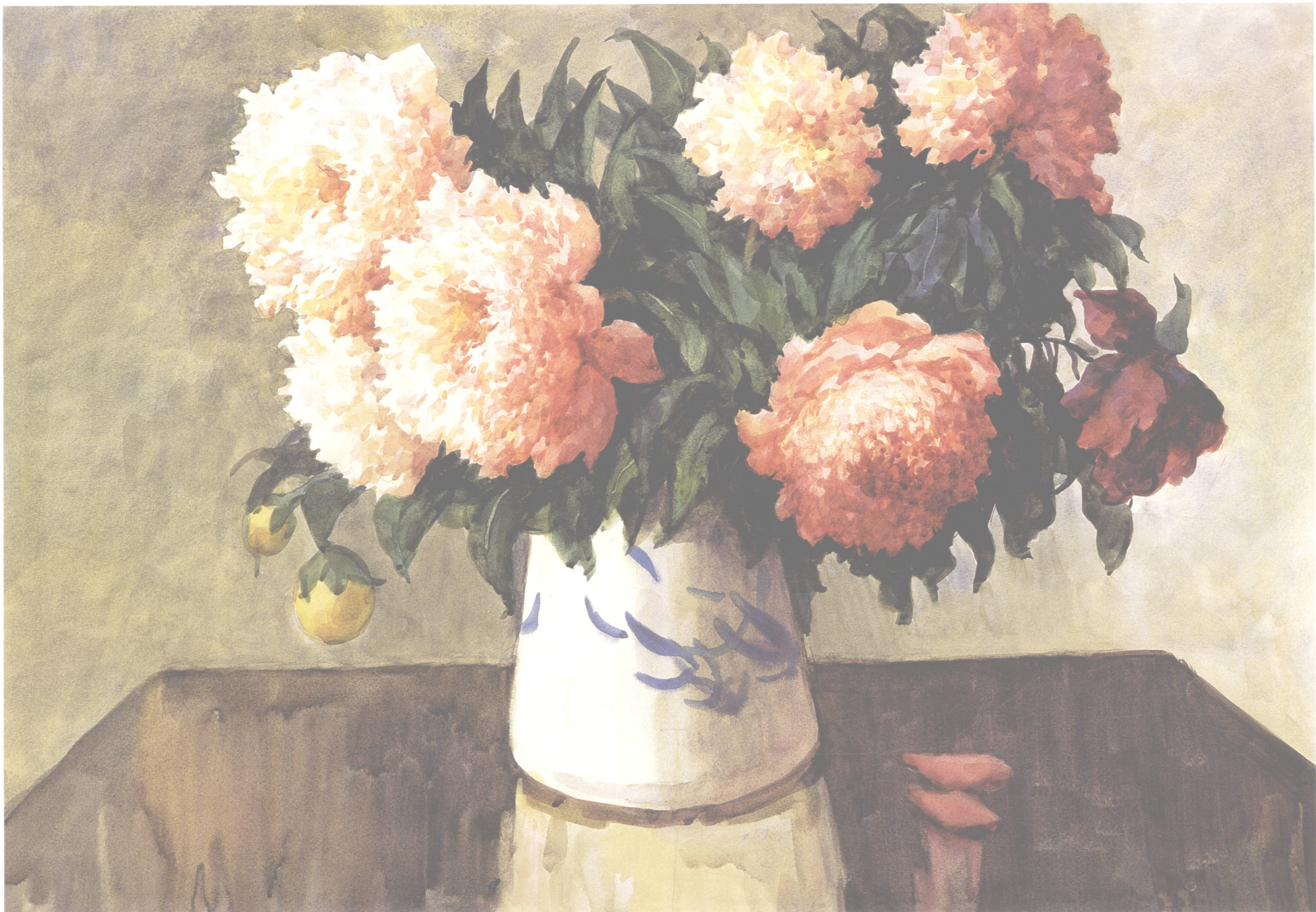
粉白芍药 54cm × 78cm

不透明性，群青还有另一种有趣的性能，即通常在粗糙或半粗糙的纸面上作画可产生“沉淀性渲染”的效果。还有“温莎·牛顿”的佩恩斯灰，它可以用来调和暖色中的透明色、渲染天空的颜色以及表现雾霭的气氛等。