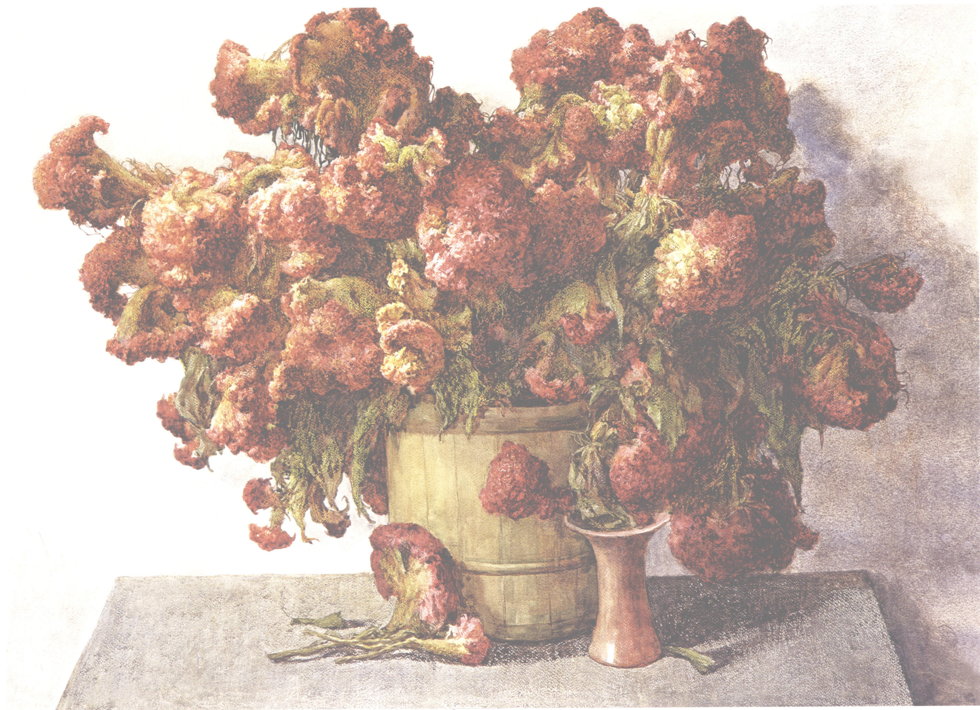
十月的鸡冠花 120cm × 78cm

自然界中静物的各种类型、色彩、质感、量感是丰富多彩的，而要想很好地表现出这种变化，就必须通过各种丰富的表现技法来完成。所以在写生中对于不同质量感的物体要给予很大的重视，并且通过写生掌握各类物体特殊的表现方法，提高色彩的造型能力。