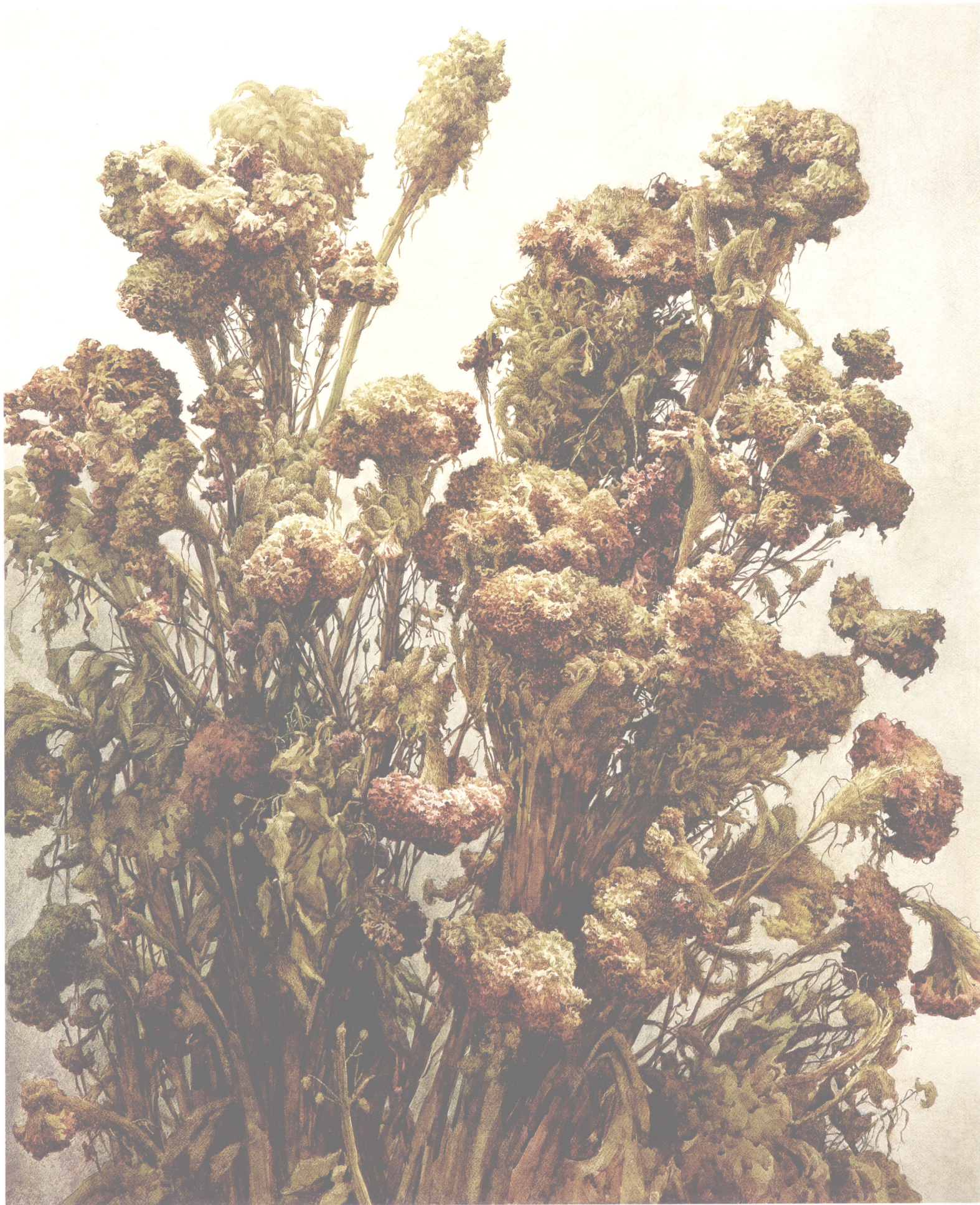
鸡冠花 108cm × 78cm