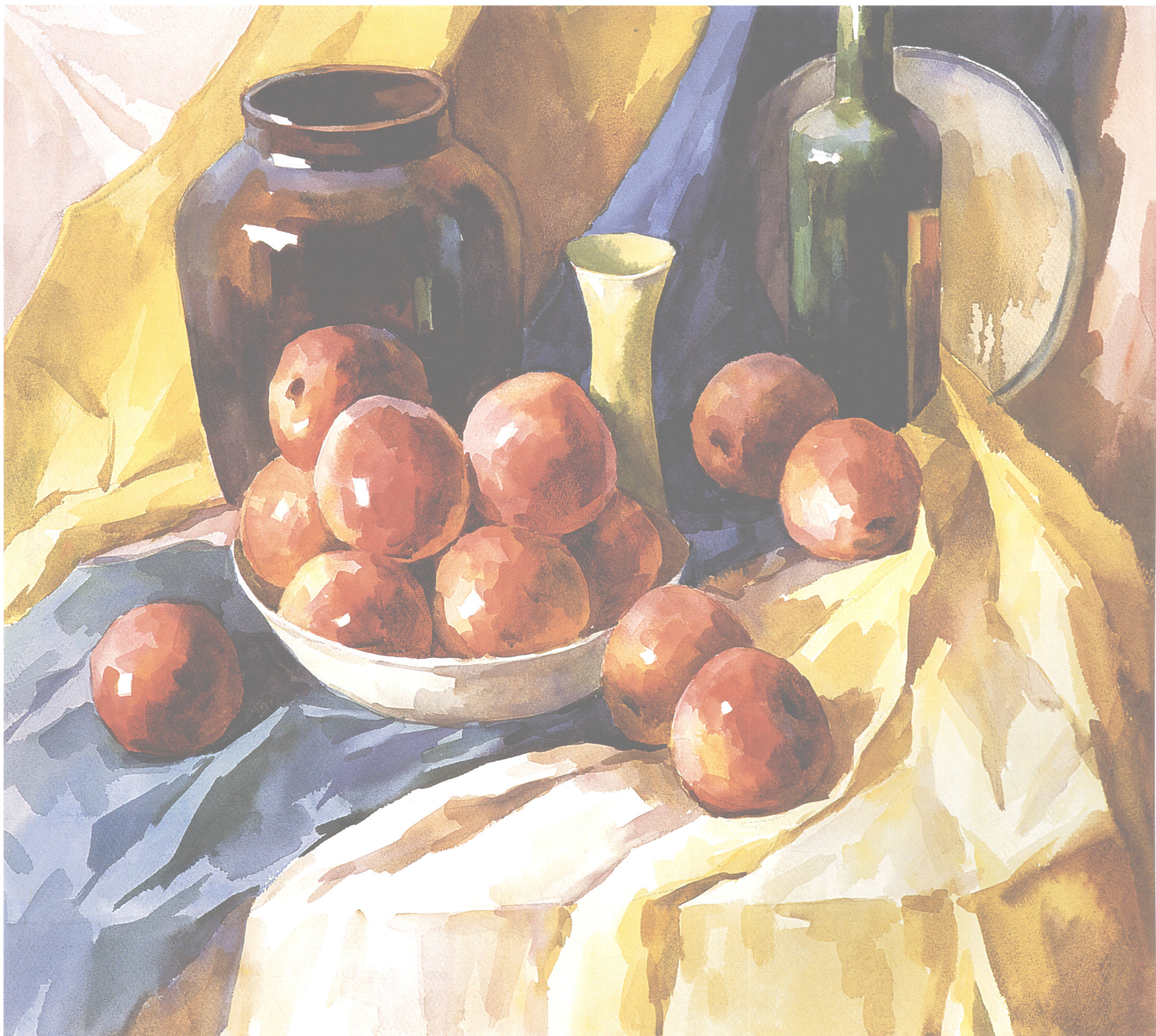
有陶罐的静物（统一调整） 78cm × 54cm