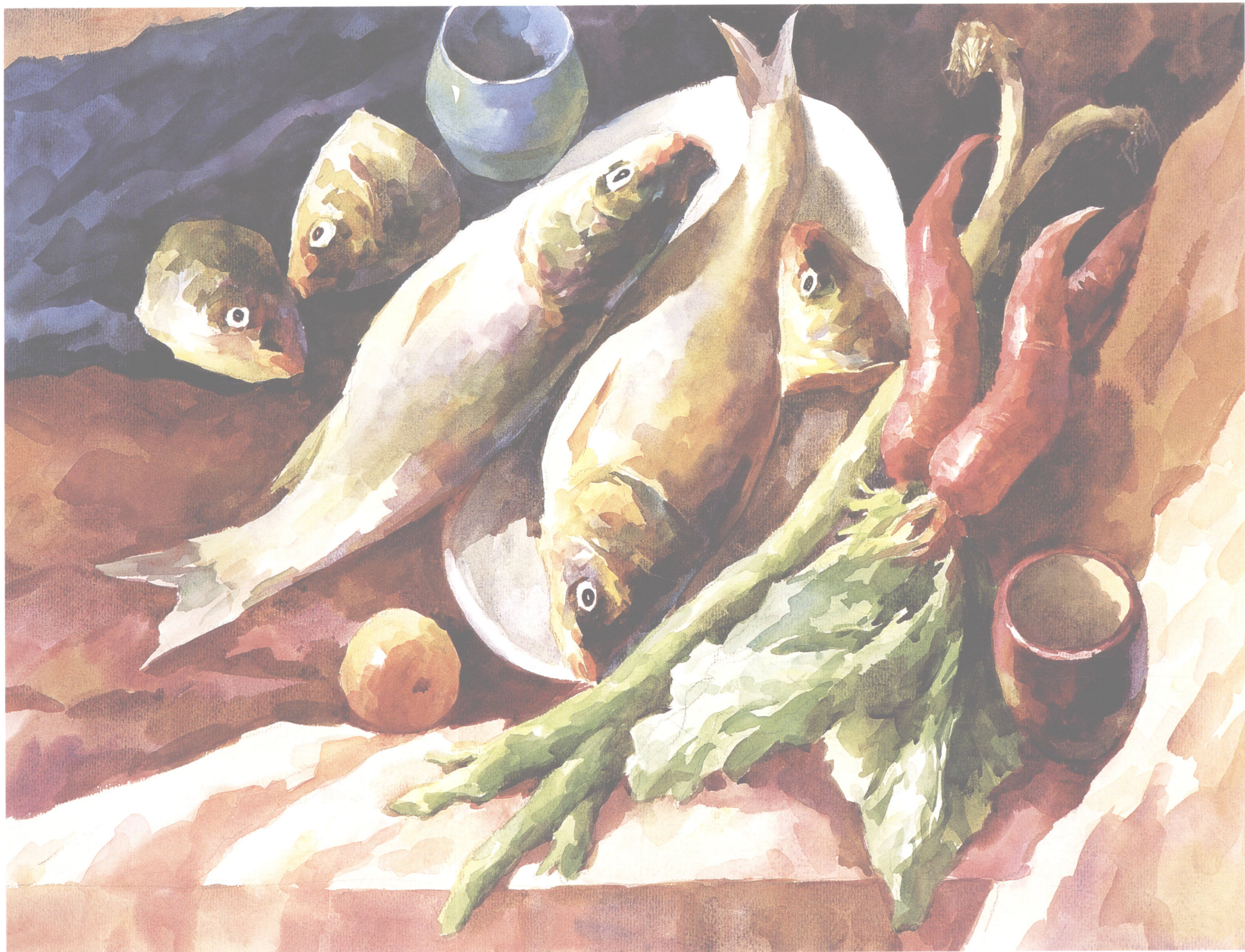
萝卜和鱼 54cm × 78cm

画，所以淡彩技法的用色一般都比较概括、简练。这种画法比干画法和湿画法更容易掌握，因而较适合于初学者。