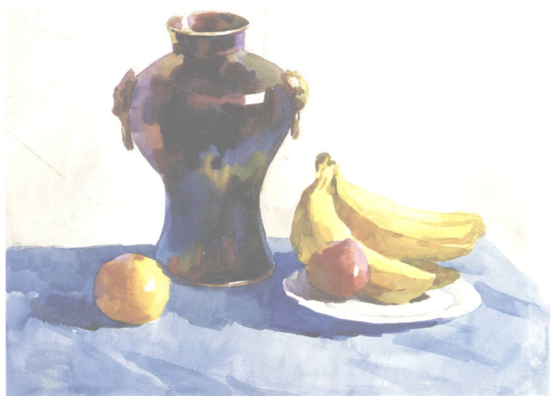
有陶罐的静物 39cm × 54cm

确定每组静物的色调构成也是摆放静物的一个关键，主体物和陪衬物体之间的色彩对比对画面色调的调和起着非常重要的作用。如冷色与暖色、透明与厚重、明与暗、轻快与凝重、艳丽与灰浊等对比变化的节奏感等等。不同的色调表达不同的主题思想和不同的情感，它们在对比、和谐中产生一种美感。