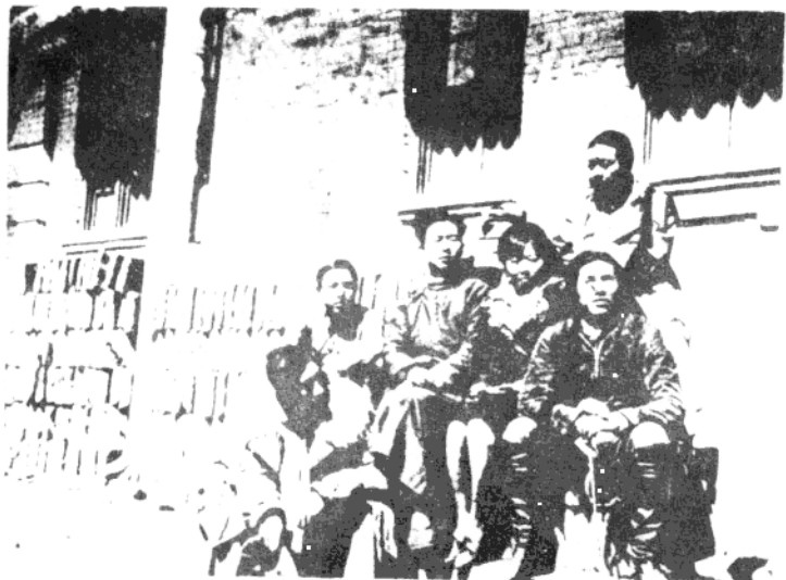
一九三八年初萧红与端木蕻良、丁玲、田间、聂绀弩、塞克在八路军办事处前合影。