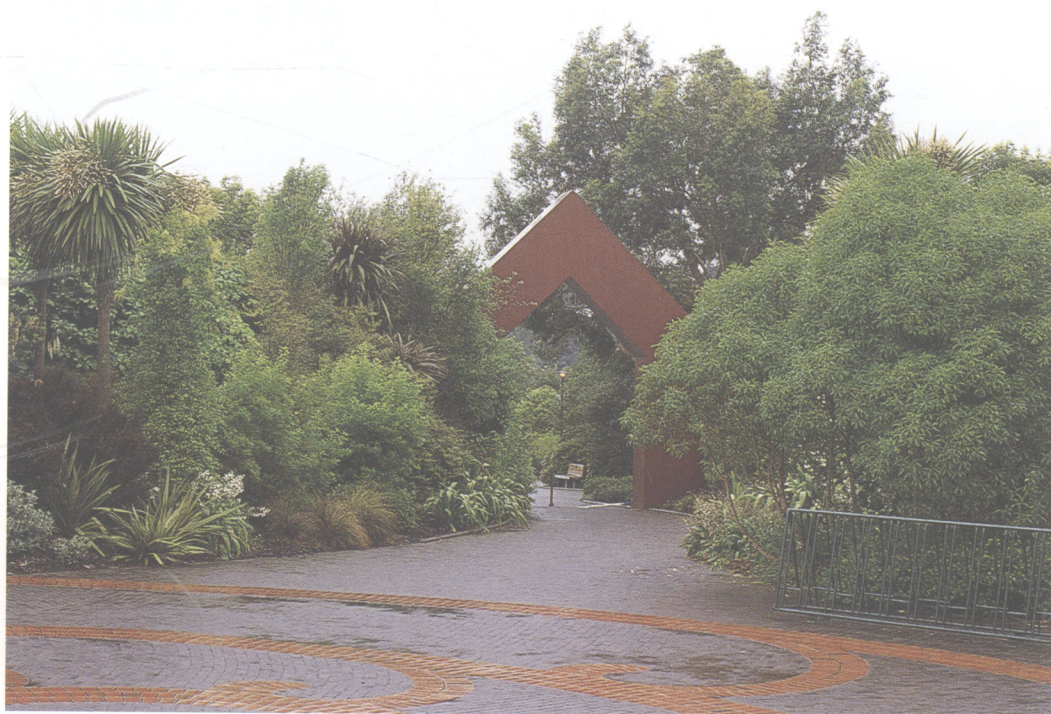
▲ 简易的门框将两个内容不同的专类园分隔开