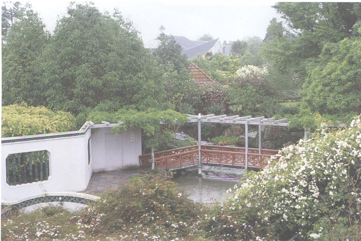
▲ 具有中国江南私家园林风格的小园林