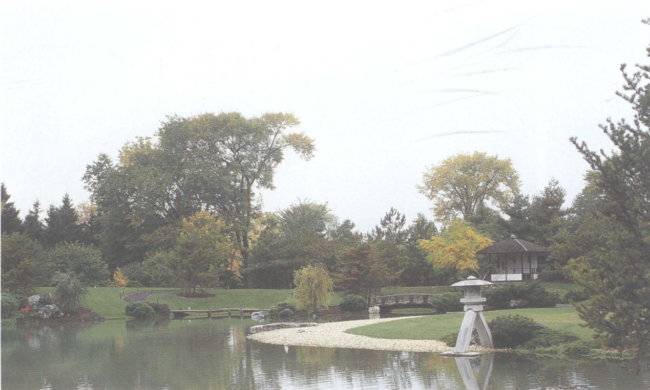
▲ 公园中溶入了日本园林的风格，使景观更加丰富，故学习借鉴外国的一些造园手法是完全必要的。