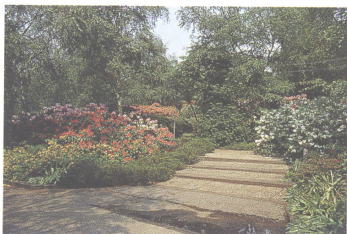
▲ 路边花境增色添美