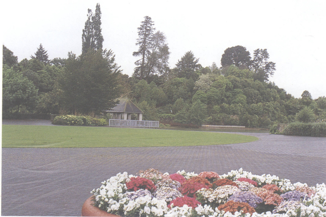
▲ 繁花似锦的花坛，平坦整齐的草坪和各种形态的林木，以及由林木构成变化多端的天际线使园林景观几近完美。

海默尔顿公园是新西兰名园，在国际上享有盛誉，属英国式自然风景园。设计大师从大处着眼又细理精微，故气势恢弘，仪态万千。园内由无锡园林局建造的中国园林，巧于因借，布局精致，为该园增色不少。