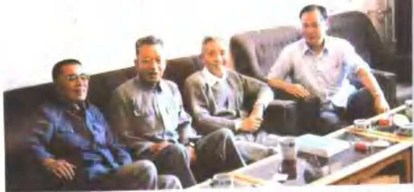
南阳地方志编委主要领导在《南阳商业志》审定会议上