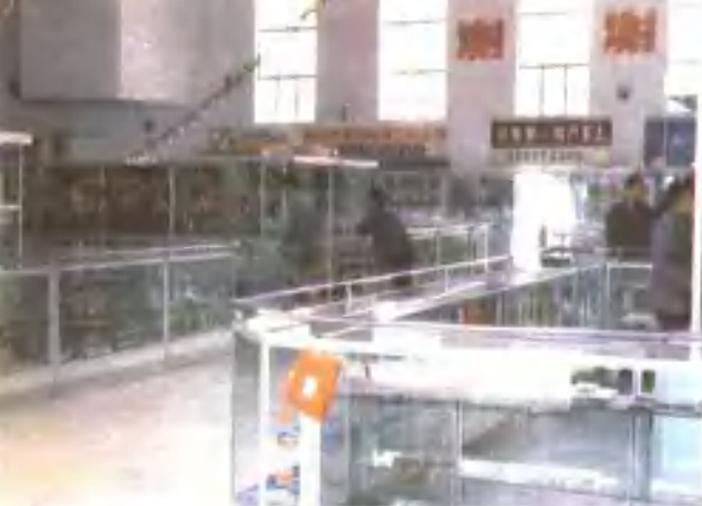
南阳五 交化站 商场一 角