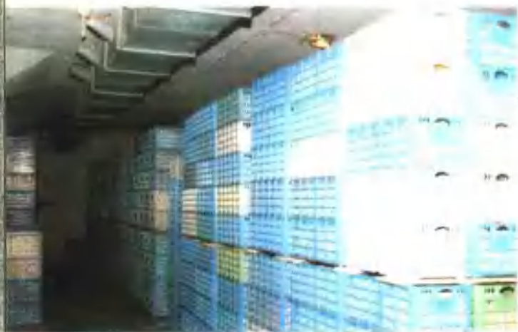
←南阳肉联厂 蛋品储存 库一角