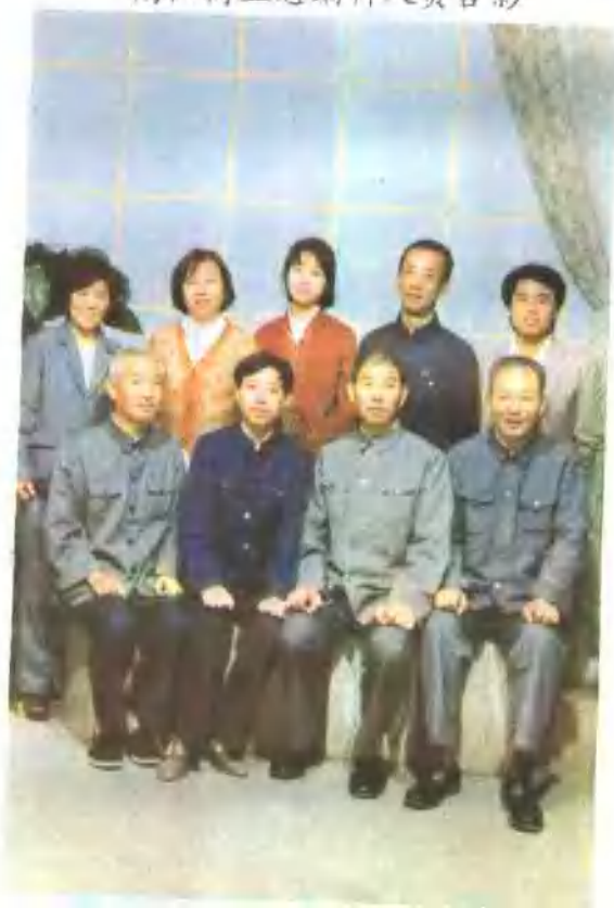
南阳商业志编辑人员合影