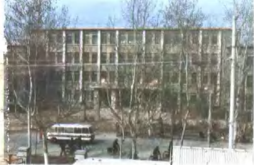
南阳地区商业局办公楼