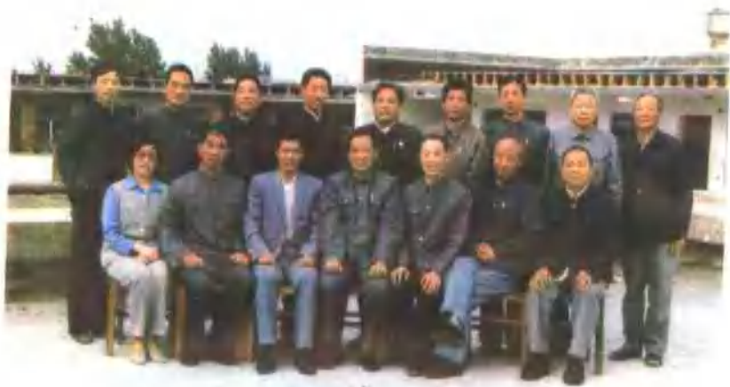
南阳商业志编委成员合影