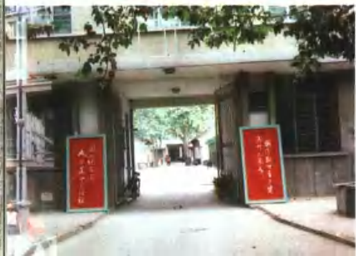
←南阳地区 商业学校