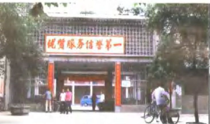
↓ 南阳地区副食品公司副食品展销部