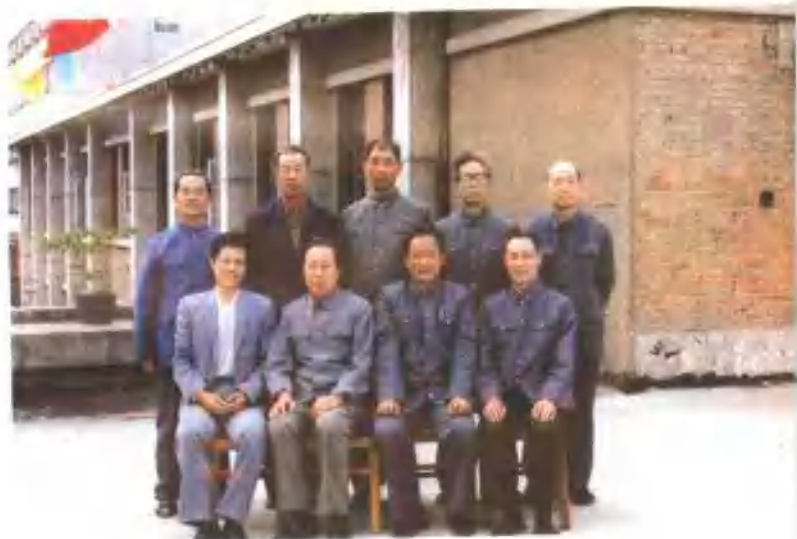
南阳地区商业局行政领导班子合影