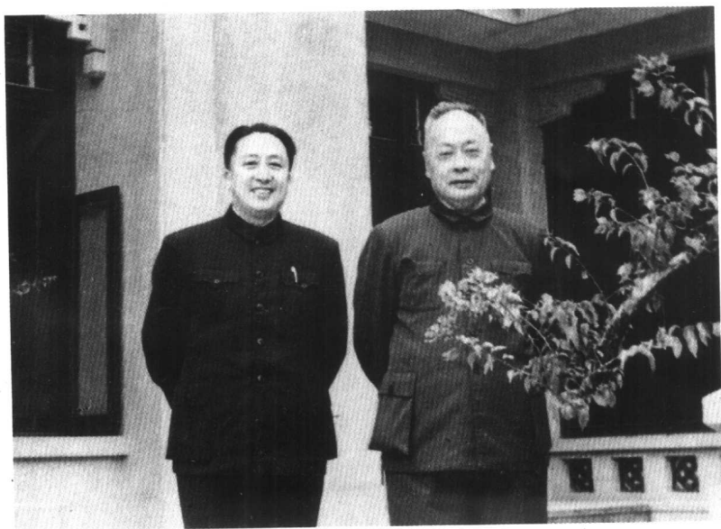
1966年在广州丛化与陈毅