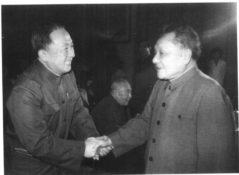
1981年元旦在人民大会堂与邓小平