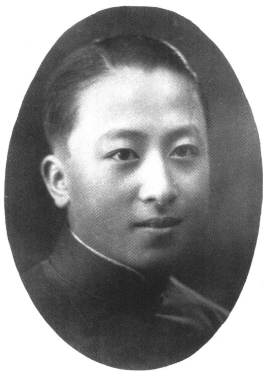
◀ 1931年， 天津高中时期 留影。