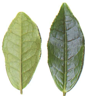
叶片上有明显的主脉。

叶片有明显的主脉，主脉上又分出侧脉5~15对，呈60度角伸展至叶缘2/3处即上向弯曲呈弧形，与上方侧脉相连，组成一个闭合网状输导系统。这是茶树叶片的重要特征之一。