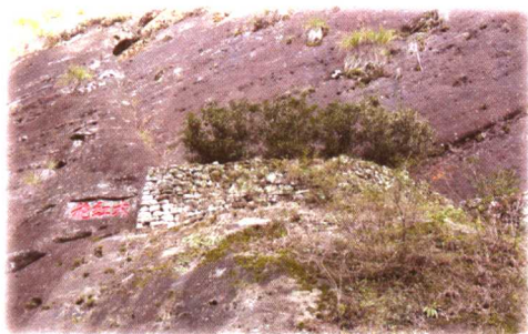
中国最古老的茶树“大红袍”（福建武夷山）

茶树原产于中国西南山区，树型可分为灌木、小乔木和乔木，具有喜温、喜湿、喜酸、耐阴的特色。在年平均温 15^{\circ}\text{C} ~ 25^{\circ}\text{C} 之间的高山、丘陵、平地都可见到。