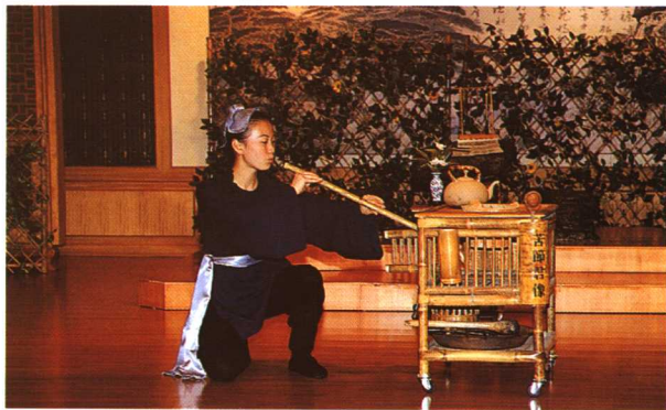
明朝时期的文化茶礼。

隋的历史不长，有关茶的记载也不多，但由于隋统一了全国并修造了一条沟通南北的运河，这对于茶业的发展起着极为重要的作用。