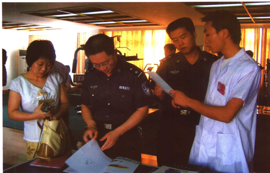
国家国民体质监测中心的专家(左一)在我省某公安系统测试现场检察工作。