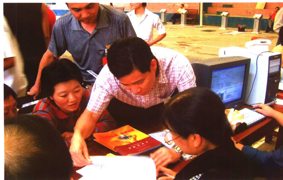
省国民体质监测中心专家(右二)在测试现场指导工作。