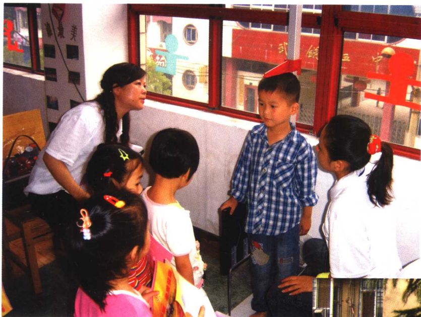
幼儿形态测试现场。