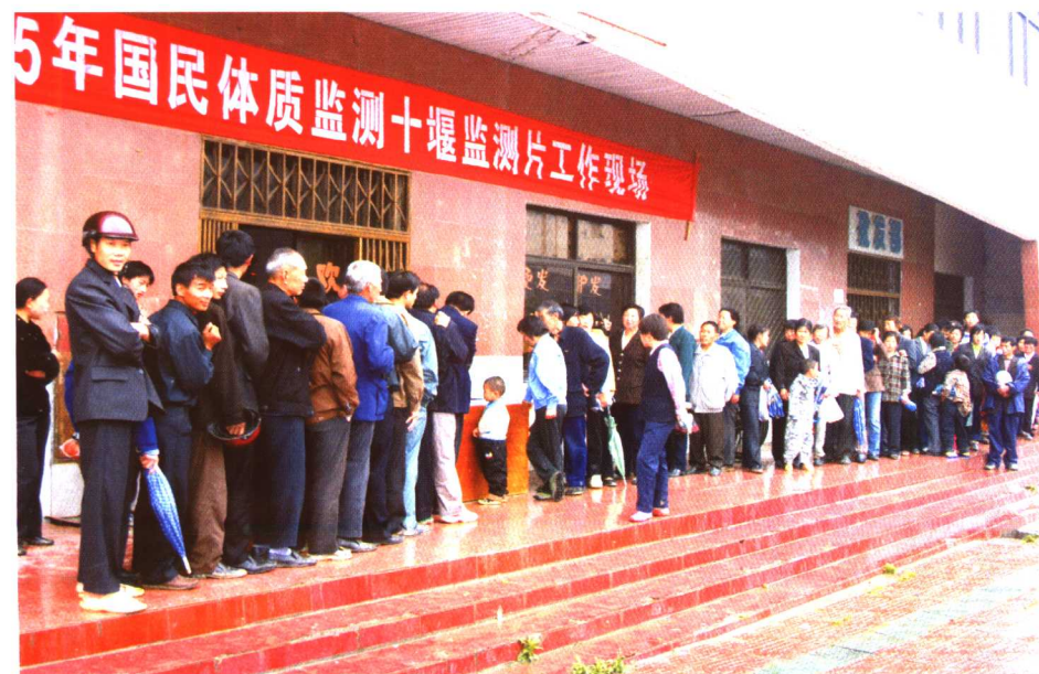
踊跃参加国民体质监测的人群,在测试场外有序地等候。