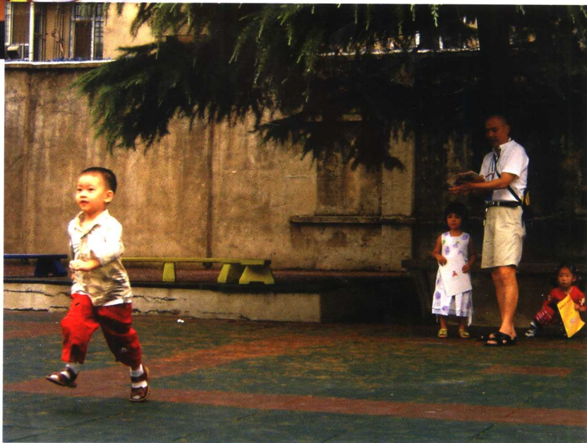
幼儿素质测试现场。