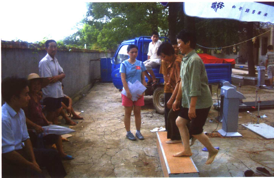
黄土地上的测试现场。