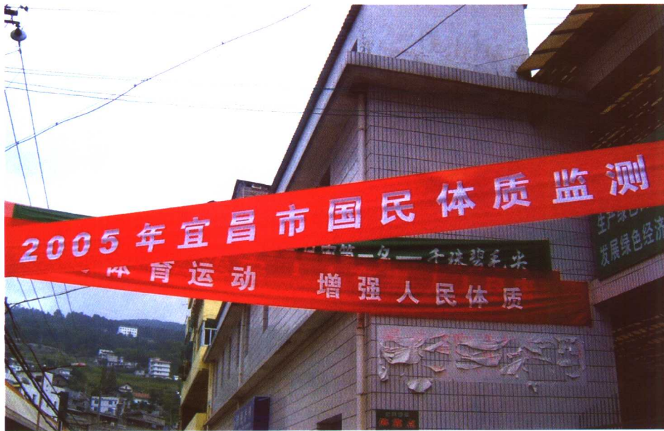
湖北省山区小镇的国民体质监测宣传横幅。