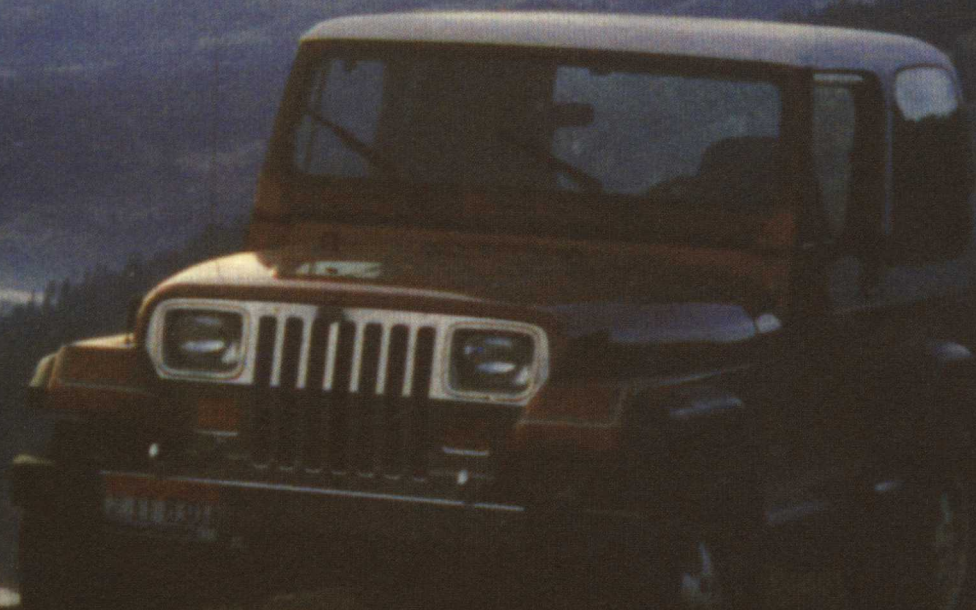
图1. 作者的妻子和爱犬荷西在眺望清水河峡谷。

拥有 SUV 的家庭可以宣称：“我们可以靠自己！如果遇到紧急情况时，我们有办法、也受过良好的训练，能把自己运送到远离危险的安全地带。我们能逃避台风、洪水、森林与草原大火、地震余波。