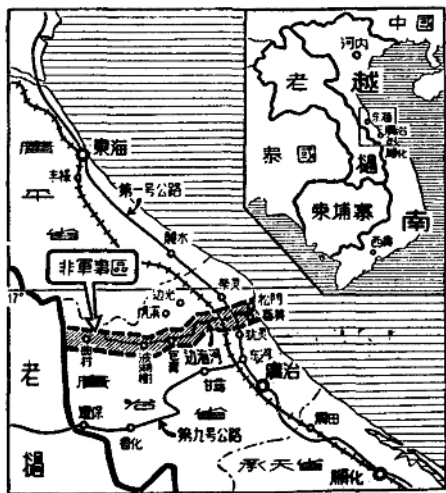
越南臨時軍事分界線圖

但是，戰爭雖已停止，鬥爭却絕未結束。美國侵略集團正千方百計地要破壞日內瓦會議所達成的協議，它竭力要使越南永久分裂，並把老撾、柬埔寨拉入東南亞侵略集團。對於美國侵略集團的這一陰謀，越南人民感到無比憤怒；他們決心要使自己的祖國成為一個統一、獨立、民主和自由的人民共和國。毫無疑問，在全世界和平力量的支持之下，越南人民的這個正義願望是一定會實現的！