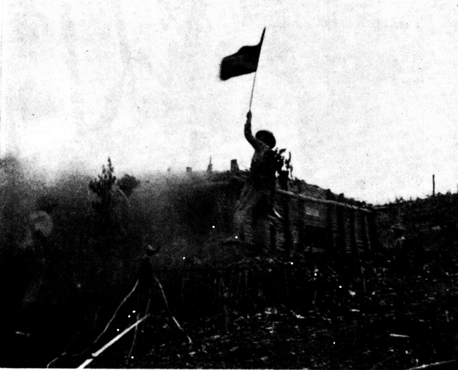
一九五三年十二月，越南人民軍攻入萊州城，上圖為佔領敵據點的一個鏡頭。