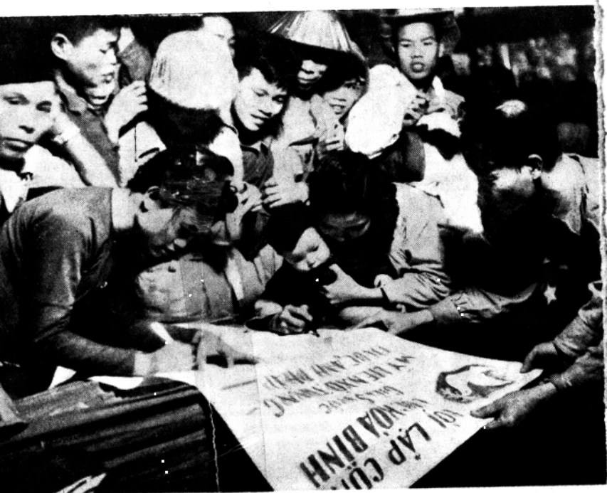
越南人民熱愛和平，並積極地以實際行動保衛和平。上圖是越南人民在要求五大國締結和平公約的宣言上紛紛簽名。