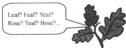
图 1-1 你为什么叫它“叶子”?

简而言之,任意性意味着声音和意义间的联系没有特别的理由,或者说声音和它所表示的意义之间没有自然和不可避免的联系。