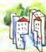
شي دان 西单