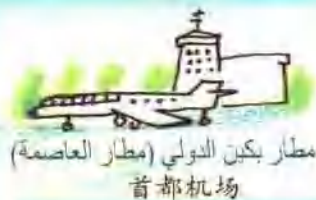
مطار بكين الدولي (مطار العاصمة) 首都机场