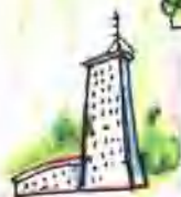
المحطة التلفزيونية المركزية 中央电视台