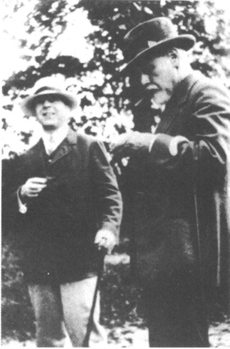
左图 弗洛伊德与钟斯合摄于1919年。这是两人在第一次世界大战后的首度聚首。