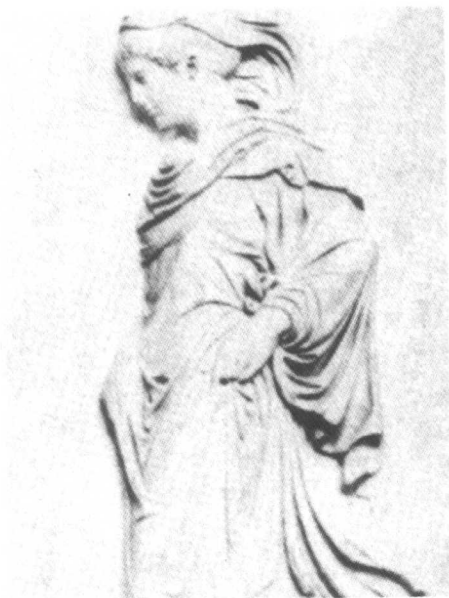
庞贝浮雕的“格拉迪娃”(Gradiva)，弗洛伊德在他的诊疗室里放了一座石膏复制作品。(Alinari/Artresources)。