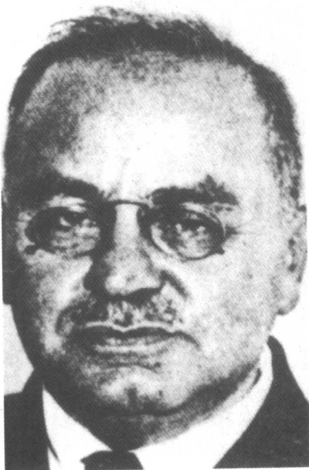
右上 阿弗烈·阿德勒 (Alfred Adler), 无疑是星期三心理学社中仅次于弗洛伊德, 最主要且最具影响力的人物。直到1911年两人的合作才结束。