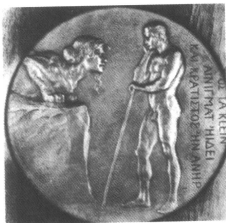
纪念奖牌的反面，所画的是伊底帕斯正在解答人面狮身兽的谜题。