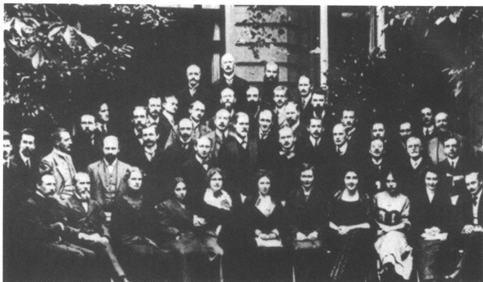
第三次国际精神分析代表大会的团体合照，摄于1911年9月德国魏玛。弗洛伊德站立于中间，他左边稍低一点的是桑朵·费伦奇，在他右边稍微弯腰的是卡尔·荣格。坐在前排的从左边数过来第五位是卢·安德烈亚斯-莎乐美。