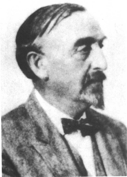
左上 威廉·史德克 (Wilhelm Stekel), 弗洛伊德早期口头上的支持者, 在1910年左右和弗洛伊德决裂。