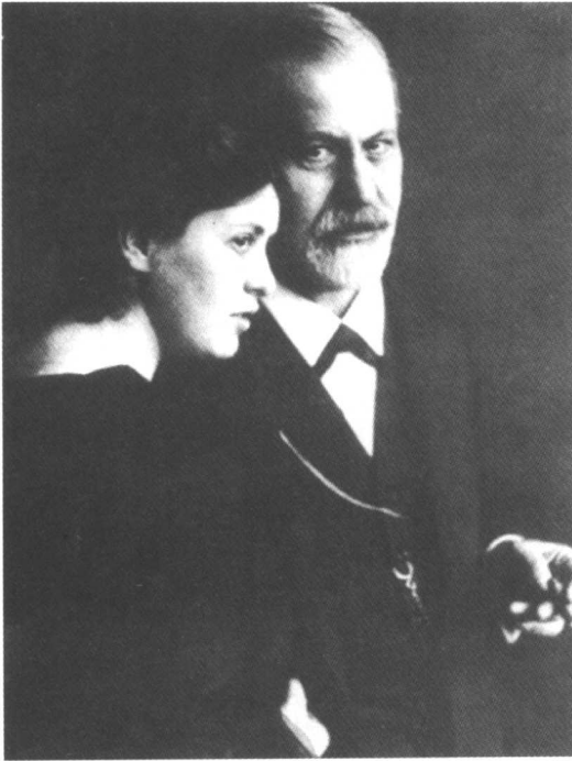
上图 弗洛伊德与女儿苏菲。苏菲在1920年因流行性感冒而去世。