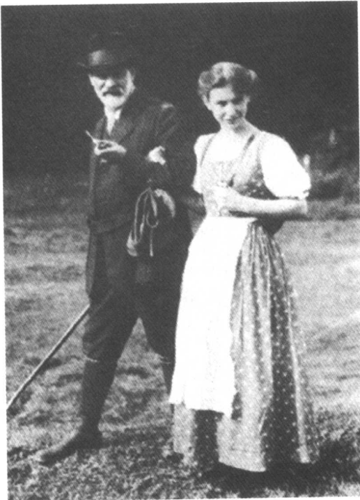
下图 1913年，弗洛伊德于暑假期间在意大利北部的多罗迈山区，当时 17岁的安娜挽着他的手。