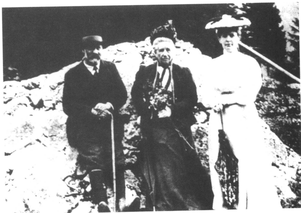
下图 弗洛伊德和他的太太，随侍在他母亲左右。摄于1905年奥斯湖 (Aussee) 的暑假。