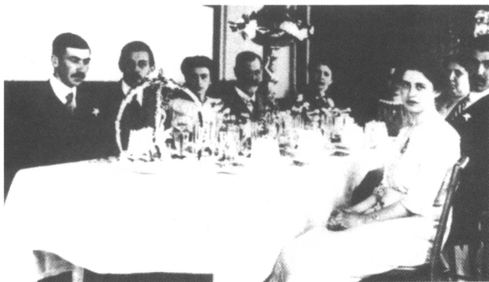
1911年9月14日，弗洛伊德的银婚庆祝聚会，伴着他的是小孩们和他们的敏娜阿姨。从左到右：奥立佛，恩斯特，安娜，弗洛伊德本人与玛尔塔，苏菲，玛蒂尔德，马丁，以及敏娜·贝内斯。