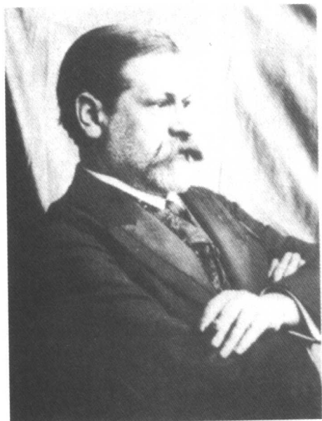
50岁左右的弗洛伊德，由儿子为他拍摄的一张快照，因此看起来不像其他照片那么令人望而生畏。