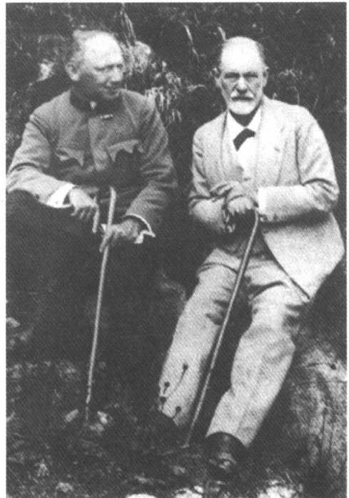
右图 弗洛伊德与桑朵·费伦奇。费伦奇当时（1917年）正在匈牙利军队里服役。