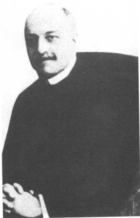
右图 爱德华·希契曼 (Eduard Hitschmann), 弗洛伊德在维也纳最值得信赖的助手之一。