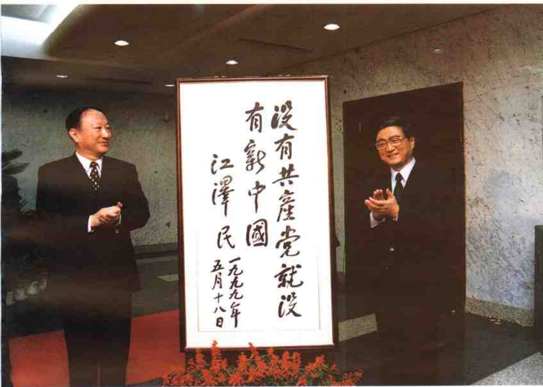
1999年5月18日，江泽民总书记为中共“一大”会址纪念馆扩建竣工开放亲笔题词：“没有共产党就没有新中国”。图为5月26日，在上海解放50周年之际，出席纪念馆扩建竣工开放仪式的中央政治局委员、中共上海市委书记黄菊，市长徐匡迪为江泽民总书记题词揭牌。