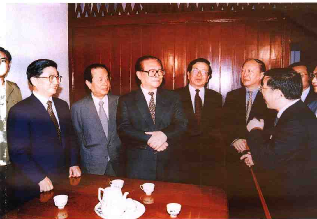
2001年6月12日，中共中央总书记、国家主席、中央军委主席江泽民，中共中央政治局委员、国务院副总理钱其琛，中共中央政治局候补委员、书记处书记、中组部部长曾庆红在中共中央政治局委员、上海市委书记黄菊，市长徐匡迪的陪同下，参观中共“一大”会址。