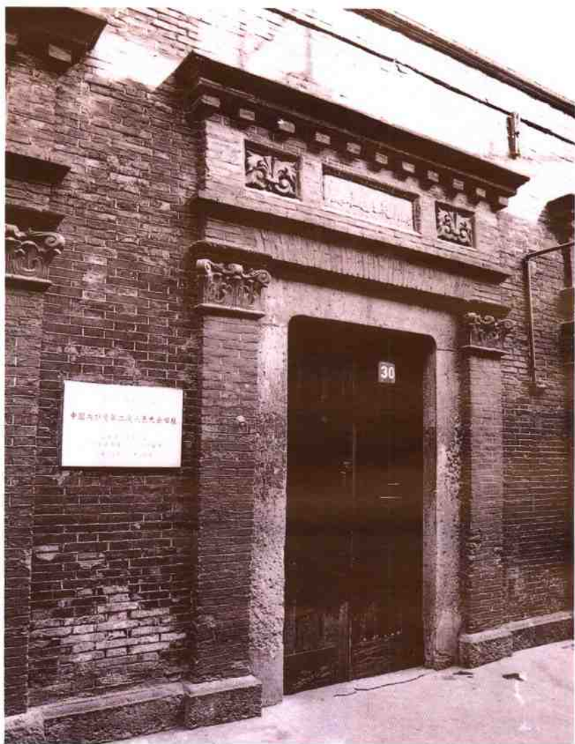
中国共产党第二次全国代表大会会址（上海原南成都路辅德里625号，今成都北路7弄30号）。