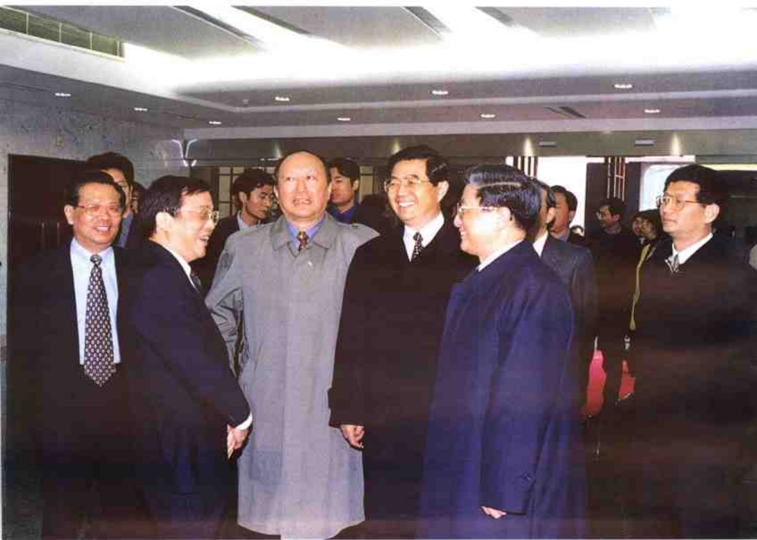
2000年11月14日，中共中央政治局常委，国家副主席胡锦涛在中共中央政治局委员，上海市委书记黄菊，市长徐匡迪，市委副书记孟建柱，龚学平，刘云耕等陪同下参观了中共“一大”会址纪念馆的基本陈列。