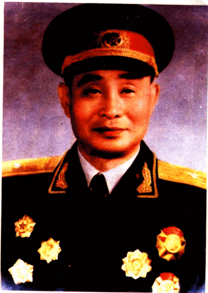
作者1955年被授予少将军衔时着军礼服照片。