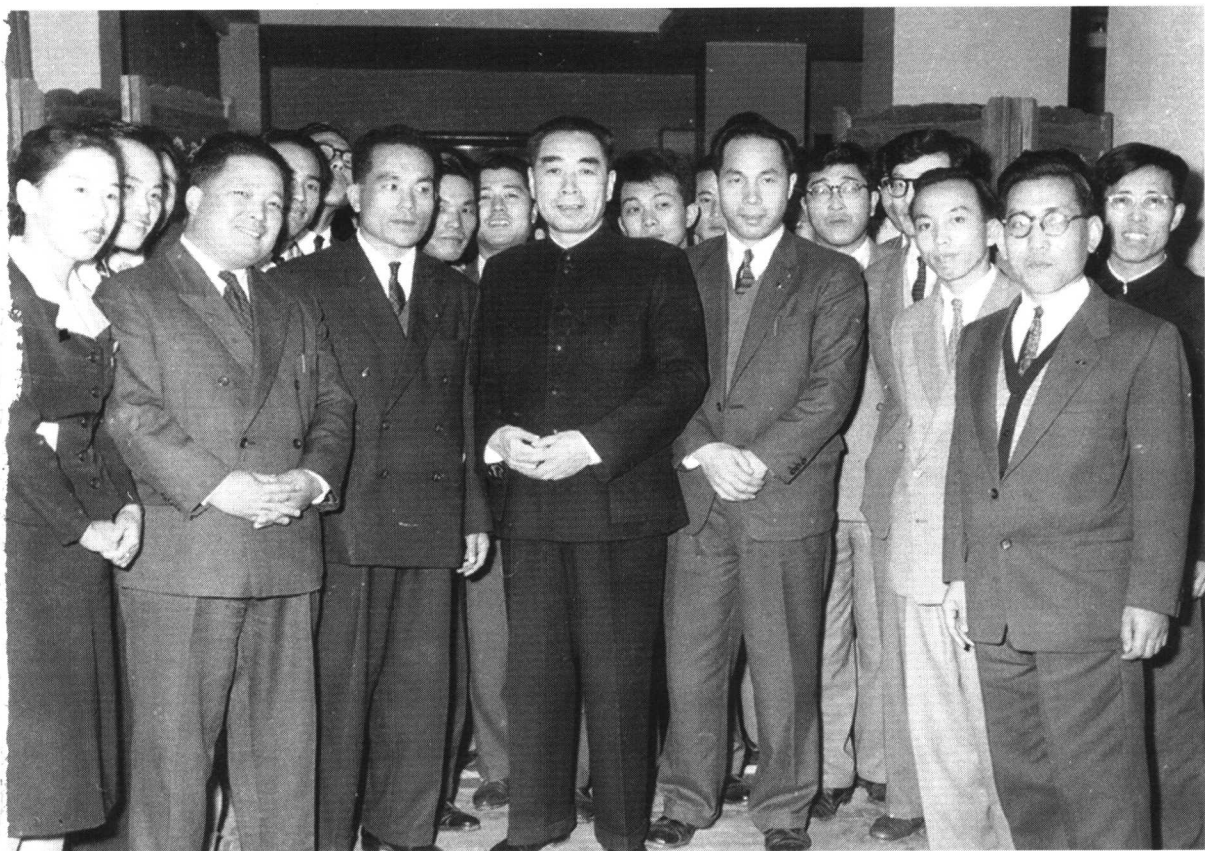
1956年9月，周恩来会见日本青年团协议会访华代表团。右一为本书作者。