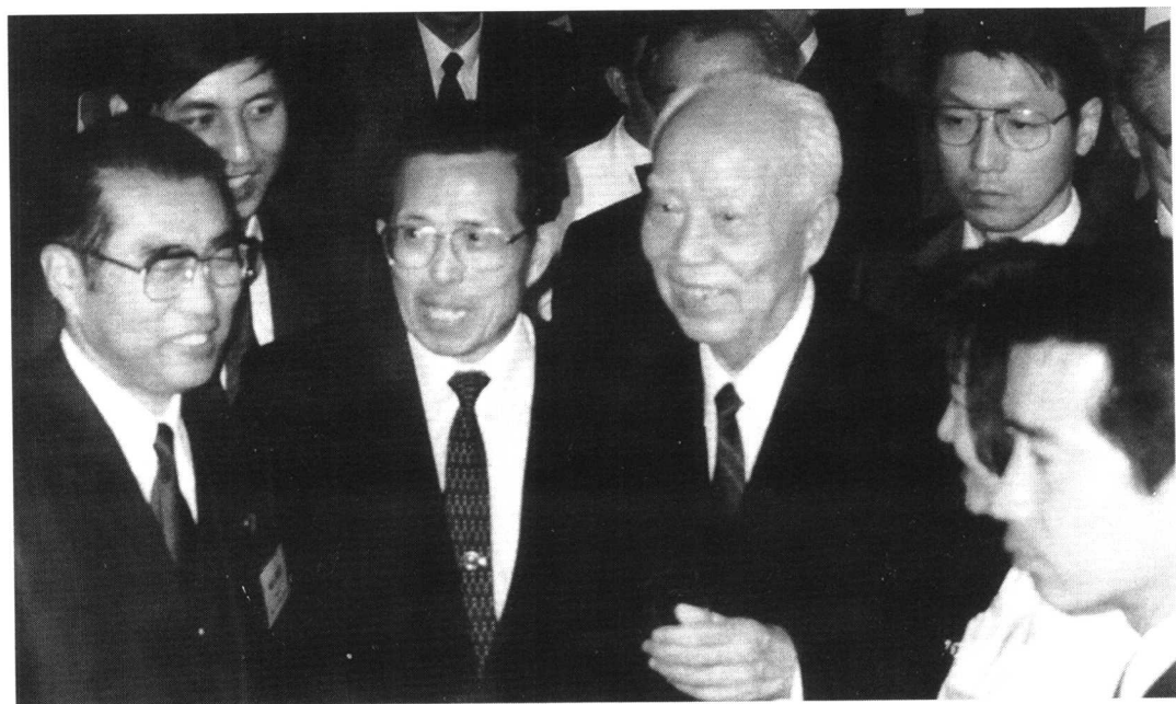
上图：1989年4月12日，李鹏总理（左二）访日时，在迎宾馆前同前来欢迎的竹下登首相（右二）握手。左一为朱琳夫人、右一为竹下直子夫人，杨振亚大使（左三）陪同。