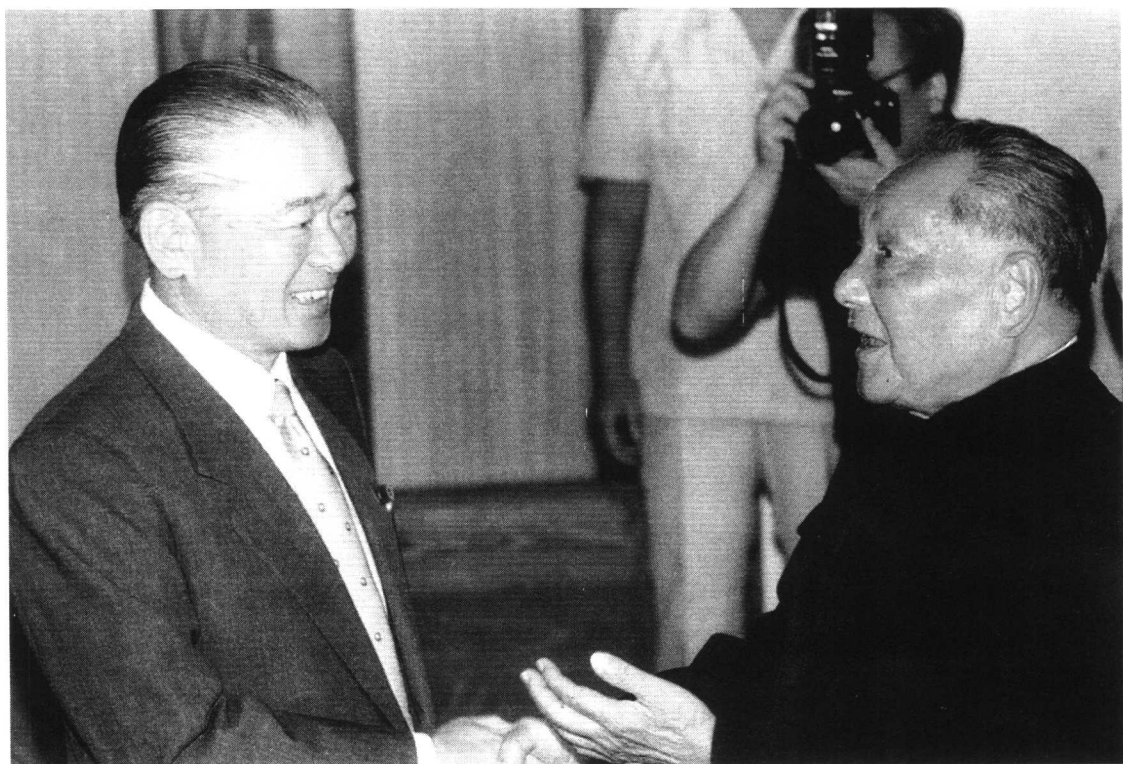
上图：1978年10月，邓小平为参加《中日和平友好条约》批准书交换仪式访问日本，同日本各界朋友在一起。 下图：1988年8月26日，邓小平会见在中国访问的竹下登首相。