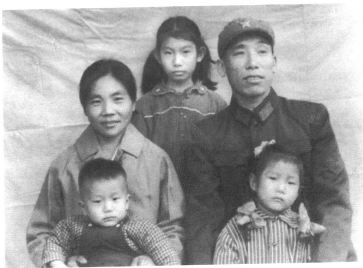
● 1965年作者全家合影于广东宝安平湖镇。