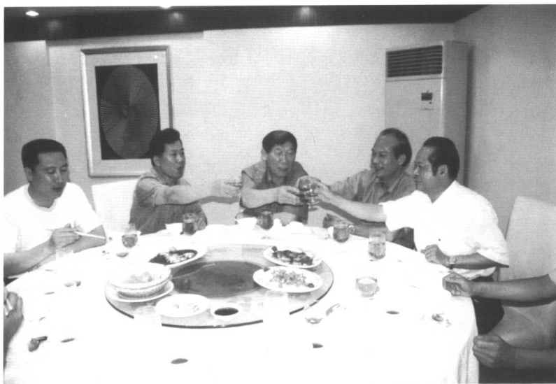
● 1997年8月深圳战友相聚。