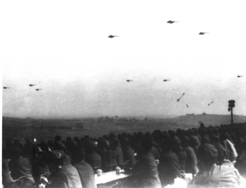
●加强陆军师对运动之敌进攻演习观看台。