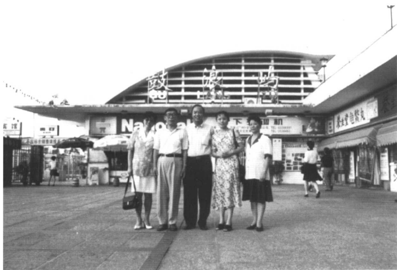
● 1997年8月于厦门鼓浪屿会见战友。