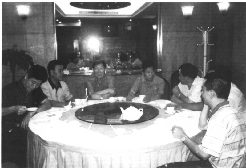
● 1997年8月广东番禺战友重逢。