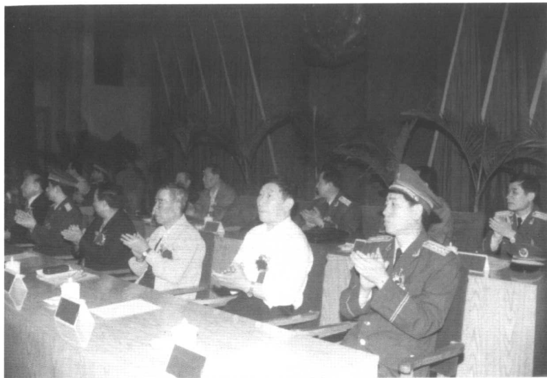
● 1999年5月18日作者在河南某地参加武警某师师史馆开馆典礼。