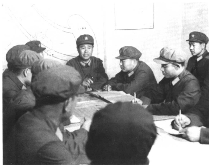
● 师党委会研究决心部署。