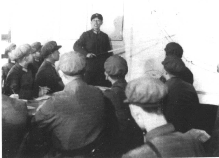
● 1982年10月某师豫西三里寨大演习中，师首长拟定作战方案。