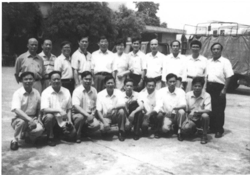
● 1997年8月于广东顺德市乐从镇战友相聚。