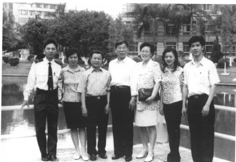
● 1997年8月于广东茂名战友重逢。