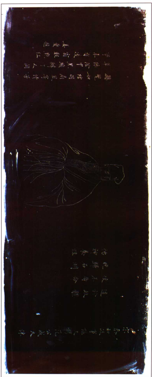
范成大畫像（蘇州范成大祠內）