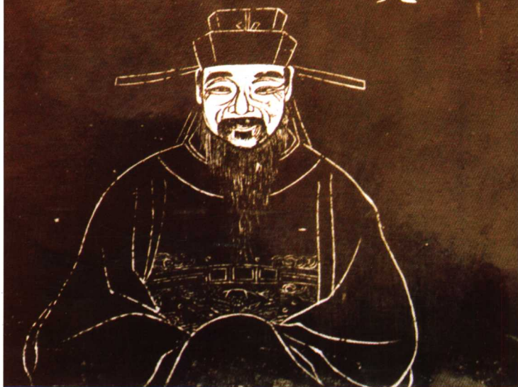
蘇州滄浪亭范成大石刻畫像（五百名賢祠）