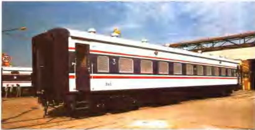
四方厂设计生产的出口坦赞铁路的客车