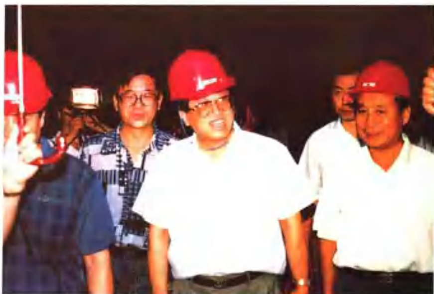
1995年8月3日，铁道部部长韩杼滨（中）在中车公司党委书记杜景新（右1）陪同下到沈阳厂检查工作。