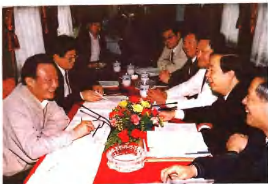
1995年5月20日，国务院副总理吴邦国（左1）与铁道部部长韩杼滨（左2），副部长孙永福（右2）等领导同志在四方厂生产的新型公务车上研究工作。（刘恩忠摄）