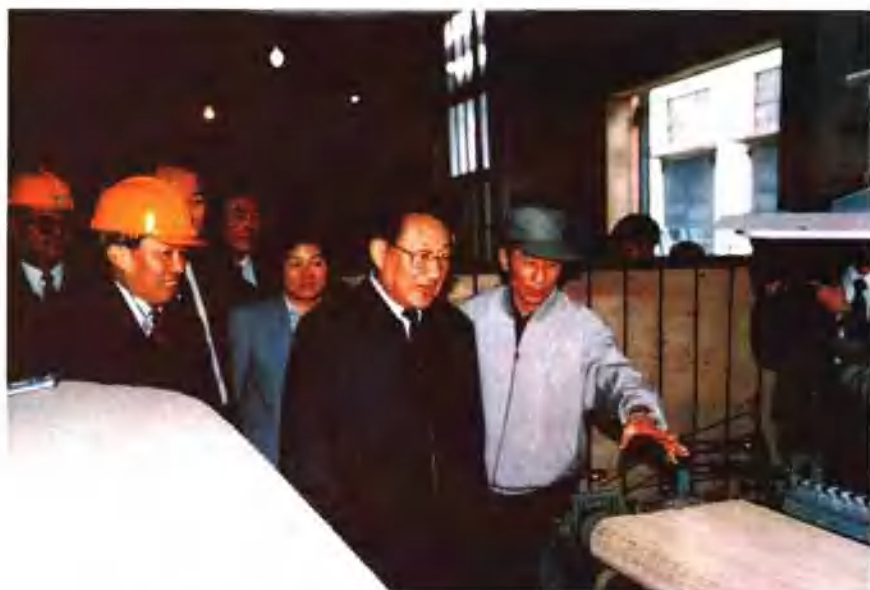
1995年4月18日，国务院副总理李岚清（右2）视察贵阳厂。