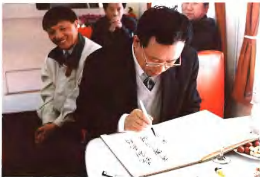
1995年4月18日，铁道部副部长国林在参观南京浦镇厂生产的中长途双层客车时题词。