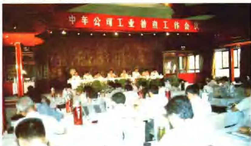
1995年8月，中车公司在石家庄厂召开工业普查工作会议。