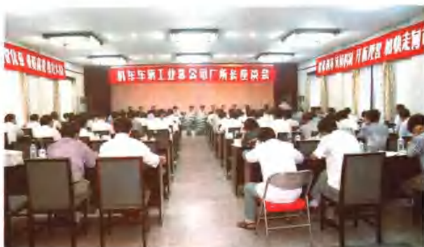
1995年7月24~28日，中车公司在二七车辆厂召开机车车辆工业厂长、所长座谈会。