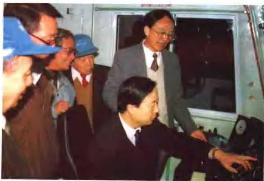
铁道部副部长孙永福到株洲电力机车厂察看韶山改进型电力机车。