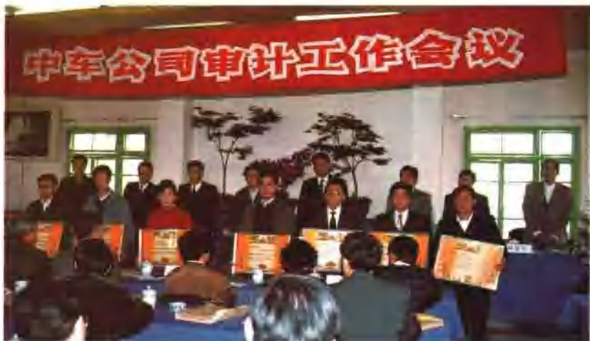
1995年4月17日，中车公司在成都厂召开审计工作会议。