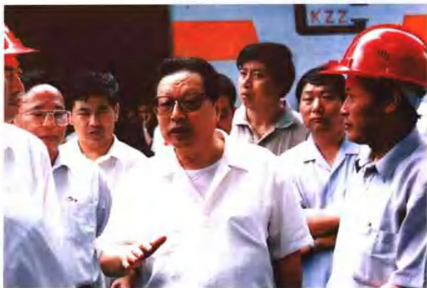
1995年7月27日，乔石委员长视察长客厂。