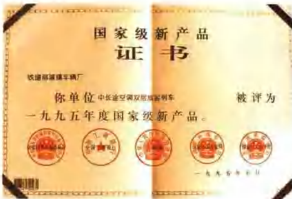
南京浦镇厂设计生产的中长途空调双层旅客列车被评为1995年度国家级新产品。下图为中长途空调双层餐车。 (南京浦镇厂供稿)