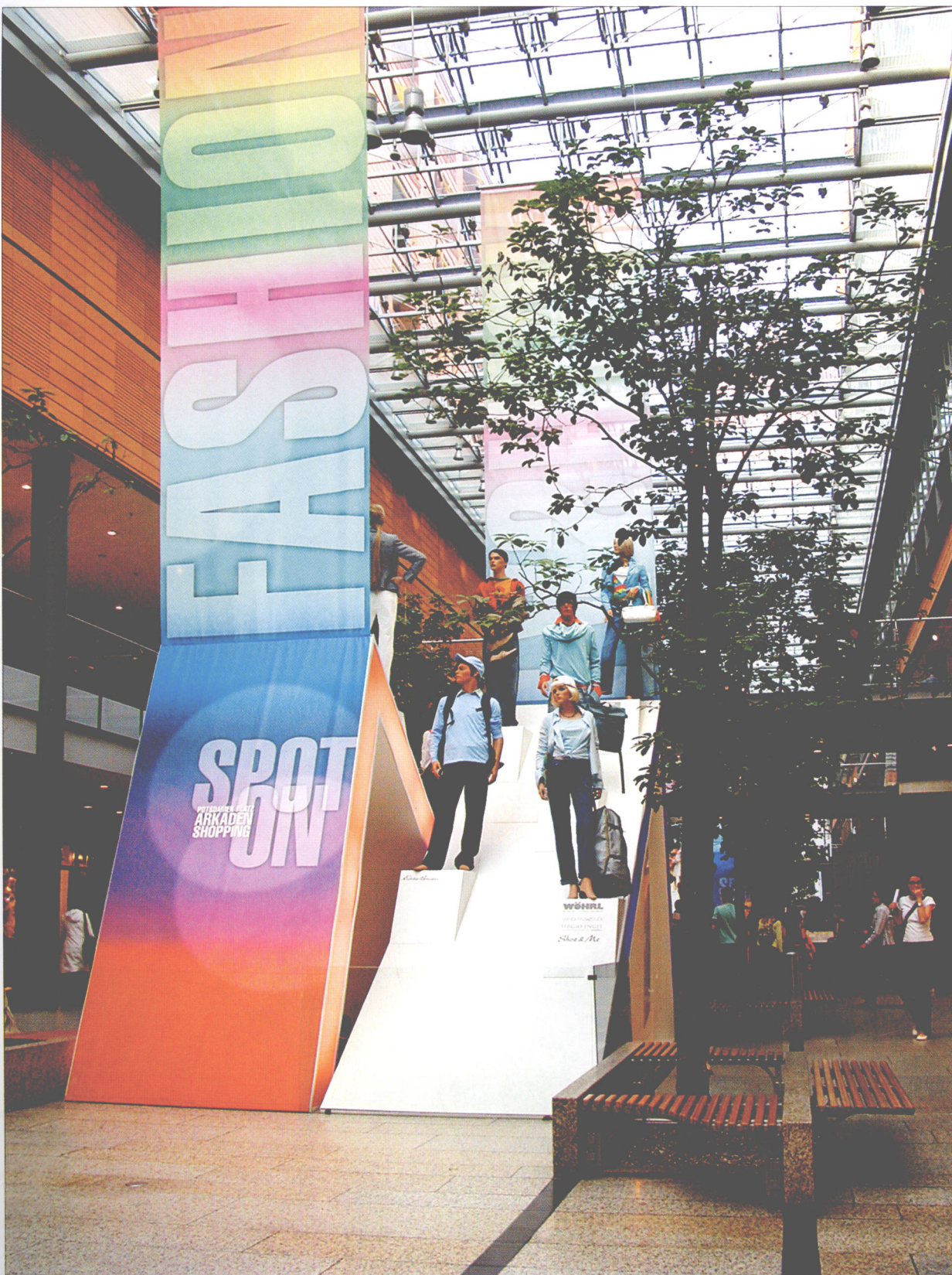
德国 柏林 商场时尚展示