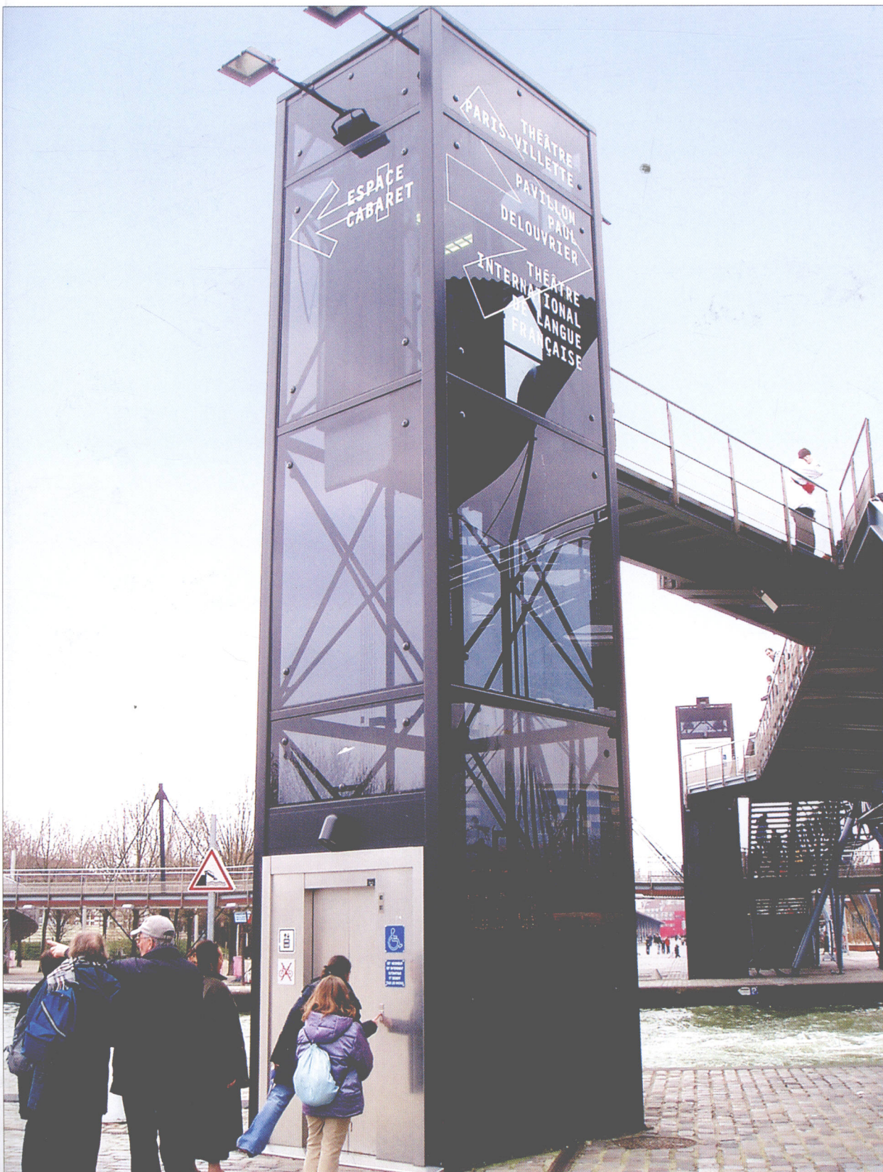
法国 巴黎 拉维莱特 导向以构筑物形式出现， 成为整体环境的一部分。