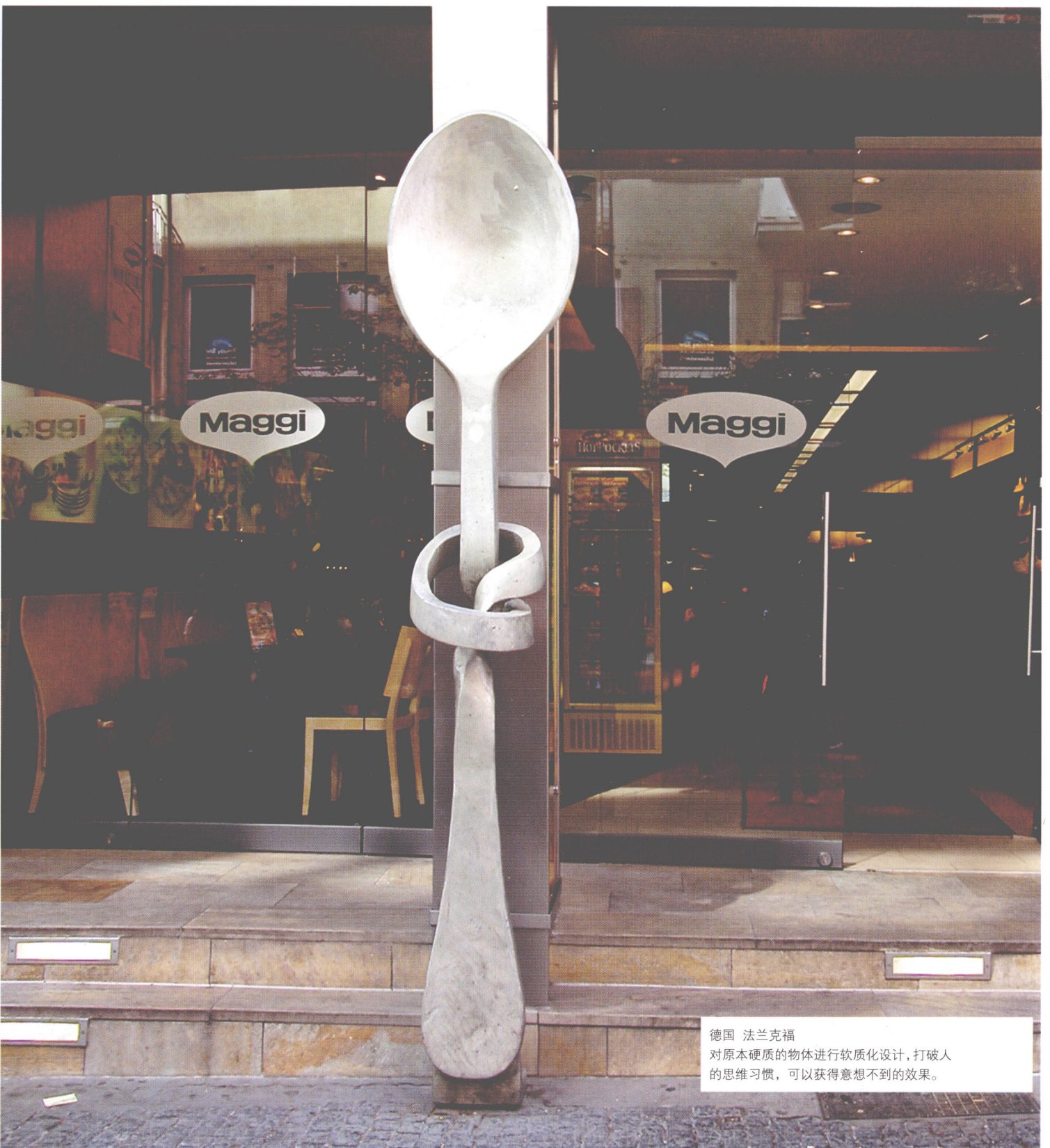
德国 法兰克福 对原本硬质的物体进行软质化设计,打破人的思维习惯,可以获得意想不到的效果。