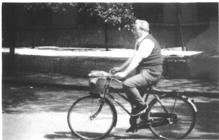
多姿多彩的老年生活