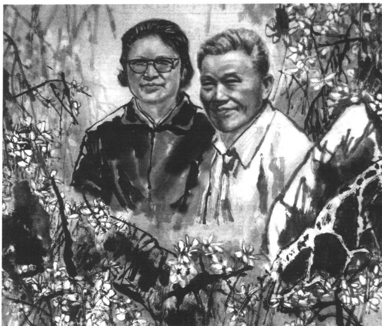
《双亲颂》 作者 李国维

(作者:原山西经济出版社总编辑 山西人民出版集团副总编辑、编审 山西省出版导刊高级职称评审委员 现任黄河书画研究院副院长 山西省世界经济学会副会长)