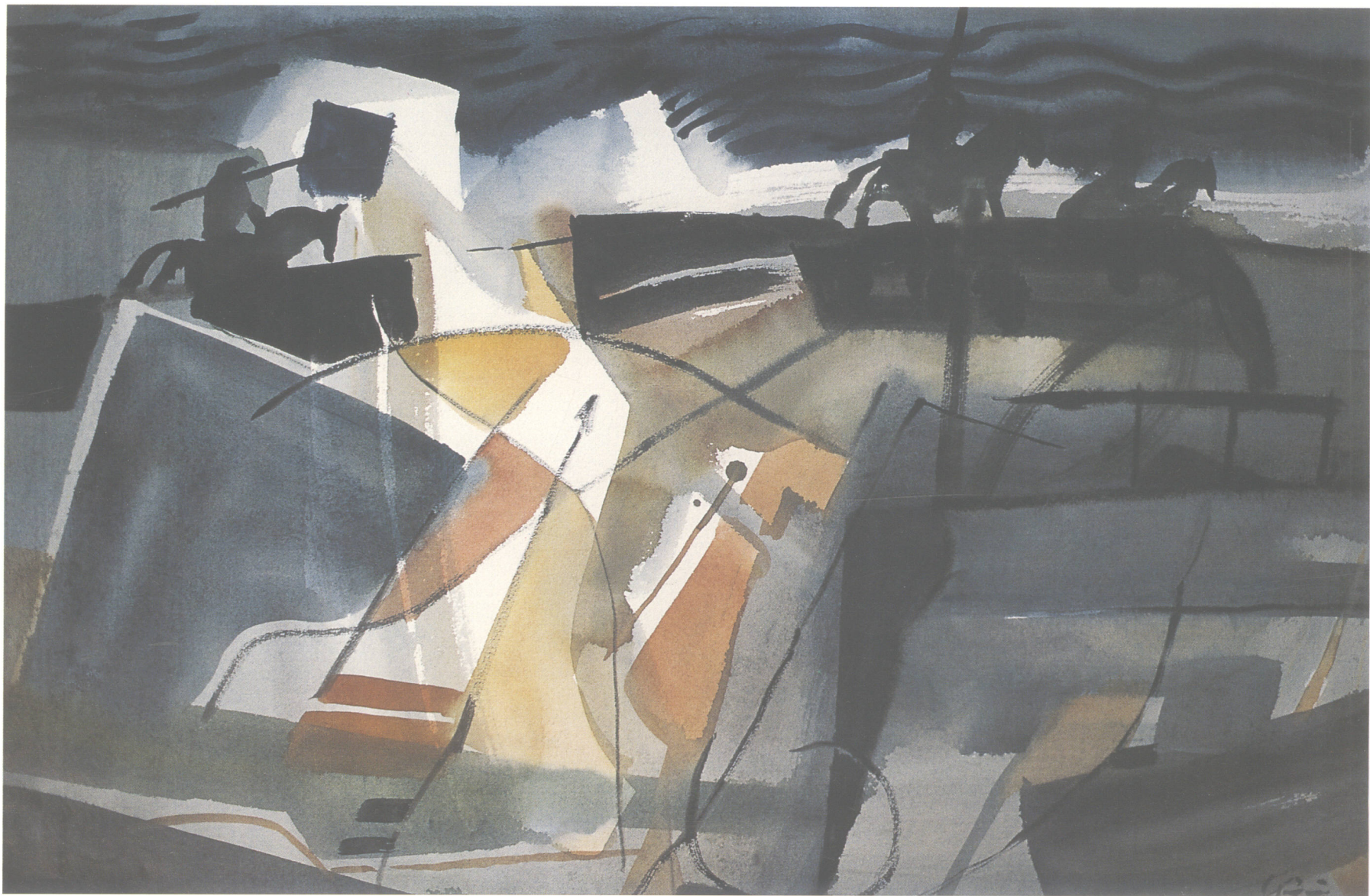
■ 背水一战 兵法组画之二 2002年(76 × 54cm)