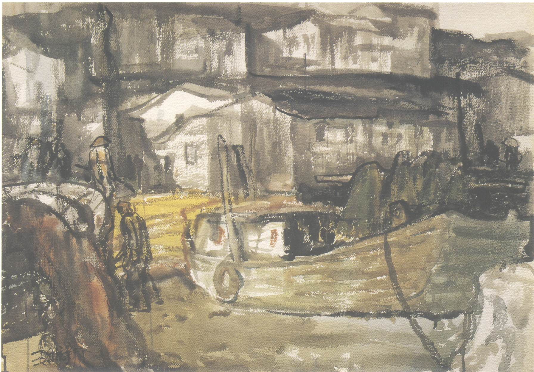
■ 潮讯之后 1991年(73 × 54cm)