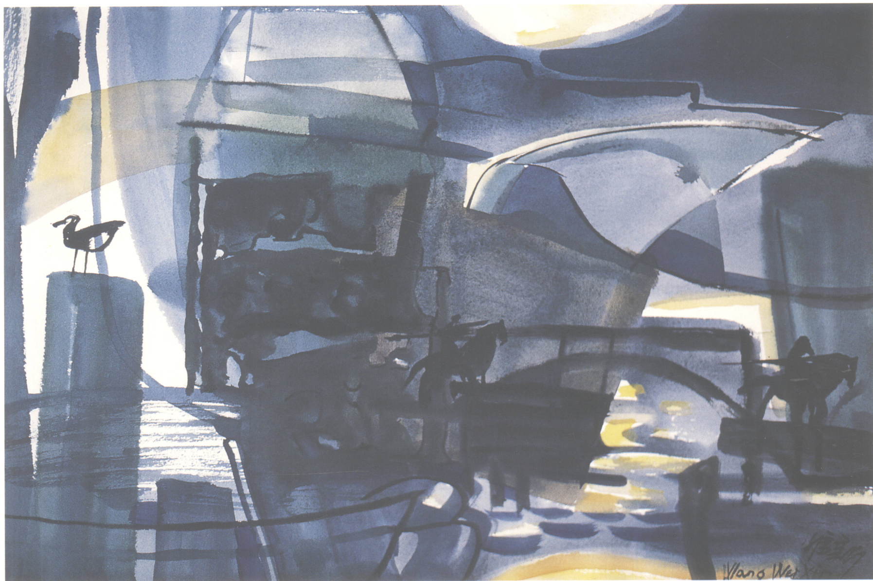
■ 夜袭 兵法组画之五 2002年(76 × 54cm)