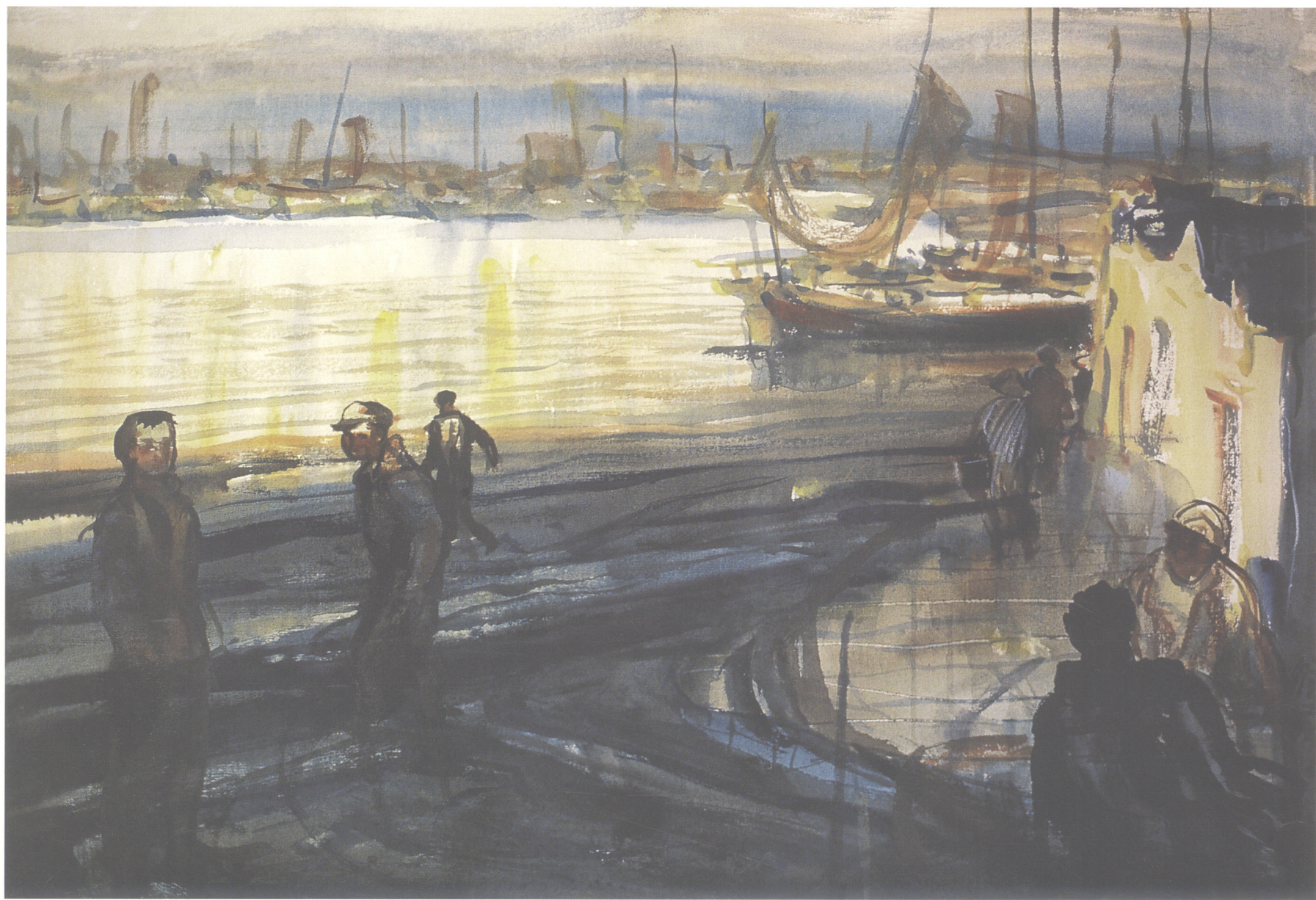
■ 傍晚 1992年(76 × 54cm)