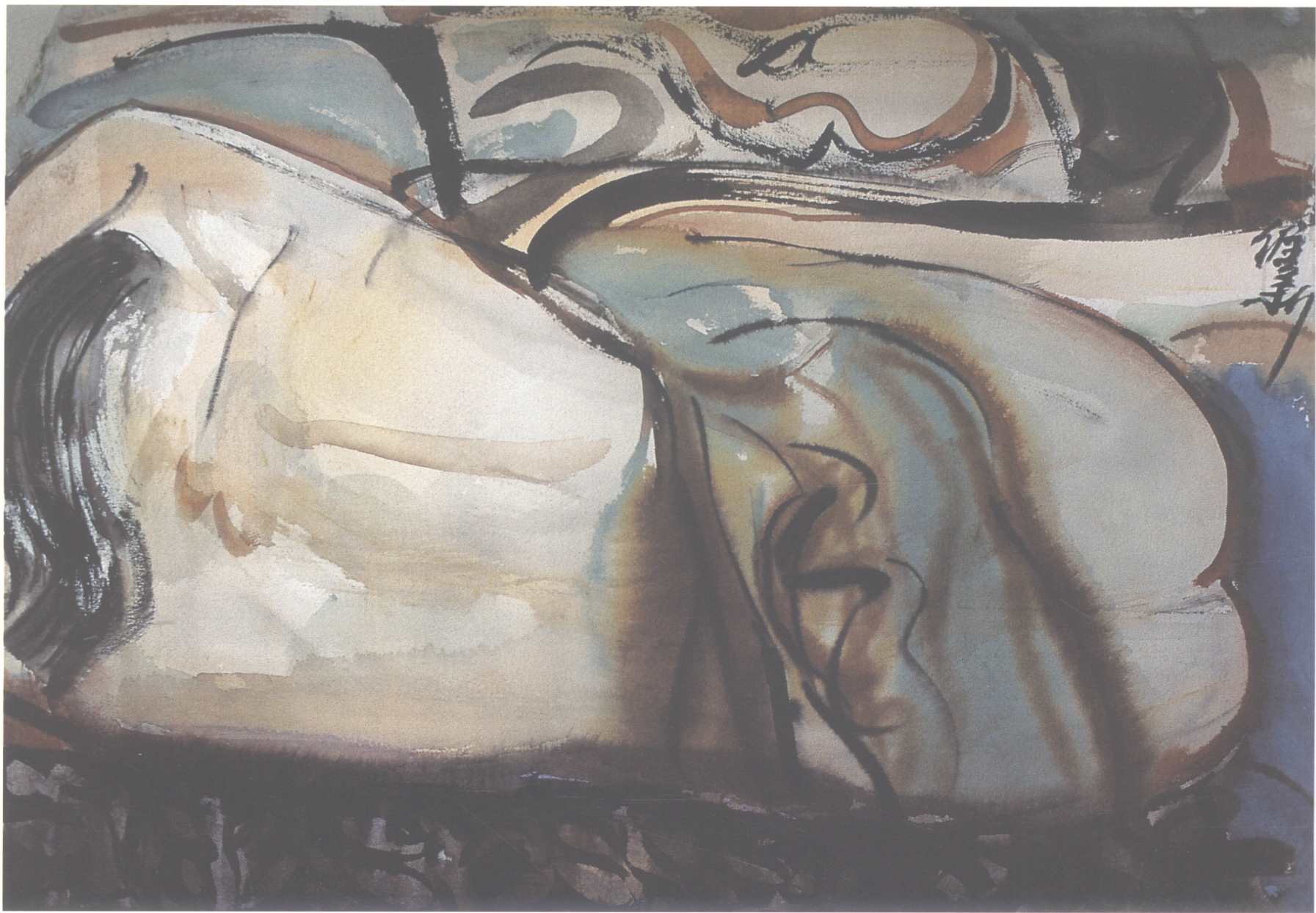
■ 女人体 1999年(76 × 54cm)