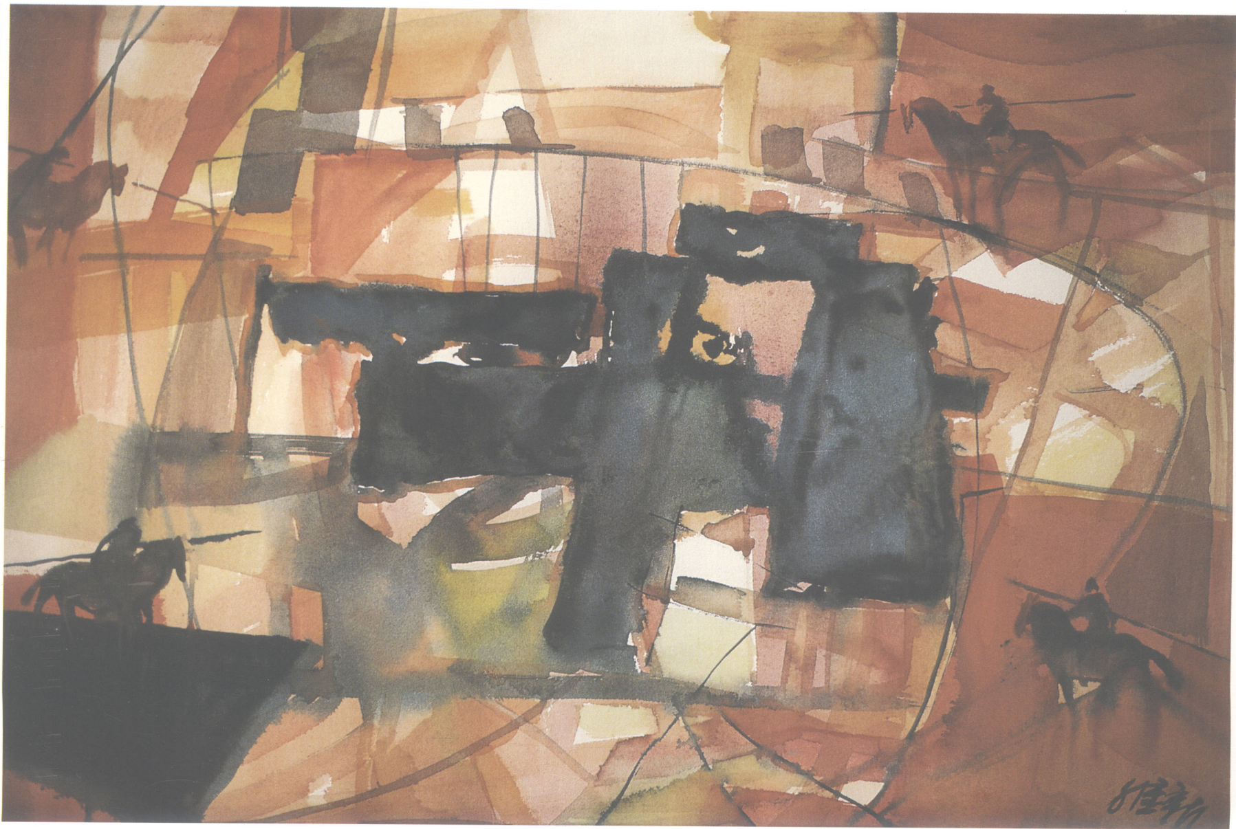
■ 四面出击 兵法组画之三 2002年(76 × 54cm)