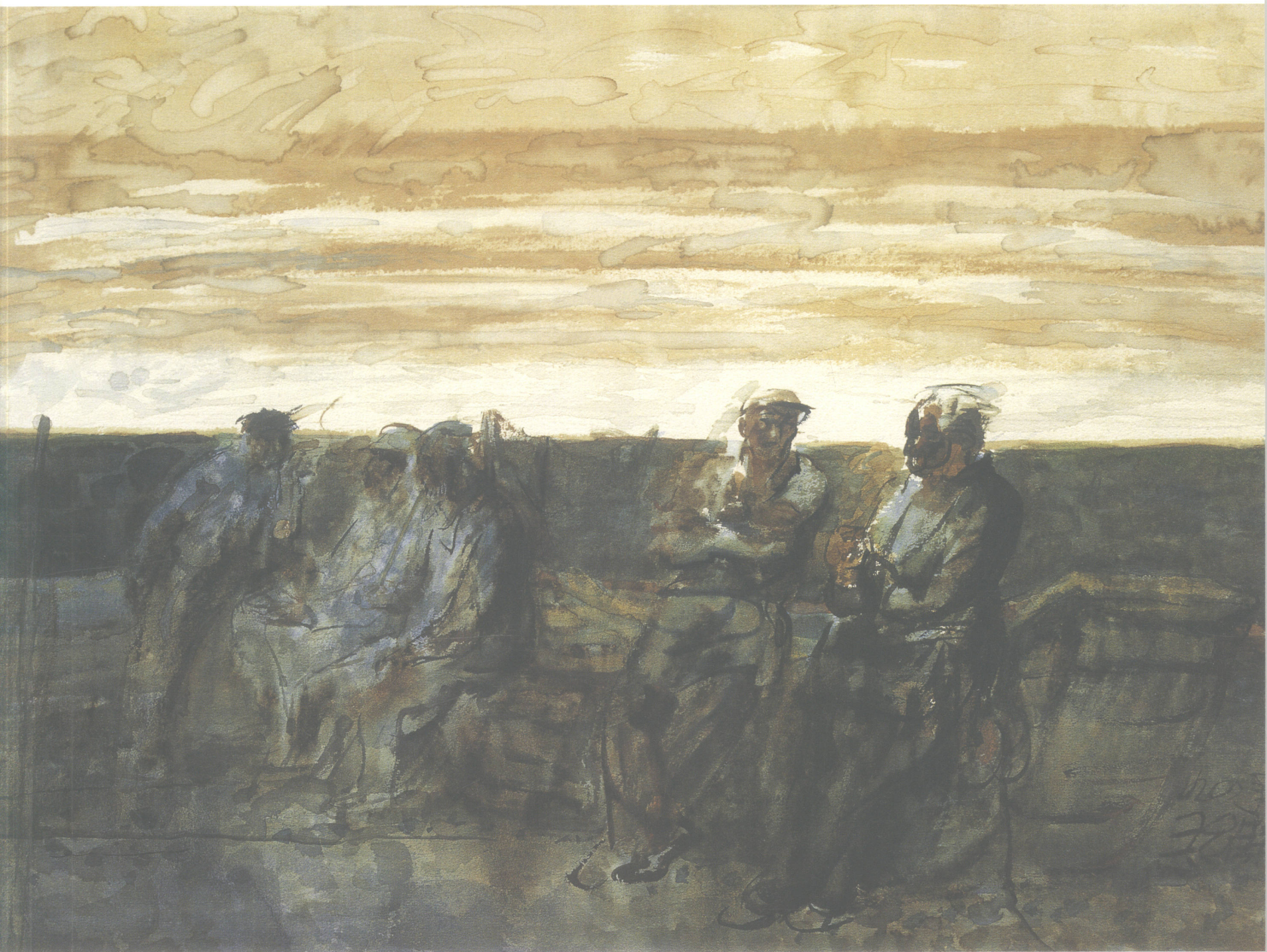
■ 海风 1992年(76 × 54cm)