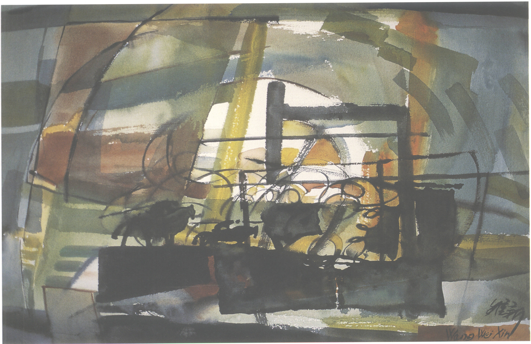
■ 伏击 兵法组画之四 2002年(76 × 54cm)