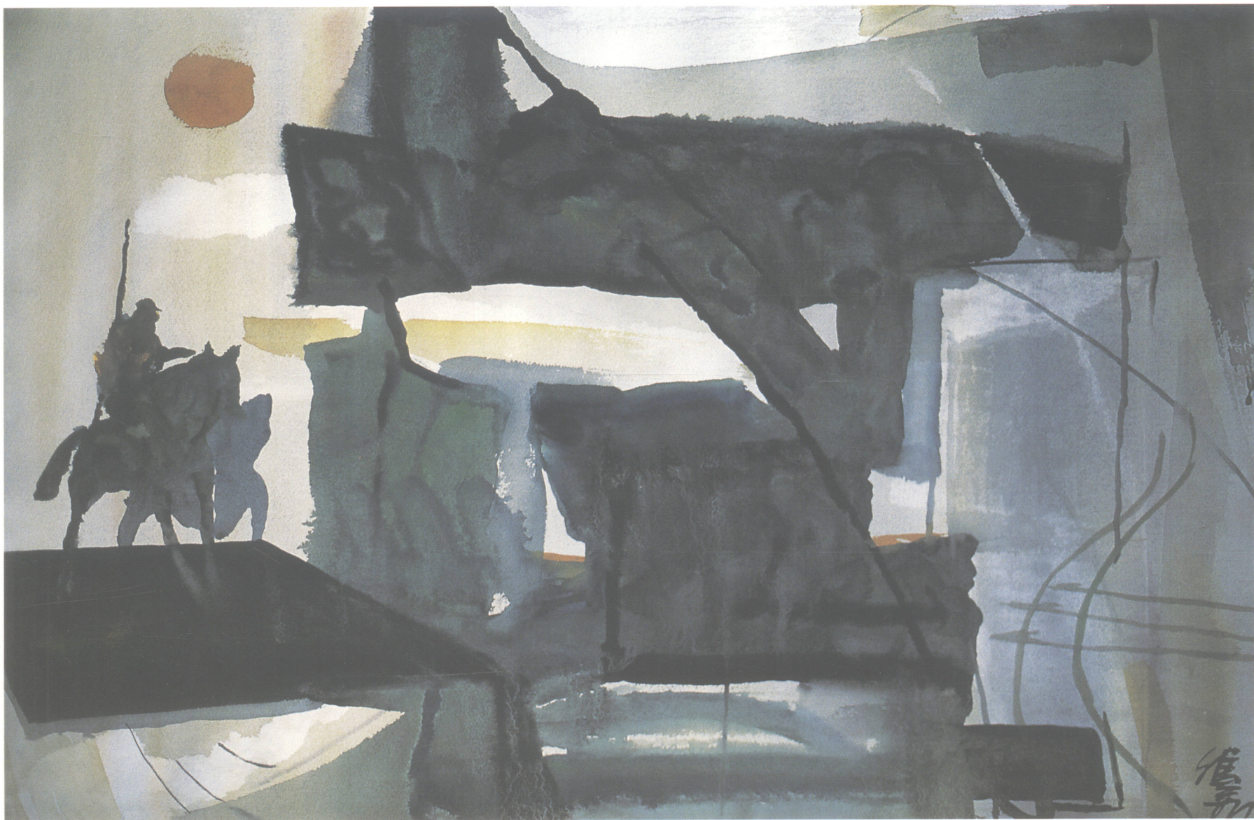
■ 攻城 兵法组画之一 2002年(76 × 54cm)