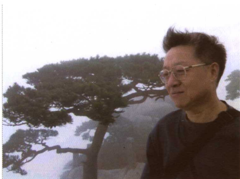
➤ 2006年7月在黄山 天都峰顶